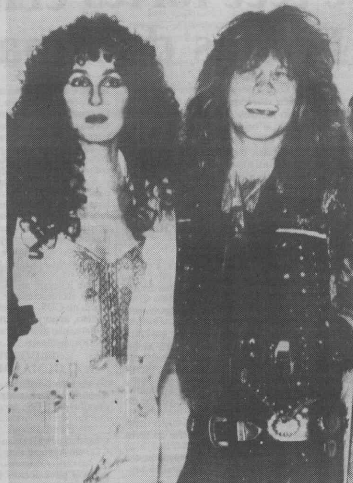
LOS ANGELES — A actriz Cher com o cantor Bon Jovi depois do seu grupo ter sido galardoado com o Prémio da Música Americana.

Mostrou-se adepto de «um diálogo permanente entre os meios científicos, o Estado e a sociedade» com o objectivo de conseguir «novas e mais proveitosas formas de cooperação».