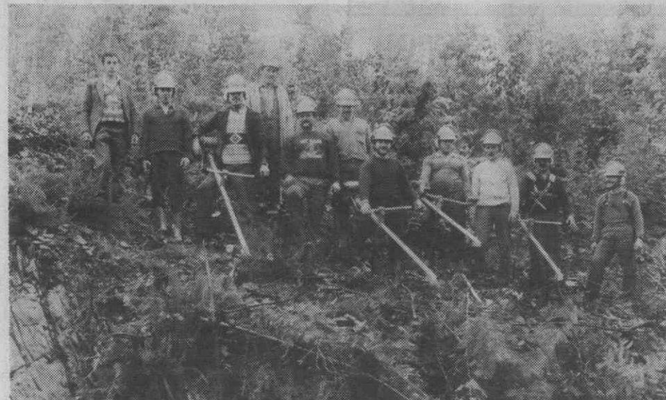
Os onze «assalariados» que, depois da frequência de um curso de formação na Lousã, estão a criar condições para que a prevenção e a segurança sejam uma realidade.