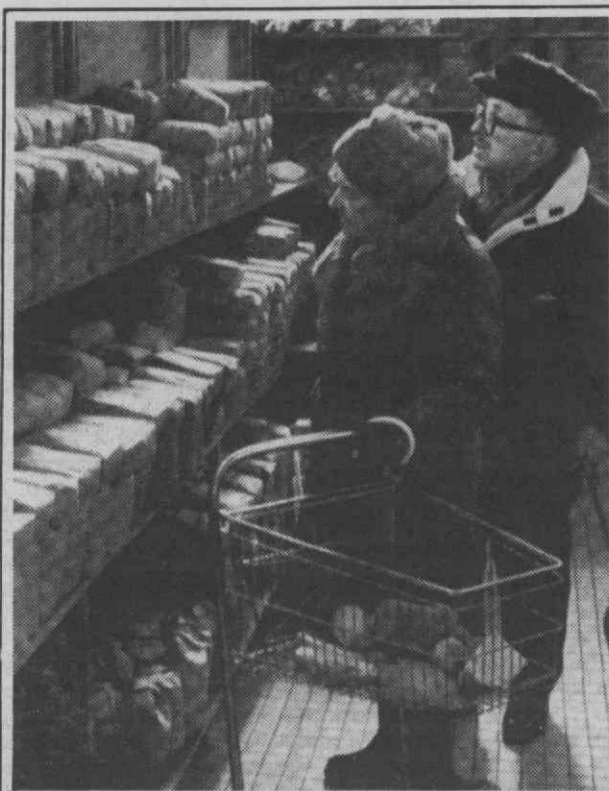
VARSOVIA — Consumidores polacos escolhendo cuidadosamente os bens necessários, num posto de venda, após ter ocorrido o maior aumento de preços sobre produtos alimentares, desde a lei marcial em 1982.