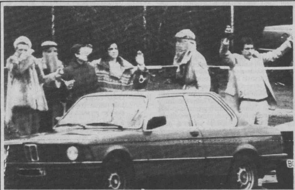
BOCHUM (Alemanha Federal) — Assaltantes de um Banco com reféns que tomaram durante tentativa de roubo no centro de Bochum.

Fontes do Vaticano consultadas pela agência noticiosa EFE não quiseram pronunciar-se sobre a atitude de Lefebvre, nem sobre o conteúdo da informação de Monsenhor Gagnon, a qual, segundo afirmaram, se encontra «nas mãos do Papa».