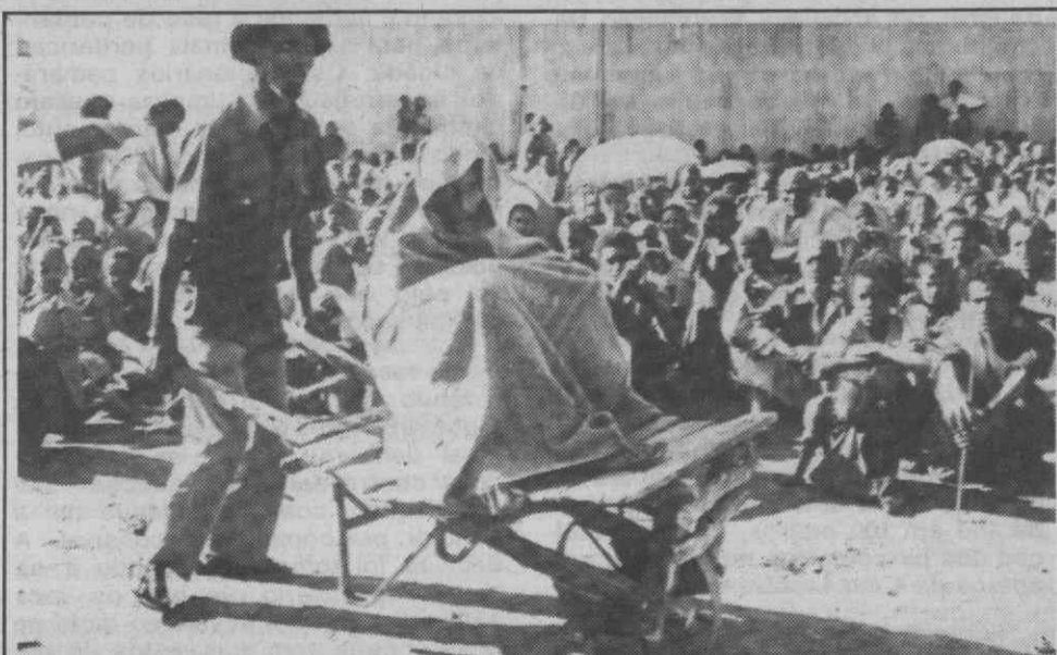
KOREM (Etiópia) — Um etiope sendo levado num carro de mão para a clínica, enquanto centenas de outros etíopes famintos o seguem à sua passagem.