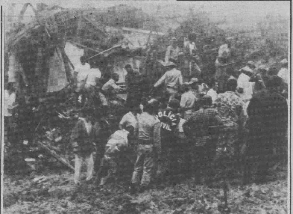
PETRÓPOLIS (Brasil) — Destroços provocados pelos desabamentos de terras, devido às chuvas dos últimos dias na região do Rio de Janeiro.

A adopção da requisição civil começou a configurar-se no horizonte após a administração da Carris ter indicado aos sindicatos quais os serviços mínimos que deveriam ser realizados desde ontem.