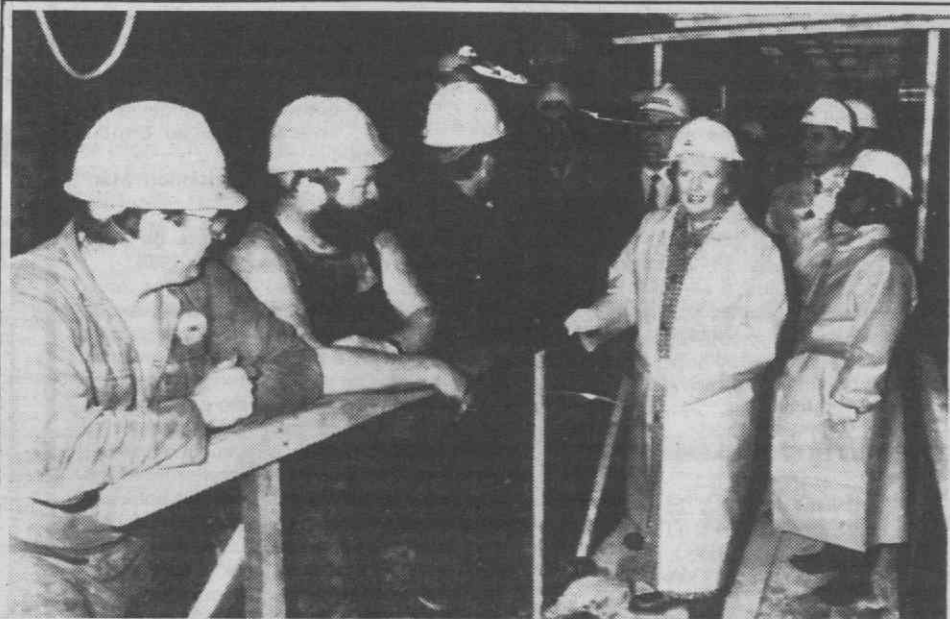
GRÃ-BRETANHA — A Primeira-Ministra, Margaret Thatcher, visita as obras de construção do túnel sob o Canal da Mancha, 40 metros abaixo do fundo do mar.

Outra instituição ligada ao Banco da China, o Chiao Comercial Bank, registou um aumento de 37 por cento dos seus lucros, que totalizaram 10,3 milhões de dólares em 1987.