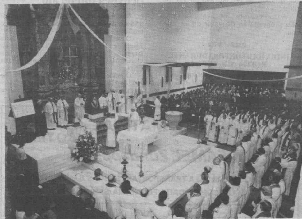
Um aspecto das cerimónias, no interior da Sé.

Assim, e a partir das 14 horas de 3.a-feira os foliões aveirenses vão desfilhar pelas ruas de S. Sebastião, 5 Bicas, Eça de Queiroz, Combatentes da Grande Guerra, Coimbra, Ponte Praça, Av. Dr. Lourenço Peixinho, Silvério Pereira da Silva e festa final no Pavilhão das Feiras.