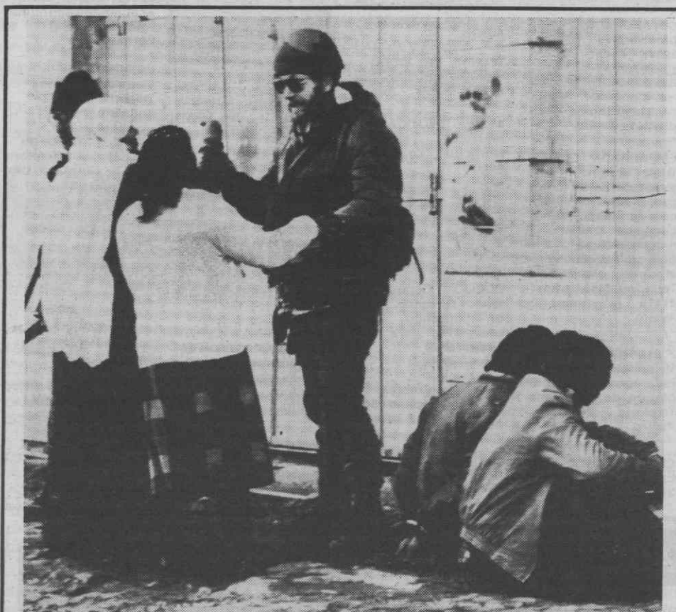
Esta é uma imagem que se tornou habitual nos dias de hoje: soldados israelitas prenderam mais dois palestinianos e «ouvem» as lamentações das mulheres. Com as medidas de força utilizadas por Israel a situação tende a agudizar-se, tanto mais que a greve se mantém.

Entretanto, organizações humanitárias e sindicais que também denunciaram os assassinios, revelam que os «esquadrões da morte» foram reactivados e mantêm «ligações com o Governo e Exército».