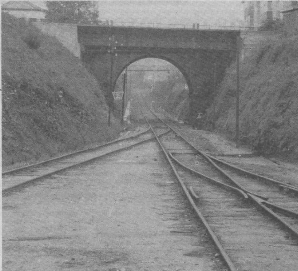
O projecto da elevação do tabuleiro do Pontão está já concluído.

Um dos aspectos que «estava mal» era a altura dos pilares laterais, construídos com 5,2 metros de altura. A C.P. «obriga» a que a altura seja de 5,5 metros, de modo a «permitir uma possível electrificação da via».