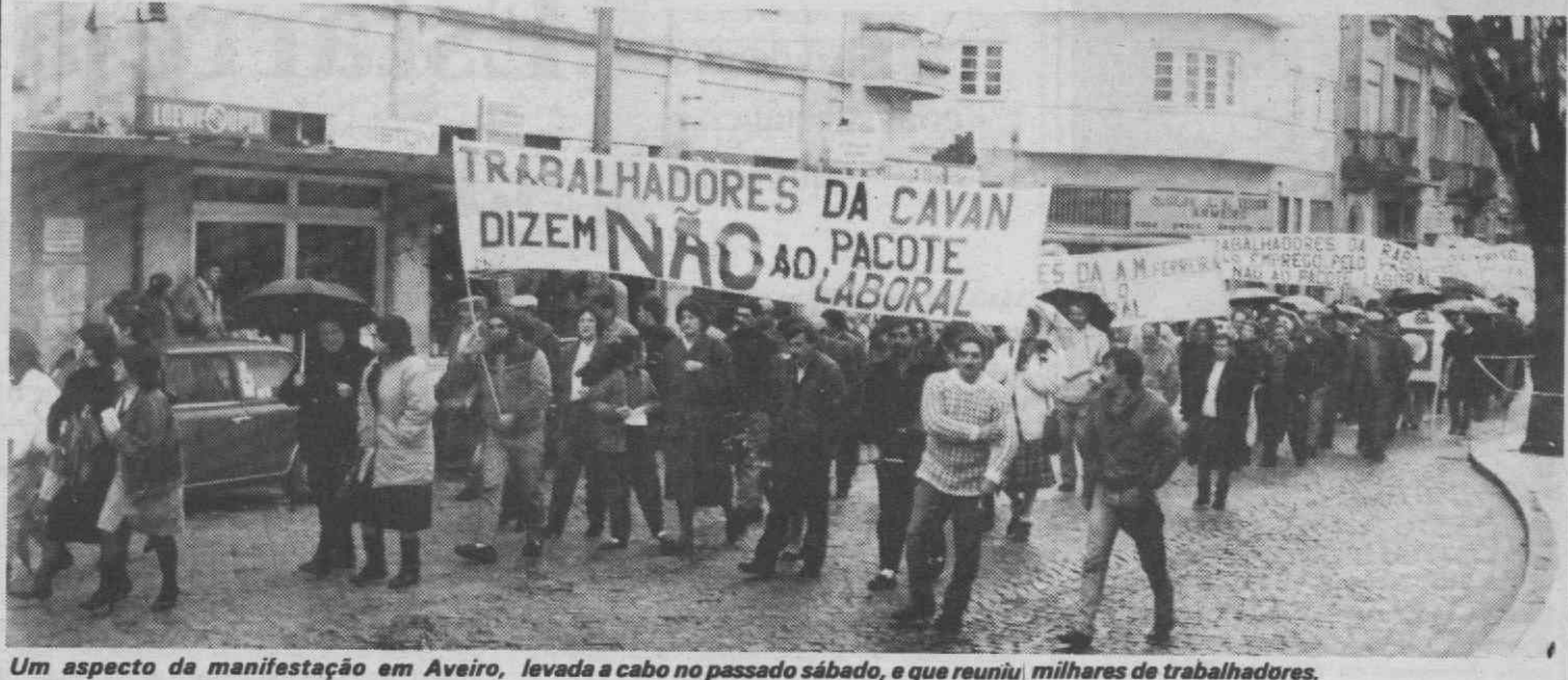
Um aspecto da manifestação em Aveiro, levada a cabo no passado sábado, e que reuniu milhares de trabalhadores.