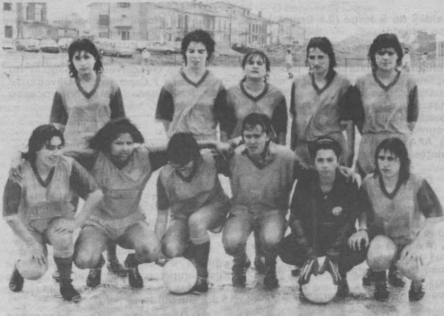
O conjunto de Alba.

Teve início, este fim-de-semana, o Campeonato Distrital de Futebol Feminino, que conta com a participação de quatro equipas. Estrela Azul, Alba, Ferreirense e Espinho, anotando-se a falta do Paivense. Logo na primeira jornada o destaque foi para o Estrela Azul, equipa de Cacia-Nova, que goleou o Alba (13-0), afirmando-se categoricamente como a mais séria candidata aos nacionais. E por que não pensar em voos mais altos?!... há ali valores individuais de gabarito.