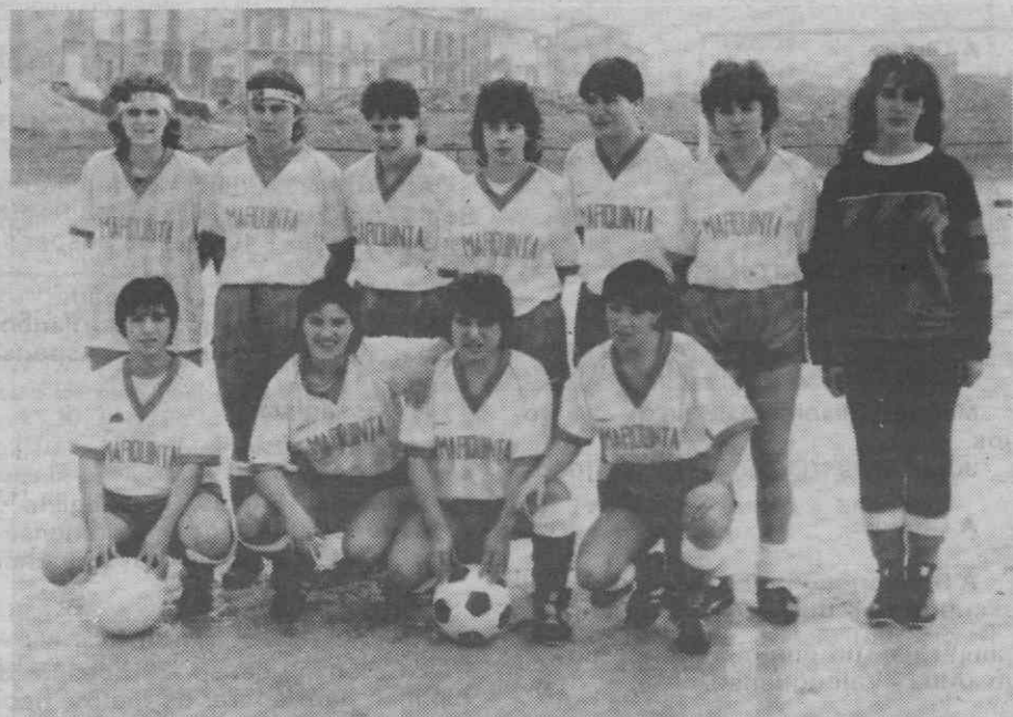
A equipa do Estrela Azul.