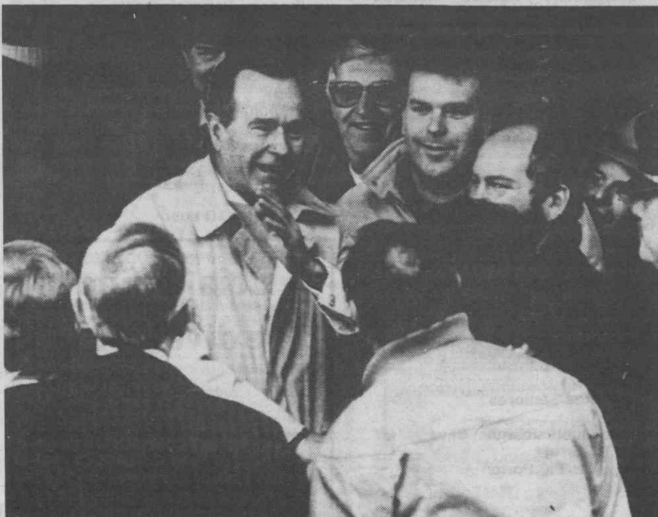
ST. LOUIS — O vice-Presidente George Bush visita fábrica de cerveja durante a sua ronda de campanha eleitoral para as primárias do Partido Republicano.

Campeonato Distrital de Juvenis Jogo em atraso Espinho - Esmoriz, às 10,30 horas.