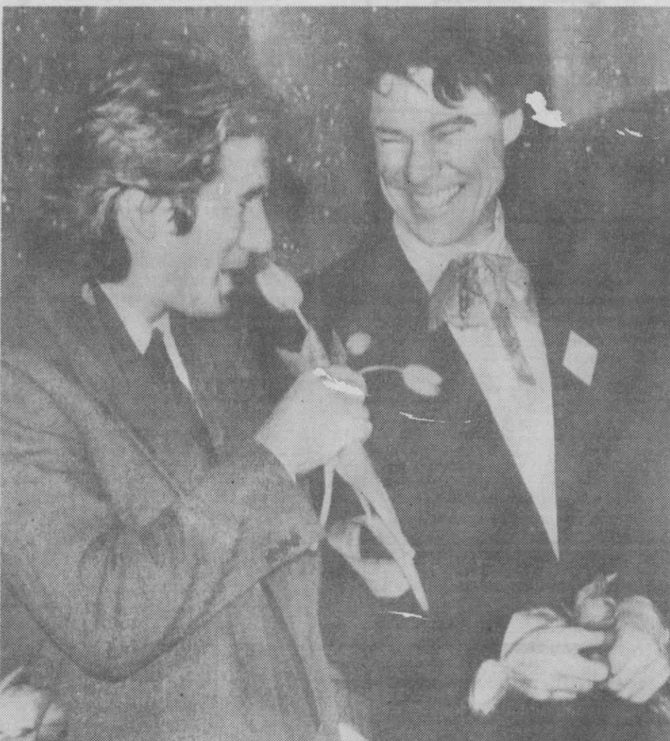
MOSCOVO — O actor norte-americano Richard Gere cheira um ramo de tulipas, acompanhado pelo dançarino do Ballet de Nova Iorque, Jacques d'Ambois, durante a sessão de abertura do maior festival de cinema norte-americano em Moscovo.

As tomadas de lucros, que causaram, uma baixa de 1,8 por cento na terça-feira, prosseguiram ontem «em boas condições», afirmaram peritos.