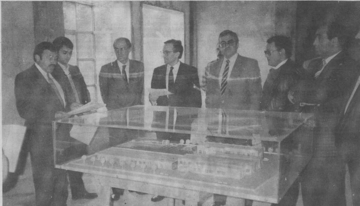
Durante a visita de Bagão Félix a Águeda, foi anunciada para Julho próximo a abertura do Centro de Formação Profissional.

O Centro de Formação Profissional de Águeda vai entrar em funcionamento no próximo mês de Julho, estando prevista a conclusão das obras para meados de Maio. A informação foi-nos dada por Arménio Bernardes, Director da Delegação de Coimbra do Instituto de Emprego e Formação Profissional (IEFP), durante a visita que o Secretário de Estado do Emprego e Formação Profissional, Bagão Félix, realizou, na passada terça-feira a Águeda.