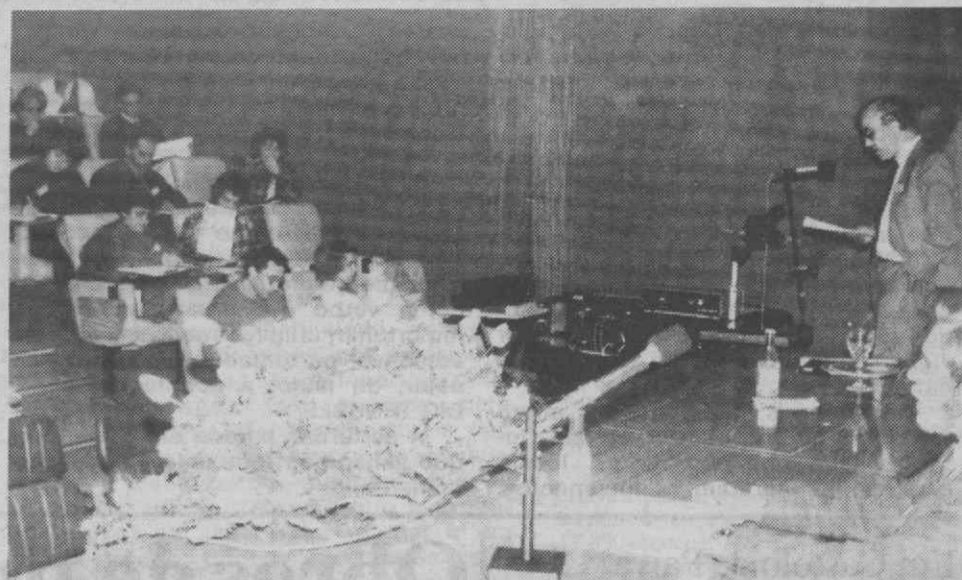
Existe um saber-fazer metodológico-tecnológico eminentemente pragmático dos modos de transmissão do saber científico-disciplinar.

A colocação das novas tecnologias ao serviço do ensino permite uma nova concepção na orientação e leccionação das matérias, permitindo, por exemplo, que o computador assista o aluno nas aulas de línguas estrangeiras.