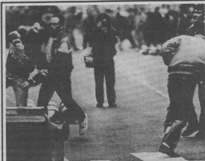
BEZIERS (França) — Agricultores franceses atiram pedras ao edifício administrativo da região, durante protestos, por serem obrigados a destilarem colheitas de vinho.