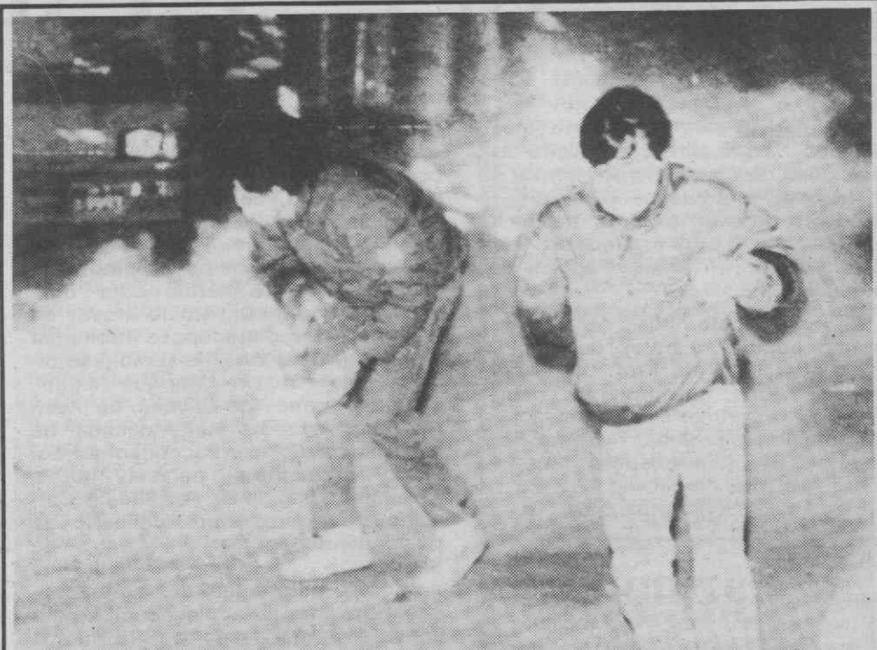
SEUL — Estudantes fogem às granadas de gases lacrimogéneos durante manifestações contra o novo Presidente, que ontem foi empossado.

O diploma do Ministério das Finanças será já aplicado na elaboração do Orçamento do Estado para 1989, acrescentou.