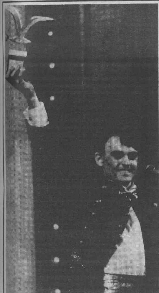
VIÑA DEL MAR (Chile) — O cantor italiano Marco del Freo sorri depois de ter vencido o Festival Internacional da Canção.

Entre 1986/87, as vendas portuguesas para Espanha aumentaram 62,8 por cento.