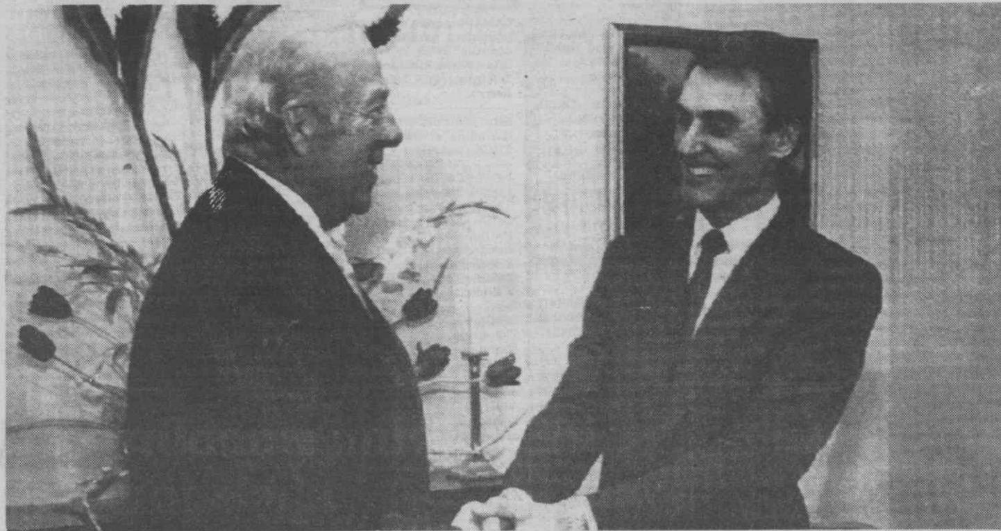
WASHINGTON — O Primeiro-Ministro Cavaco Silva cumprimenta o secretário de Estado George Shultz.

O Primeiro-Ministro português, Aníbal Cavaco Silva, apontou quarta-feira para duas linhas fortes da sua vinda aos Estados Unidos — comunicar à Casa Branca o seu próximo pedido de reanálise do acordo de defesa de 1983 e estar presente quando o Congresso discute o pacote de auxílio a Portugal.