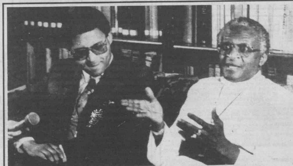
CIDADE DO CABO — Conferência de imprensa do arcebispo Desmond Tutu e do dr. Alan Boesak para condenarem a mais recente repressão sobre a oposição negra.

O preâmbulo do decreto-lei refere que o documento visa solucionar, «de uma forma directa e objectiva, a actual situação da justiça fiscal, reconhecidamente ineficaz e provocadora de sérios prejuízos tanto para os contribuintes como para o Estado».