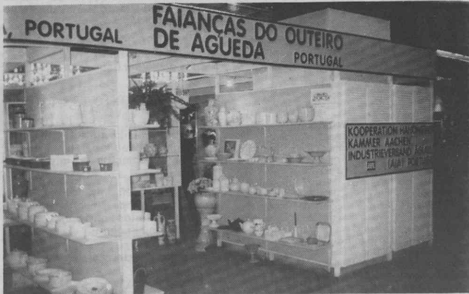
Um aspecto do «stand» no qual as empresas aguedenses mostraram os seus produtos em Frankfurt.

A carência de mão-de-obra especializada, nomeadamente de modeladores cerâmicos, é, sem dúvida, um dos grandes problemas do sector de cerâmica decorativa e louça de mesa. A falta de pessoal devidamente formado, como referem os responsáveis da AIA, «difícilmente poderá ser re-