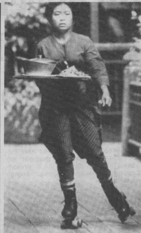
BANGKOK — Uma empregada de mesa patinando em pleno Restaurante Tamnak, considerado o maior do mundo.

Entre os países em desenvolvimento, os da América Latina e das Caraíbas foram os que tiveram as taxas de desemprego mais elevadas, mas também os que registaram mais progressos.