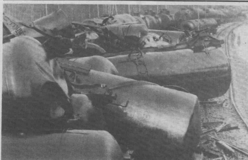
KLAIPEDA (Lituânia) — Aspecto de um gigantesco descarrilamento de um comboio-cisterna, que transportava combustivel.

Segundo a lei soviética, as firmas ocidentais não podem ter uma participação superior a 49 por cento nas sociedades mistas.