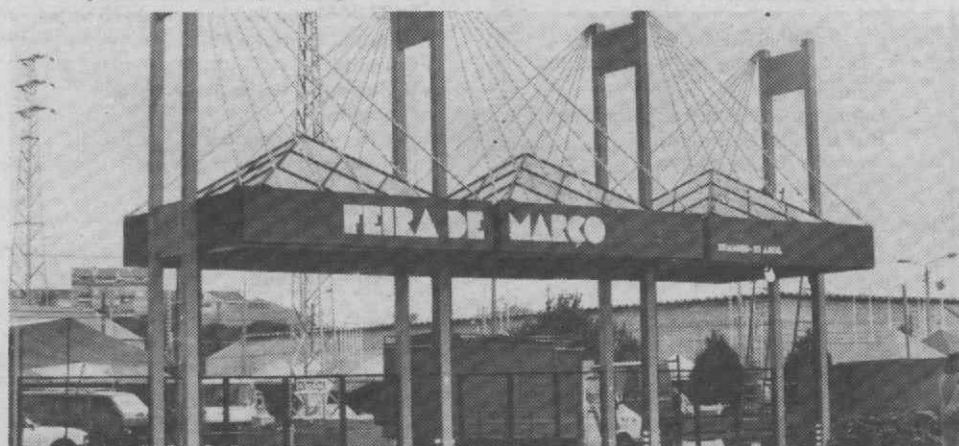
A Feira de Março/88, na sua 554.ª edição, agigantou-se e afigura-se como o melhor certame de sempre desta tradicional e enraizada «festa» da cidade.

Para já não falar na hipótese, imediatamente posta de lado, de beber daquela água - que já provocou dores de barriga em algumas crianças, após a sua ingestão - a própria possibilidade de tomar banho começa a assustar dada a forte coloração apresentada pela água, que devia ser incolor, como rezam as regras da água própria para consumo.