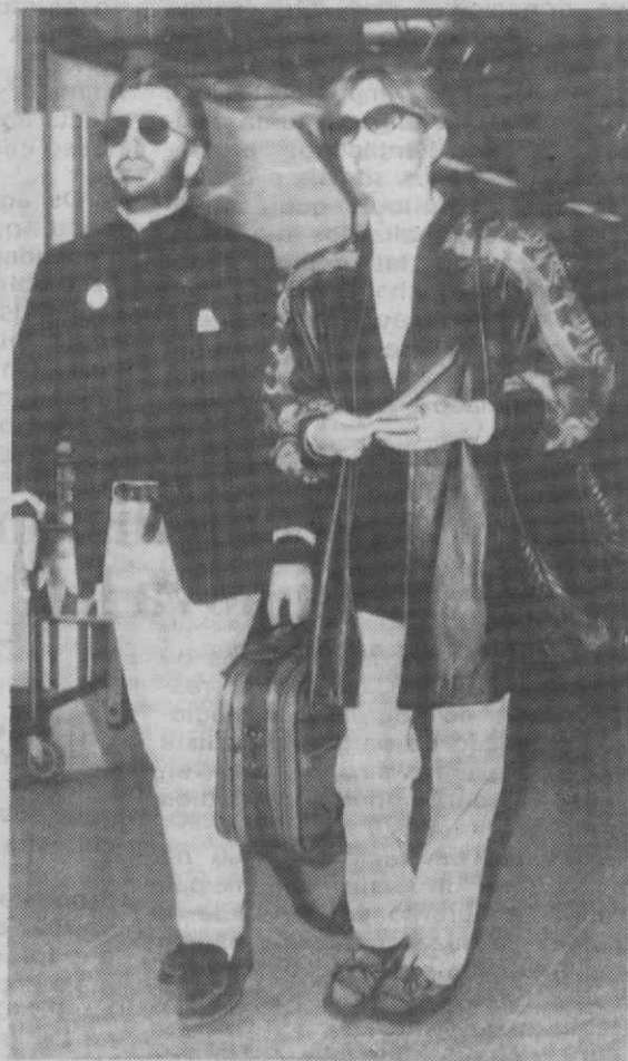
LONDRES — Ringo Starr e mulher Barbara Bach à partida para Los Angeles.

A sessão de trabalho terminou com a apresentação da possibilidade de barcos portugueses fazerem estudos, a título experimental, em águas guineenses, em colaboração com técnicos locais.