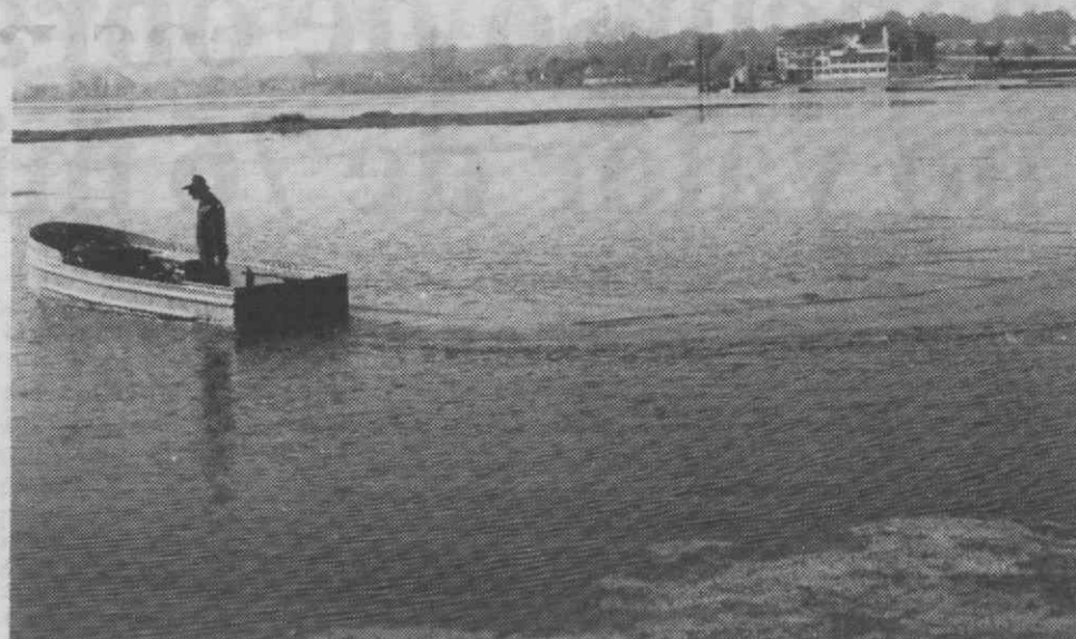
A Pateira de Fermentelos esteve em foco na última reunião camarária.