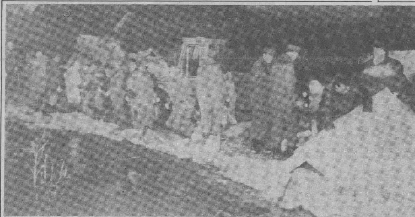
STRAUBING (Alemanha Federal) — A população ajuda os soldados a improvisar um dique para impedir a progressão de uma inundação provocada pelo arrebentamento de um talude do Rio Danúbio.