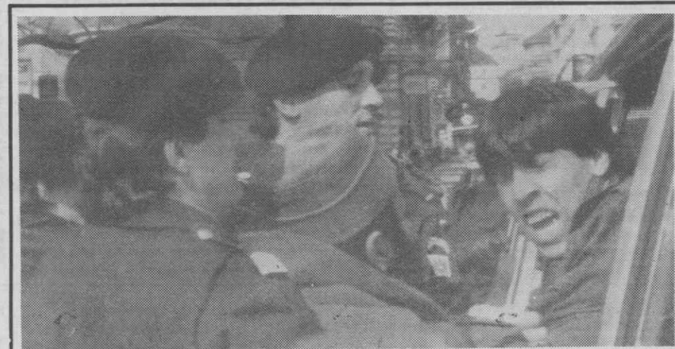
VIENA — Dois polícias austríacos introduzem dois manifestantes curdos numa carrinha da polícia, durante as manifestações curdas contra as armas químicas na guerra Irão-Iraque.