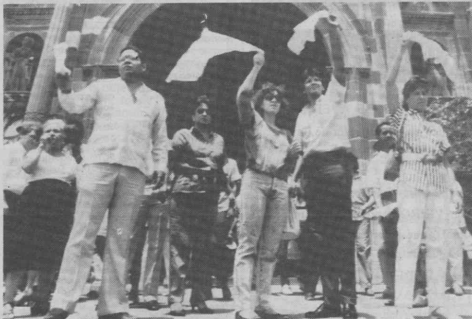
Manifestantes anti-Noriega protestam acenando lenços brancos — um símbolo de oposição ao regime militar do general Manuel António Noriega — durante um comício realizado em frente da Catedral Metropolitana, na Cidade do Panamá.

As mulheres latinas são, segundo Schmidt, as que estão em segundo lugar em termos de longevidade, com uma idade de vida de 79,4 anos.