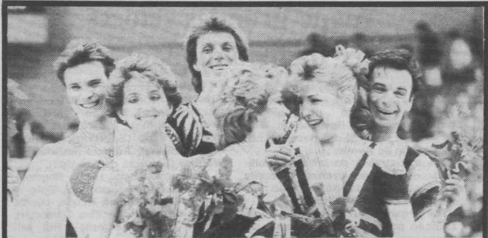
Os campeões mundiais de patinagem no gelo, o par soviético Andrei Bukin e Natalia Bestemianova (ao centro, na foto), festejam a sua vitória com o par soviético medalha de prata (à esquerda) e o par canadiano medalha de bronze (à direita), durante os campeonatos realizados em Budapeste (Hungria).