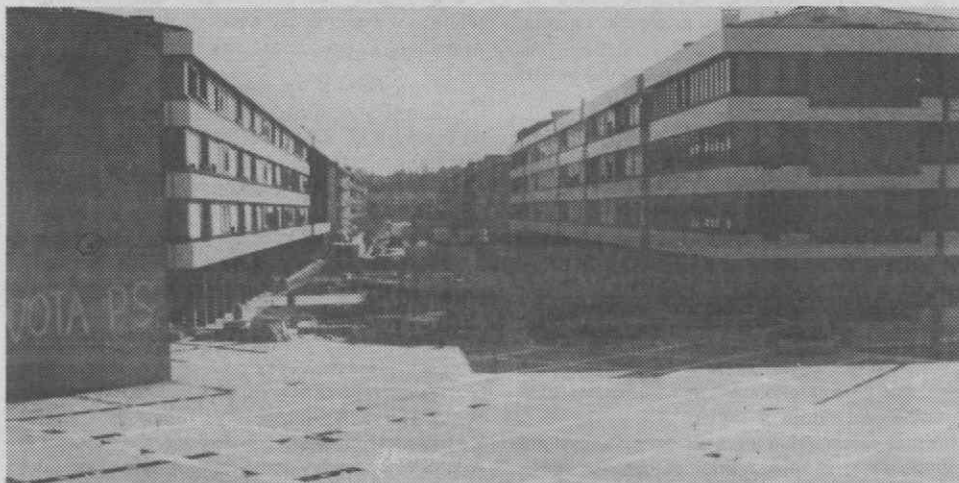
As obras de urbanização da Praça do Município avançam em bom ritmo.

tos da concretização do projecto de urbanização daquele espaço do centro urbano de Águeda ultrapassam os 24 milhares de contos.