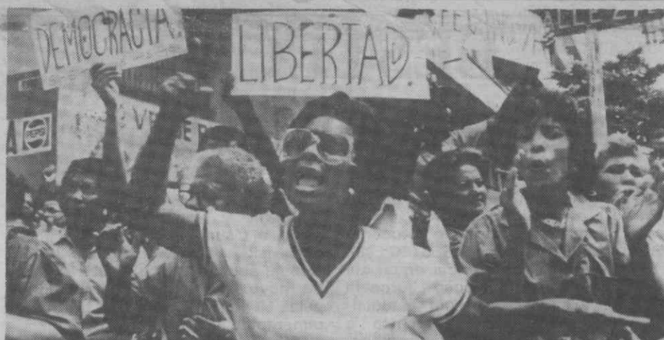
CIDADE DO PANAMÁ — Aspecto de uma manifestação anti-Noriega, organizada pelos professores panamianos, exigindo a reabertura das escolas.