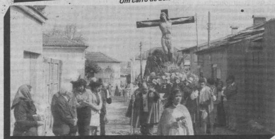
Procissão pelas ruas de Aguada de Cima.