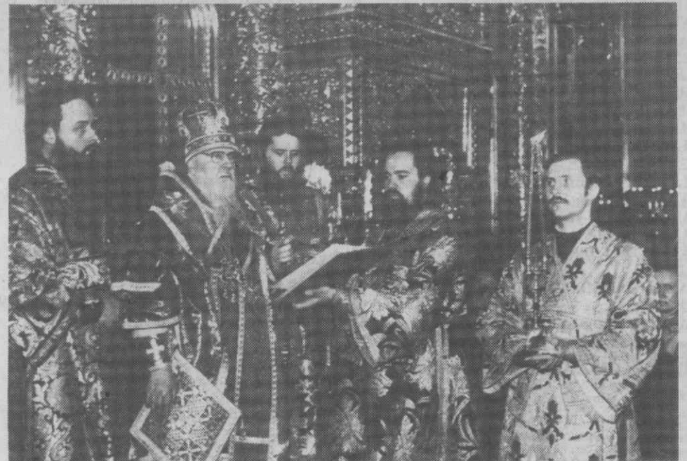
MOSCOVO — Celebrações da Páscoa numa igreja ortodoxa.

Melhor maquilhagem: Rick Baker para «Harry and The Hendersons».