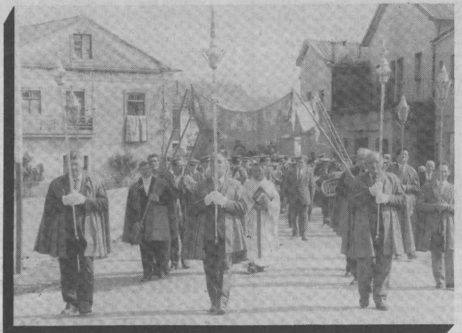
Um outro aspecto da procissão: