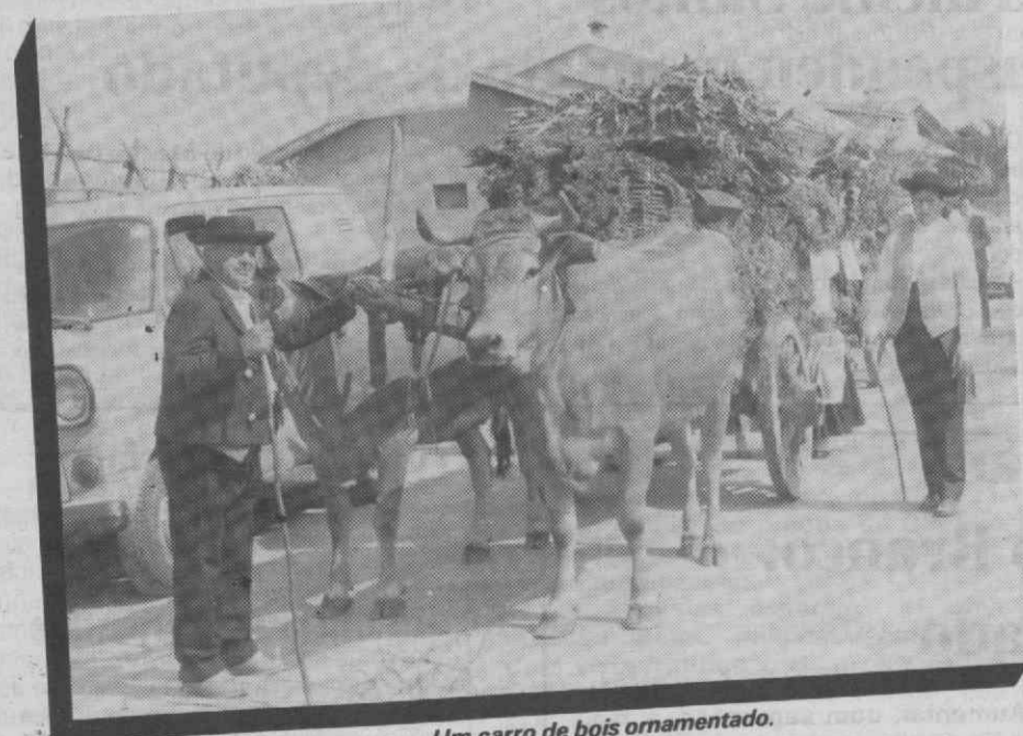
Um carro de bois ornamentado.