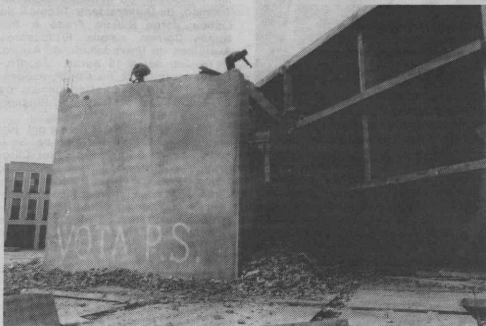
O «paralelepípedo» de betão vai desaparecendo aos poucos.