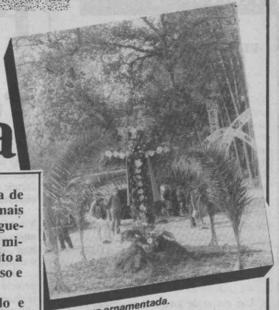
Uma cruz ornamentada.

O último fim-de-semana, sábado e domingo, foi o período grande das festas. O nosso colaborador António Breda captou alguns instantâneos que publicamos a seguir, na intenção de divulgarmos os valores de tradição em que Águeda é terra rica.