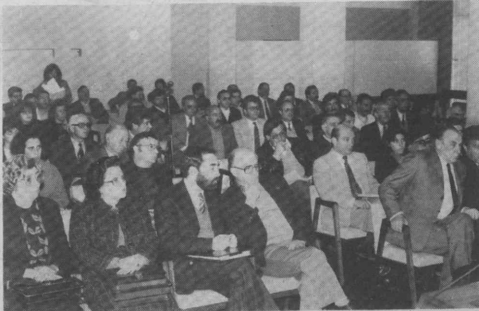
Um aspecto da interessada assistência à sessão promovida pelo Fundo de Turismo.

O SIFIT destina-se a projectos de investimento na construção, ampliação e remodelação de empreendi-