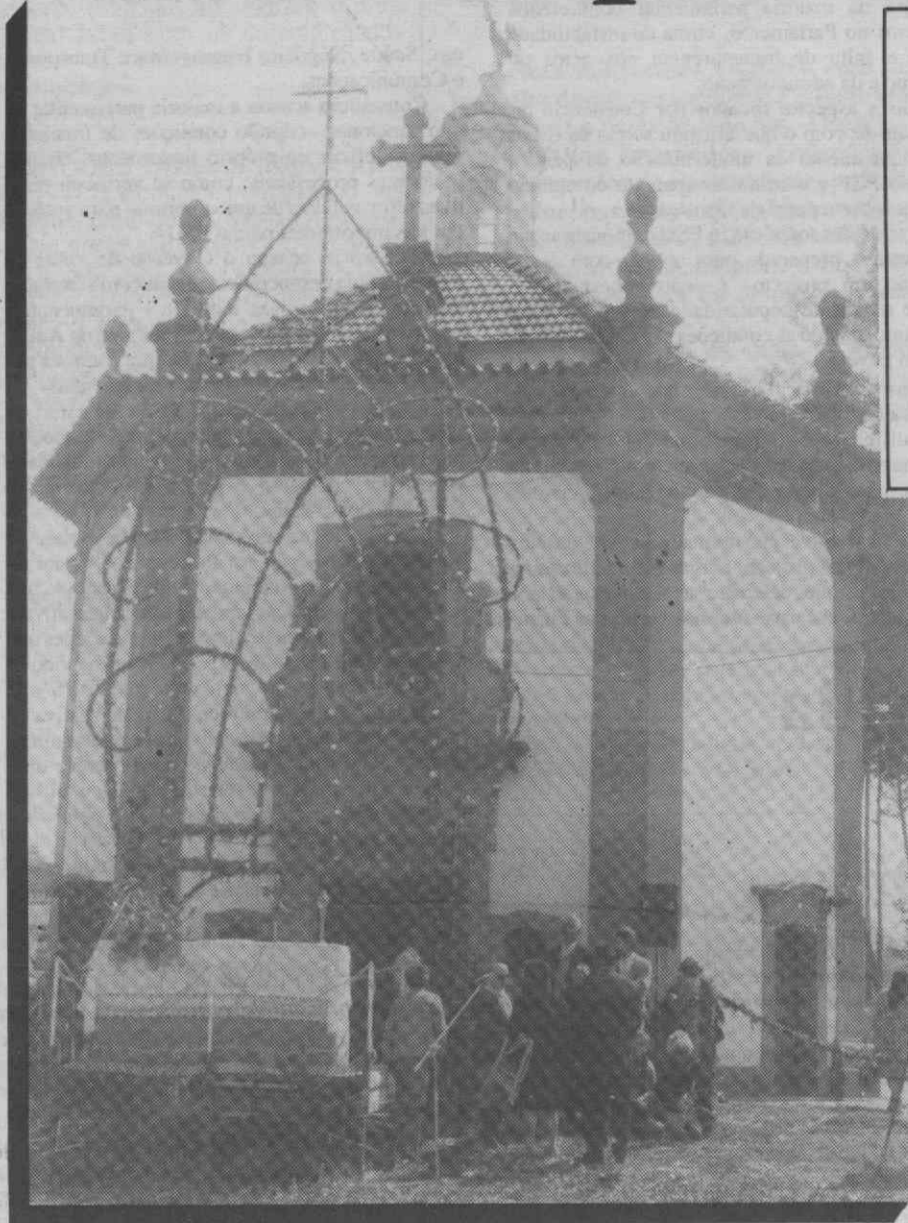
O exterior da capela.