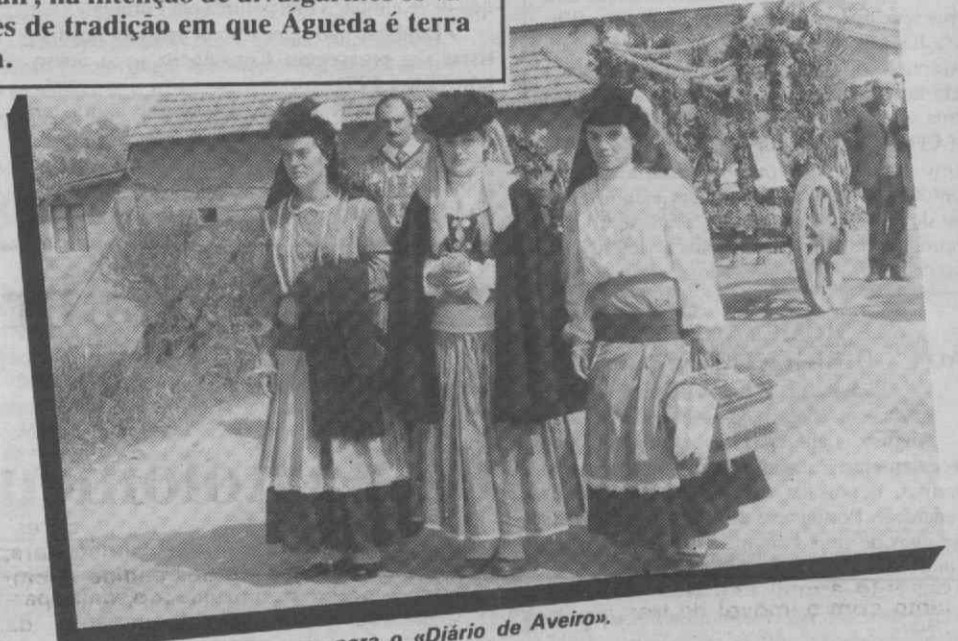
Trajos típicos em pose para o «Diário de Aveiro».