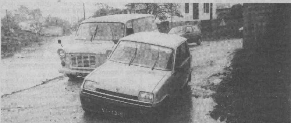
Os dois veículos que ficaram «presos» no enorme buraco.