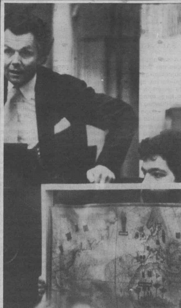
LONDRES — Um dos mapas portulanos portugueses sendo exibido durante o leilão ocorrido numa casa londrina da especialidade.