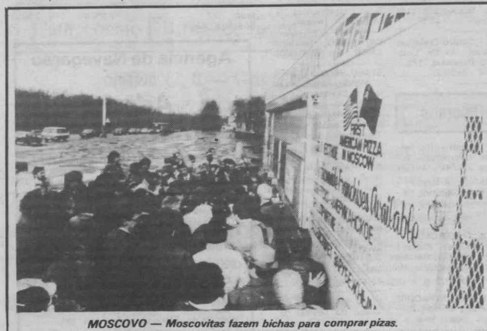
MOSCOVO — Moscovitas fazem bichas para comprar pizzas.

Aquino poderá procurar também a reafirmação de que a China não equipa os rebeldes comunistas filipinos.