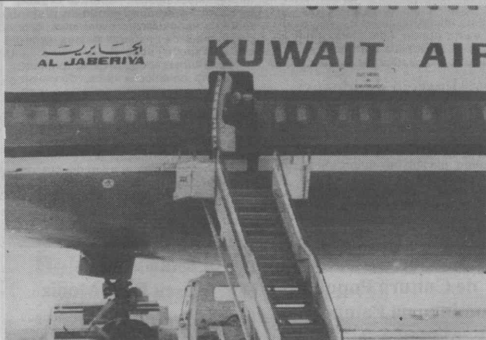
ARGEL — El-Hadi Khediri, ministro do Interior da Argélia, falando com sequestradores do avião das Linhas Aéreas do Kuwait, do cimo de uma escada de acesso ao aparelho.

Apesar deste gesto de boa vontade não parece que os piratas do ar tenham desistido de manter a exigência da libertação de 17 extremistas pró-