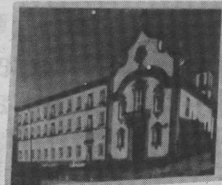
Alguns dos perfis históricos da cidade de Viseu.