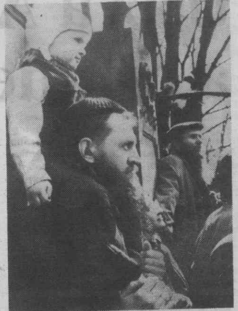
VARSOVIA — Um judeu como seu filho aos ombros, junto ao monumento a dois judeus executados por Staline no cemitério judeu de Varsóvia.