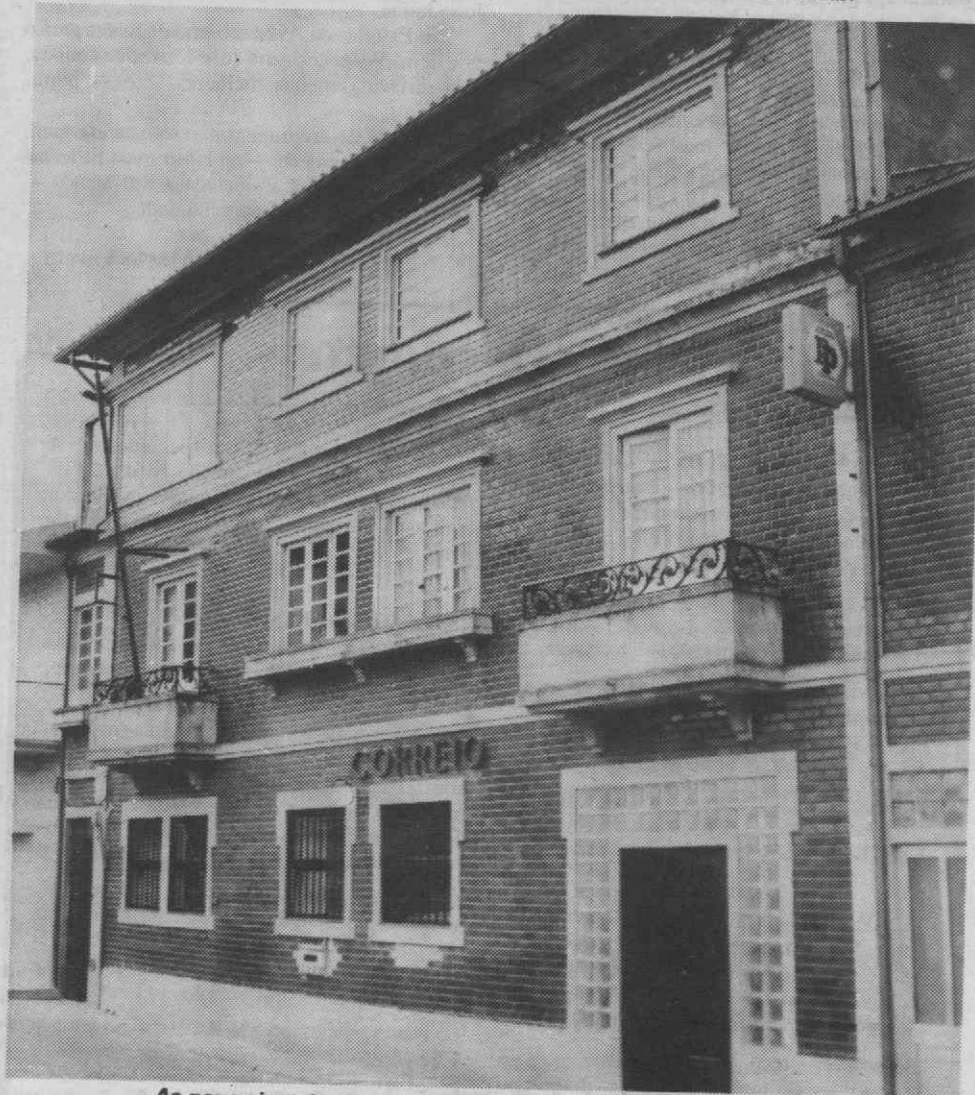
As novas instalações da estação dos correios de Sever do Vouga.

Diria-nos ainda que esta equipa, fundada à cinco anos, esteve sempre sob a sua orientação, e que conta nas suas suas fileiras só com jogadoras «feitas» no clube, nos seus escalões de formação, o que é uma particularidade que deve ser realçada.