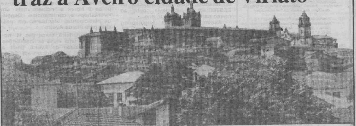
Viseu em Aveiro... sob a forma de fotografia.