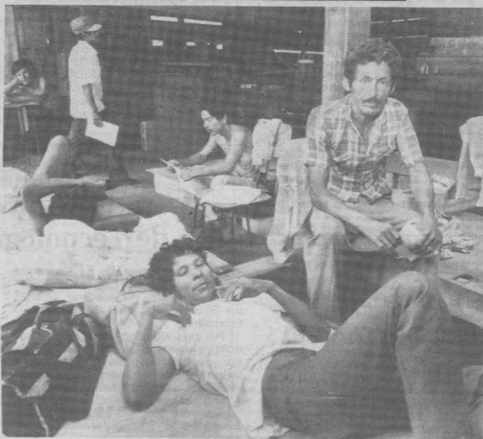
MANÁGUA — Dois trabalhadores da construção civil em plena sede do seu sindicato, onde realizam uma greve de fome, como protesto contra os baixos salários estabelecidos pelo Governo.

O Instituto da Qualidade de Alimentação (IQA) vai, por seu lado, informar a população dos cuidados a ter com toranjias provenientes de Israel, chamando a atenção, nomeadamente para a cor roxa que apresentam os frutos envenenados.