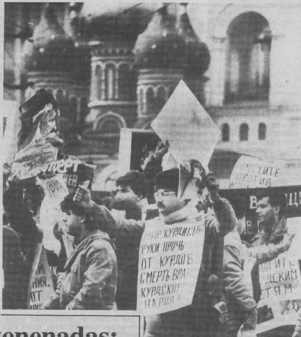
MOSCOVO — Estudantes curdos manifestam-se contra o uso de armas químicas por parte do Iraque contra uma cidade curda.