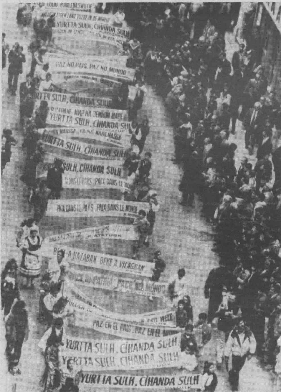
ISTAMBUL — Aspecto de um desfile de crianças de mais de trinta países durante as festividades do Dia da Criança.

Em Setembro passado, outro comboio militar norte-americano que circulava regularmente entre Berlim Oeste e Frankfurt foi alvo de um atentado, que acabou por atingir outro comboio que passou na mesma linha pouco antes.