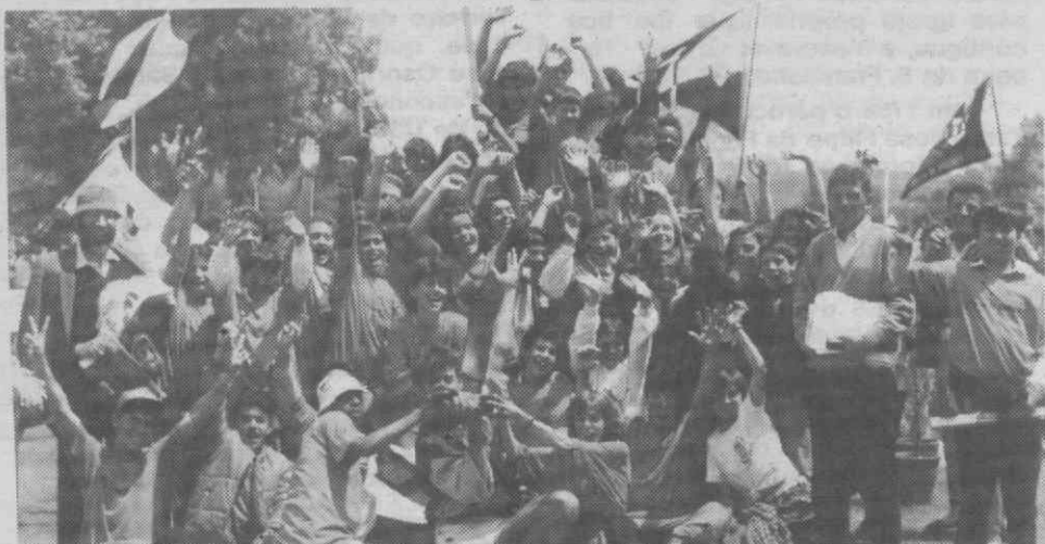
A equipa representante de Aveiro ao DN/Jovem.

A Associação Recreativa e Desportiva de Oliveirinha (ARCO) vai prestar um acto de justiça com o seu Departamento de Atletismo. No próximo domingo, no intervalo do encontro Oliveirinha-Poaires, será prestada homenagem àquele