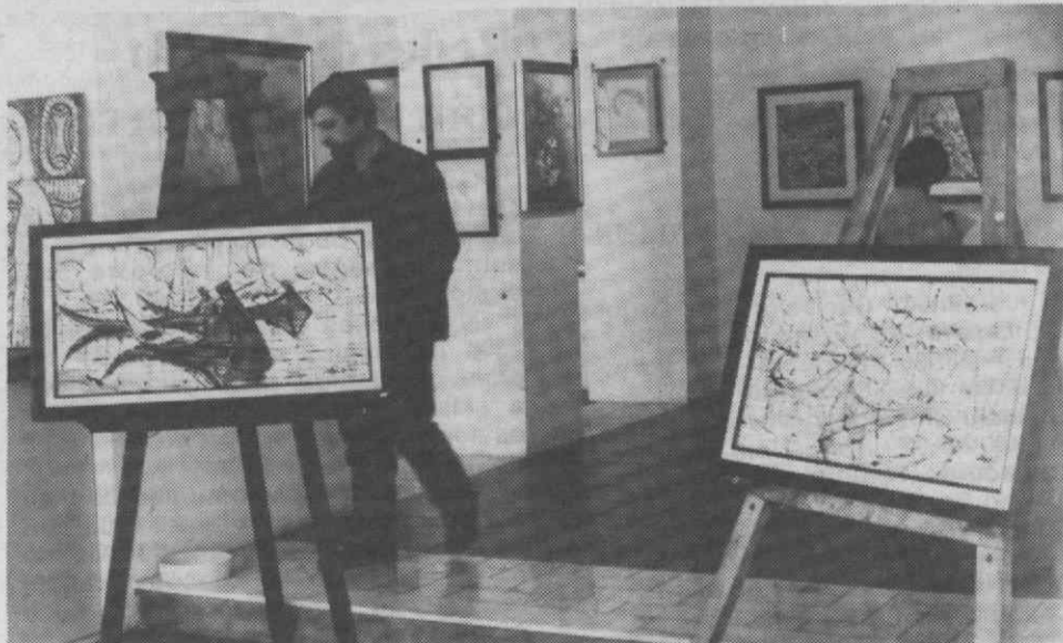
Um aspecto de algumas das obras que integram o I Salão de Artes Plásticas de Aveiro, patente na Galeria Municipal.

Esta exposição-venda, que conta com o apoio do Governo Civil de Aveiro, está patente até ao próximo domingo, entre as 14 e as 19 e as 21 e 23 horas, e constituir um apoio em prol da campanha «Polio-Plus».