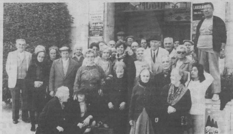
Os idosos participantes no segundo turno da colónia de férias da responsabilidade do Centro de Segurança Social de Aveiro.

Trinta e sete idosos provenientes de lares de terceira idade dos distritos de Viseu e Leiria estão a participar numa colónia de férias na Barra da responsabilidade do Centro Regional de Segurança Social de Aveiro.