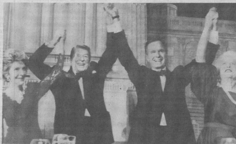
WASHINGTON — Os casais Reagan e Bush, levantam os braços após a declaração de apoio do Presidente dos Estados Unidos ao seu vice-Presidente na eleição para a Casa Branca.

O projecto terá a duração de 40 meses, será executado por uma empresa italiana, e prevê ainda a criação de um centro de produção e distribuição de produtos de pesca em Nampula, ou de um centro de processamento e conservação de produtos destinados à exportação.