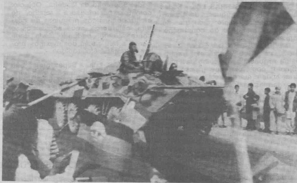
CABUL (Afeganistão) — Blindados soviéticos em manobras.

Um funcionário governamental paquistanês, interrogado sobre a veracidade dessa notícia, disse que não há nenhum paíol rebelde.