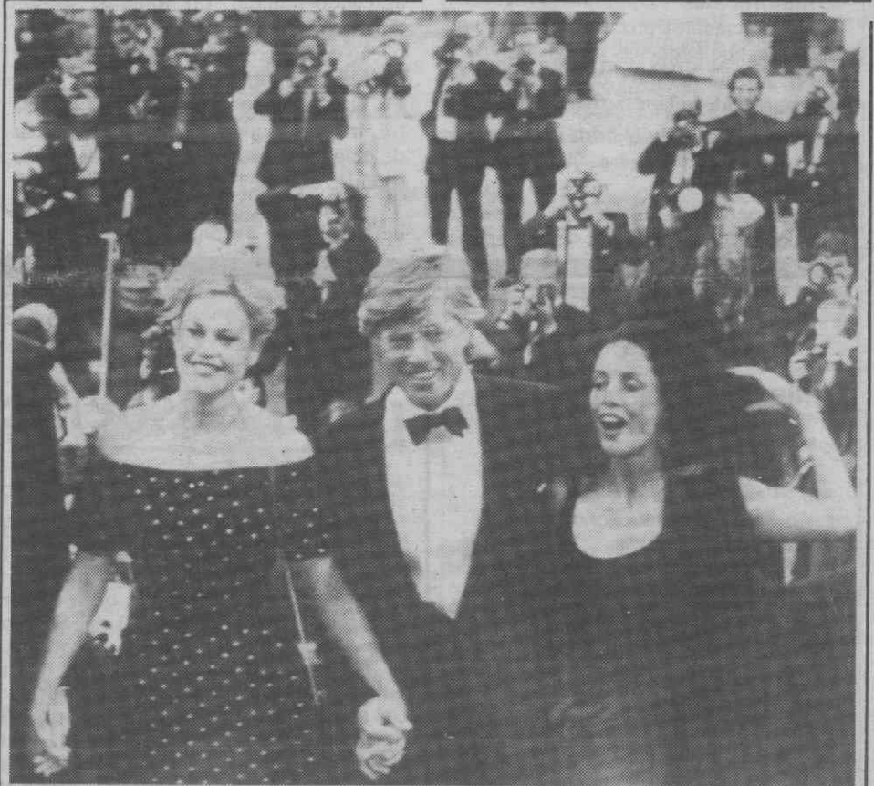
CANNES — O realizador Robert Redford, ladeado pelas actrizes Melanie Griffith e Sónia Braga.