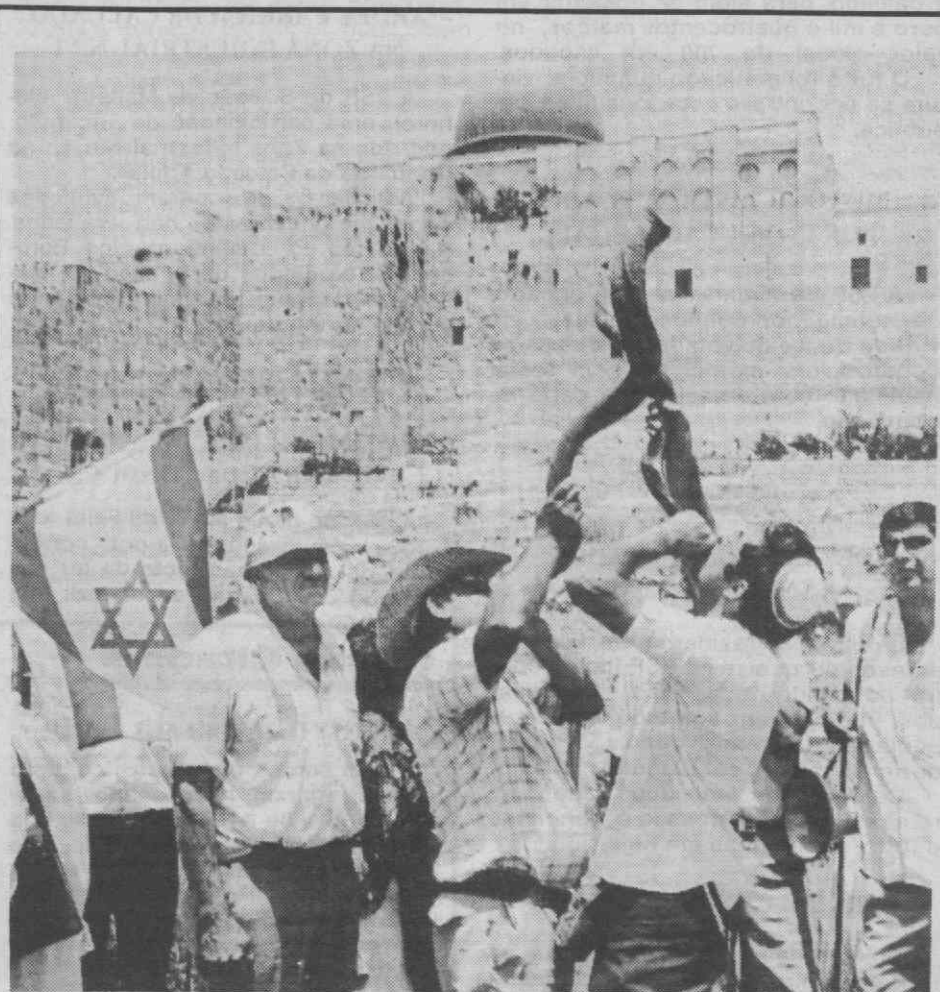
JERUSALÉM — Judeus ultra-nacionalistas participando em cerimónias tradicionais, junto à mesquita de Al-Aqsa, de comemoração do 21.º aniversário de anexação de Jerusalém Oriental.

(«Diário de Aveiro», N.º 878, de 17-5-88).