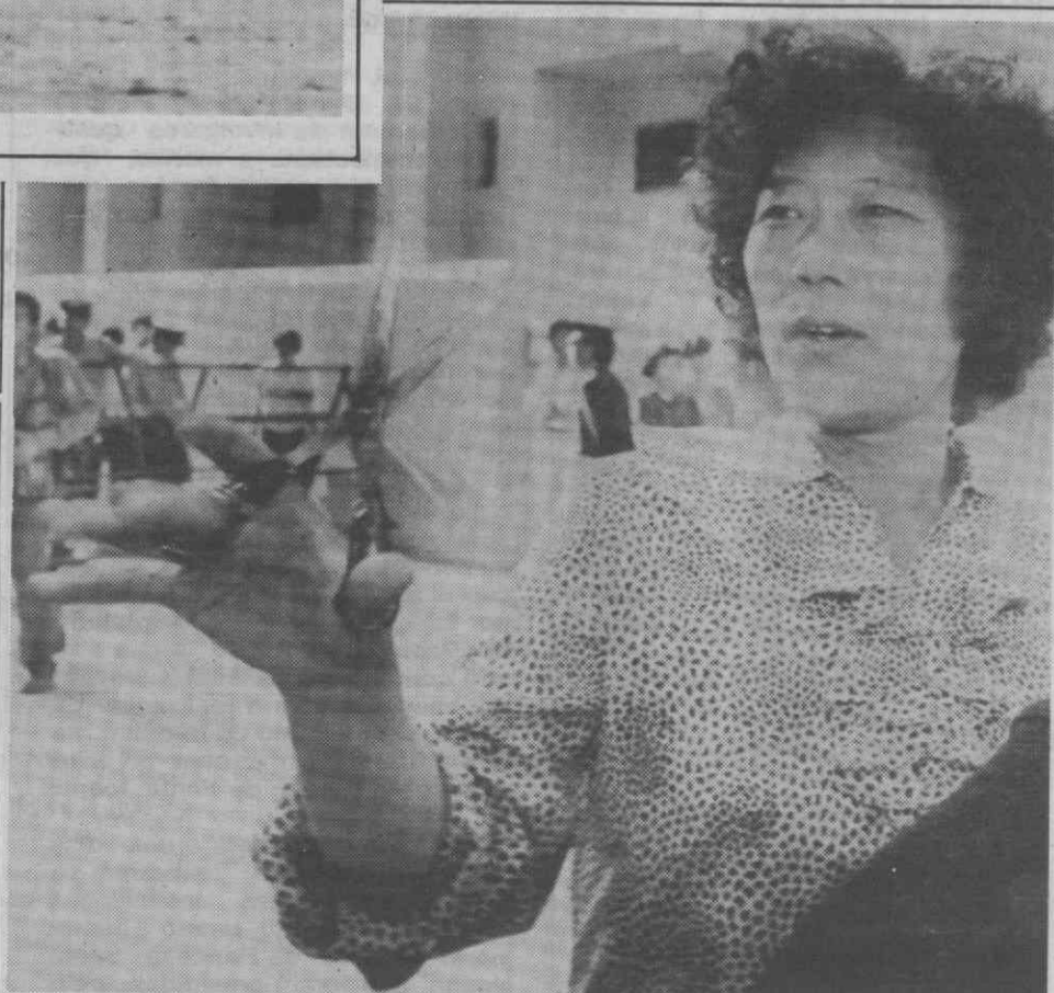
INCHON (Coreia do Sul) — Uma mulher exhibe uma tesoura, junto do tribunal onde decorre o julgamento de um detective policial, acusado de ter torturado sexualmente uma mulher dissidente.