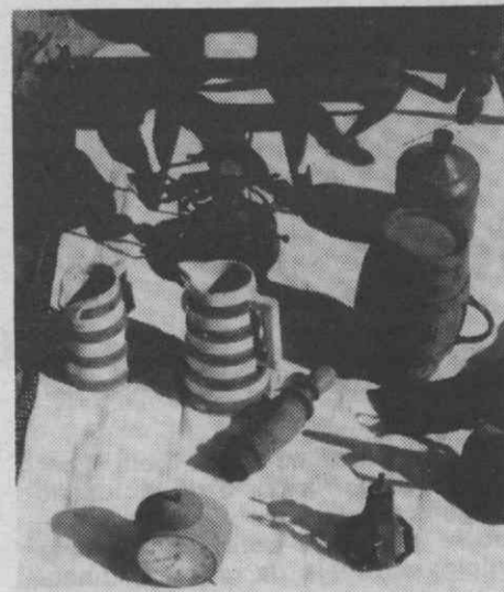
No próximo dia 29, as ruas da Baixa aguedense vão ser animadas por mais uma edição da Xanata.

Assim, no próximo dia 29, a «baixa» aguedense será palco de rara animação, mais um contributo para uma maior «vida» de uma das zonas mais características (e mal aproveitadas) de Águeda.