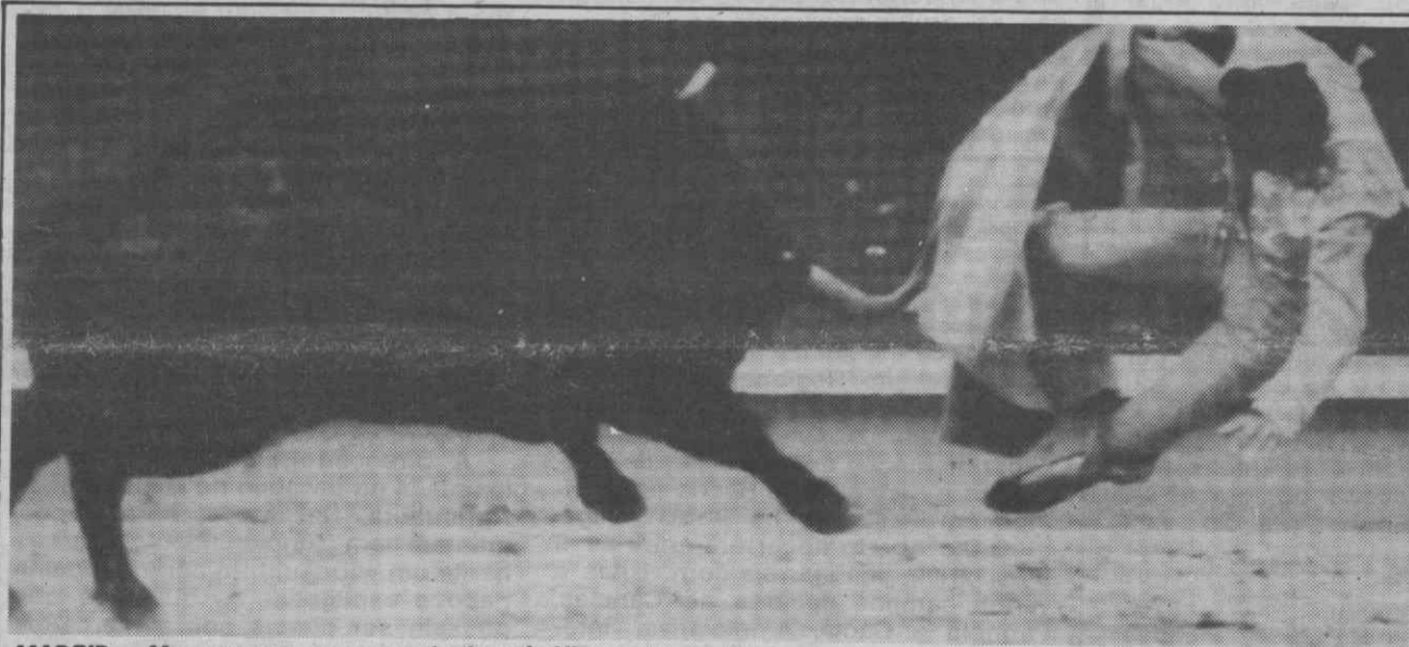
MADRID — Momento em que o matador francês Nimenno II era colhido.