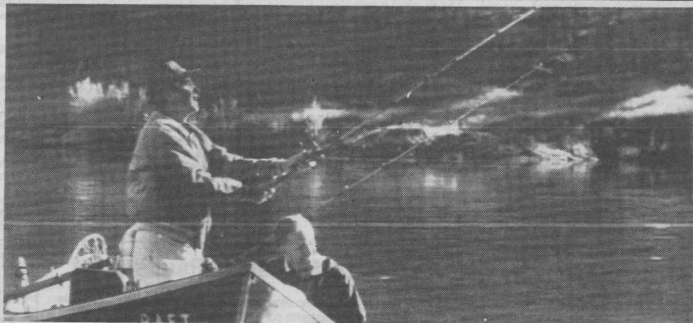
OREGON — O vice-Presidente norte-americano, George Bush tenta apanhar alguns peixes para se descontrair na imprescindível companhia de um agente de segurança.

Através da mesma, a Associação de Atletismo de Aveiro manifesta o seu repúdio pela decisão do congresso, que considera «anti-democrática e lesiva das associações mais representativas e com mais provas dadas». A proposta confere ainda plenos poderes à Direcção da Associação de Atletismo de Aveiro para «defender da melhor maneira os interesses do distrito e dos seus clubes».