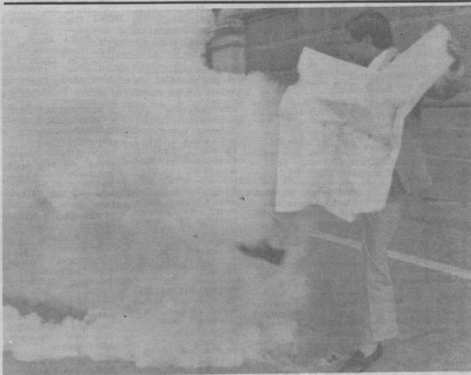
SANTIAGO DO CHILE — Um manifestante dá um pontapé a uma granada de gás lacrimogéneo, durante uma manifestação de jornalistas nas ruas do centro de Santiago.