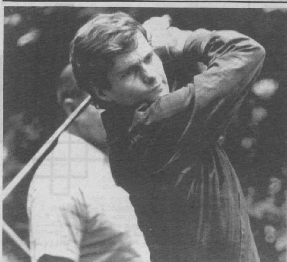
CIDADE DO MÉXICO — O piloto de Fórmula Um Luis Perez Sala, praticando golfe no clube da Cidade do México.