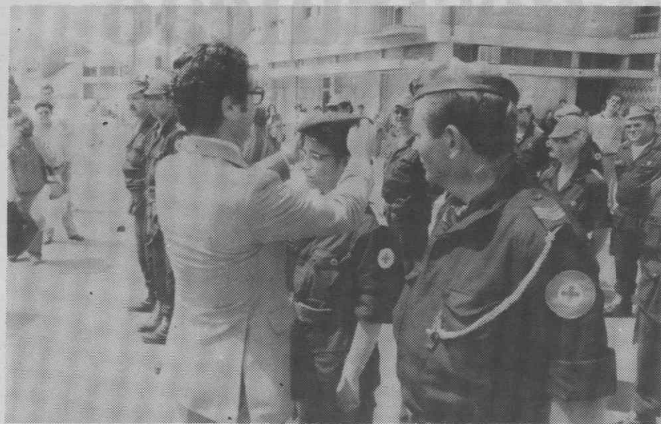
O presidente da Cruz Vermelha ao entregar a boina a um dos elementos da Unidade de Socorros.

Decorreu no passado domingo, no largo Dr. António Breda, a cerimónia do juramento de bandeira dos 16 voluntários que constituem a Unidade de Socorros afecta ao Núcleo de Águeda da Cruz Vermelha.