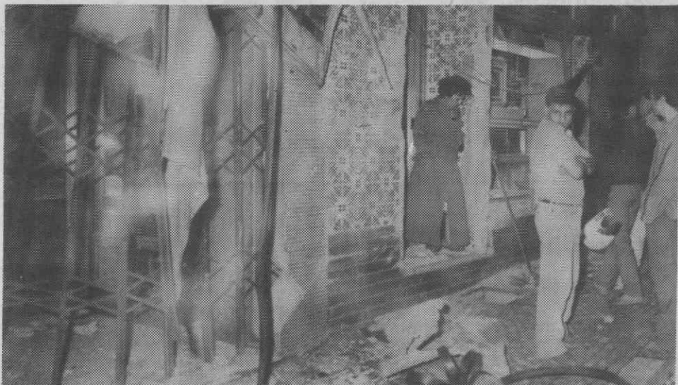
A montra desta ourivesaria ficou completamente destruída.

As duas ocorrências foram registadas pela GNR de Águeda.