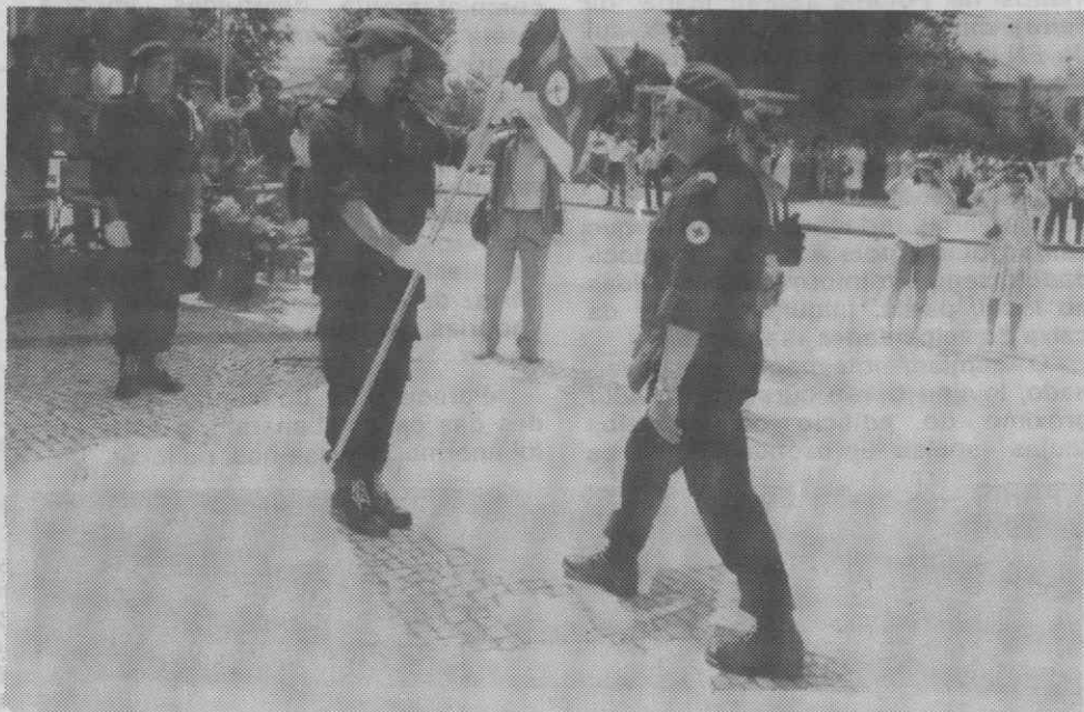
A entrega do guião.

Depois do juramento de bandeira dos 16 voluntários da Unidade de Socorros, seus familiares e amigos impuseram as respectivas insígnias, tendo, de seguida, sido entregue à nova Unidade o guião. As cerimónias terminaram com um desfile das forças em parada.