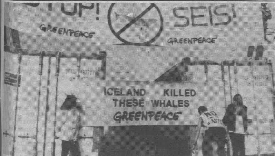
HELSINQUIA — Elementos do movimento ecologista rodeiam contentores carregados com carne de baleia.