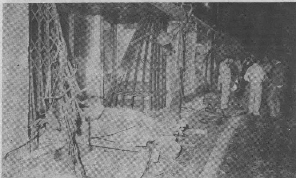
Um rasto de destruição...

«Parecia o fim do mundo. As paredes das casas abanaram, o estrondo foi enorme...», disse-nos, no local, um