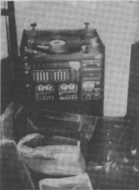
Para além do assalto, vários objectos ficaram danificados, entre eles uma aparelhagem de som.

A GNR de Aveiro deslocou-se ao local estando a Polícia Judiciária de Aveiro a proceder a investigações.