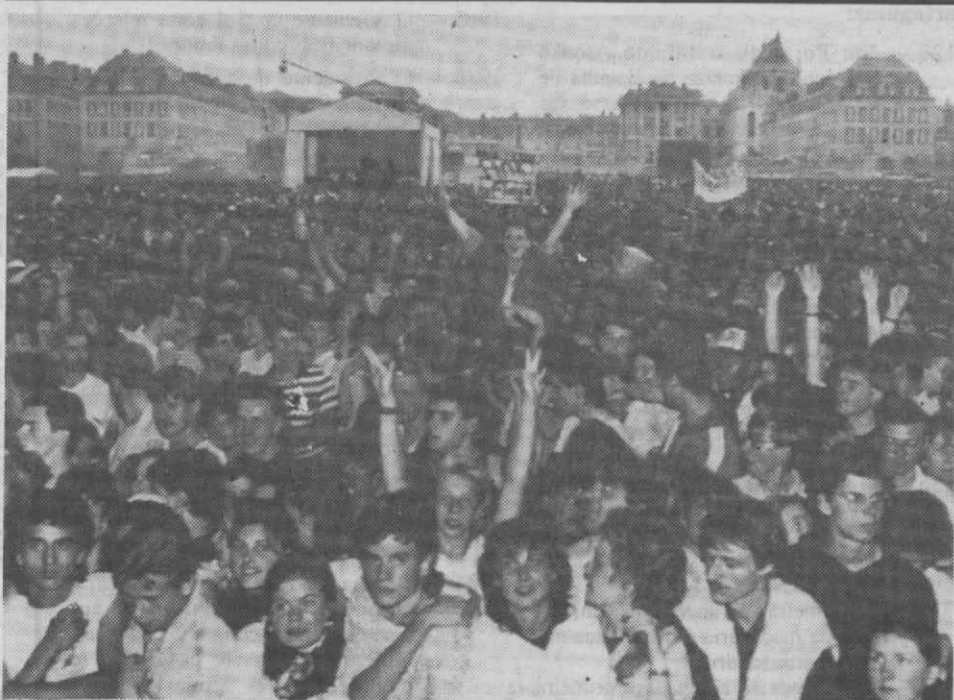
PARIS — Aspecto do concerto do grupo de música Pink Floyd.

As instalações petrolíferas iranianas têm sido alvo frequente de ataques iraquianos, numa tentativa de Bagdad de reduzir as receitas iranianas do petróleo e, consequentemente, os meios para Teerão continuar a guerra que mantém há quase oito anos contra o Iraque.