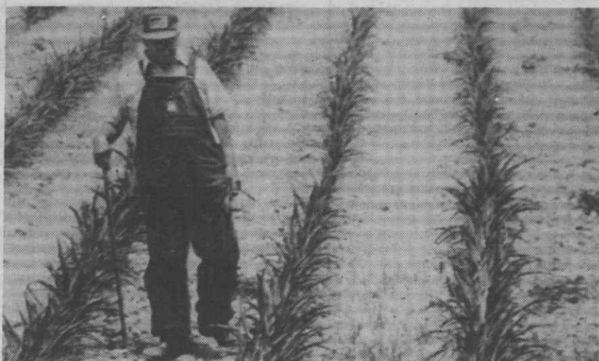
PEEBLES (Ohio) — Um agricultor septuagenário anda através do seu campo cultivado com milho, segundo este a seca que se está a registar nesta região é semelhante à dos anos 30.