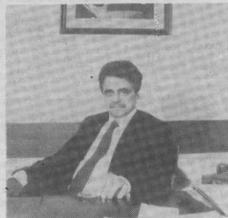
ROMA — O novo secretário-geral do Partido Comunista Italiano, Achille Occhetto sob cuja direcção o maior partido comunista da Europa tentará recuperar dos maus resultados obtidos nas últimas eleições.

Assim a partir de 1 de Julho e até 31 de Agosto vai haver três ligações entre a Covilhã e Lisboa, às segundas, terças e sextas-feiras, e duas para o Porto às quintas e sextas-feiras sempre com a possibilidade de ida e regresso no mesmo dia, de e para Lisboa.