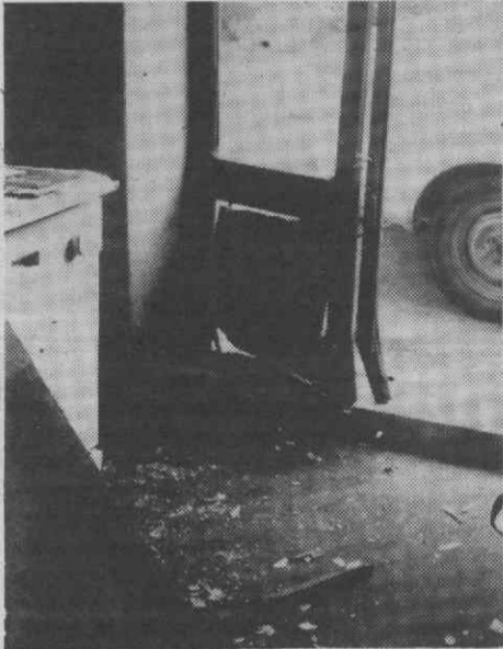
Aspecto do estado em que ficou a porta de entrada depois de os assaltantes terem utilizado um carro suicida para entrarem no interior do estabelecimento.

Quatro televisores de cor com comando à distância no valor total de 305 mil escudos e dois vídeos no valor de 172 contos foram os objectos que os assaltantes conseguiram levar, para além de terem danificado alguns electrodomésticos, nomeadamente duas máquinas de lavar louça,