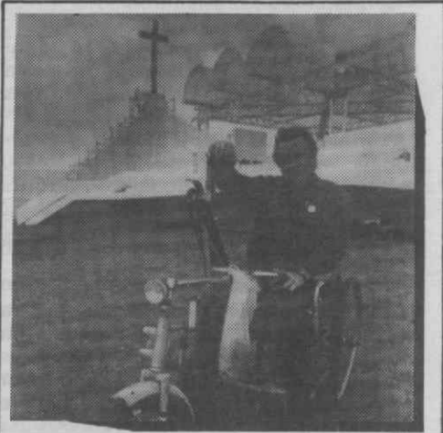
TRAUSDORF (Áustria) — Um deficiente motor da Hungria em frente do altar onde vai assistir à missa do Papa João Paulo II. Este homem demorou quatro dias no seu carro de pedais para viajar da Hungria até à Áustria.