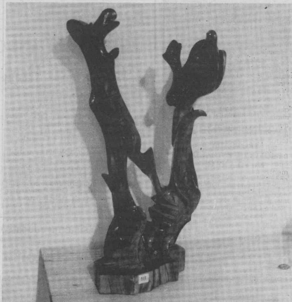
Uma das obras de Emídio Vieira da Silva.

Esta interessante exposição poderá ser visitada, nos dias úteis, das 21 às 22.30 horas, aos sábados, das 17 às 22.30, e, aos domingos, das 15 às 22.30 horas.