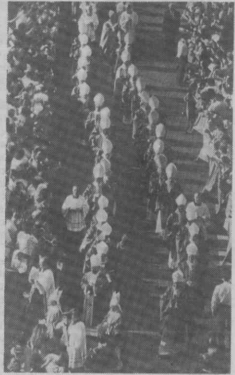
CIDADE DO VATICANO — Vista aérea da procissão pela Praça de S. Pedro de eclésiásticos, entre eles o Papa João Paulo II e os 24 novos cardeais.