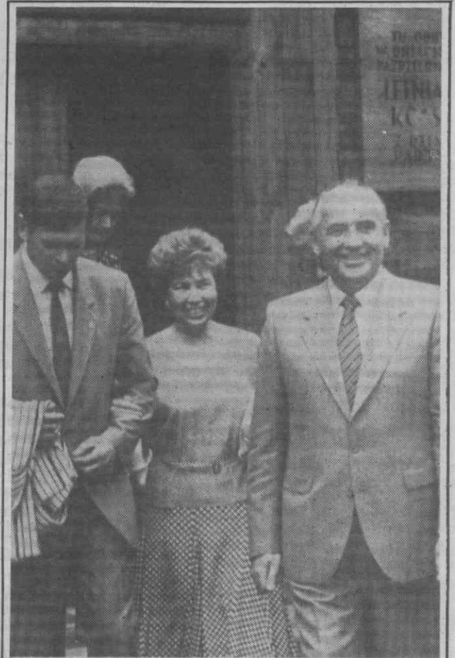
CRACÓVIA — Raisa Gorbachev apoia-se no braço de um funcionário soviético, logo atrás de seu marido, Mikhail Gorbachev, à saída da residência em tempos ocupada por Lenine, após uma visita.

Em determinadas horas do dia o aspecto é o que a foto documenta o que faz pensar à primeira vista num autêntico anfiteatro ou, noutra hipótese, alunos à espera de fazerem o seu exame. Os mais impacientes não deixam de aproveitar, enquanto esperam, para passar uma vista de olhos por processos espalhados pelo chão e desordenados, à espera de serem arquivados. Sem comodidade, a espera é interminável e torna-se insuportável quando falta a luz, ficando a «sala de espera» em completa escuridão, situação que se passa também no interior da secção onde se verifica a falta de funcionários, um entre alguns dos problemas que atingem a Secção de Processos do Ministério Público.