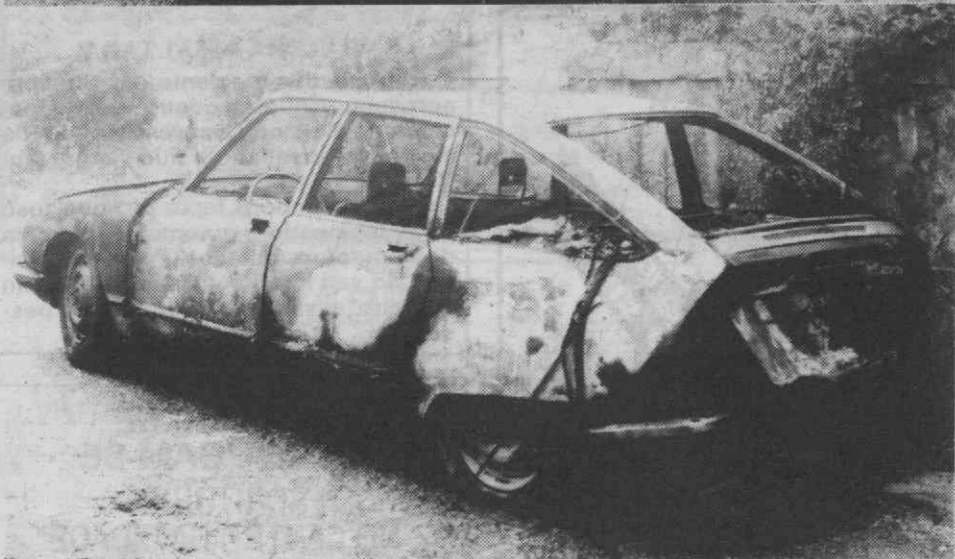
As chamas não perdoaram e a viatura fica praticamente destruída.