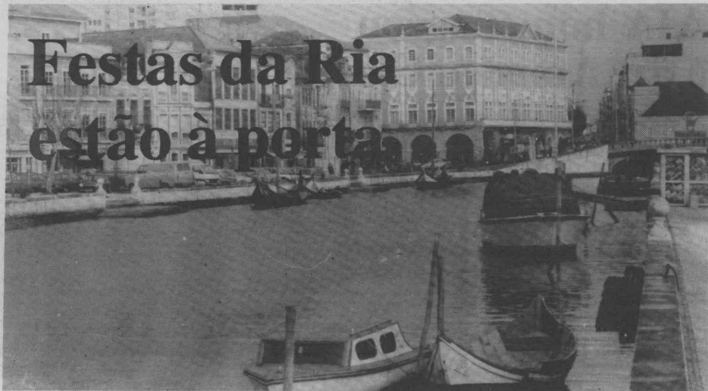
Canal Central — palco das Festas da Ria de Aveiro.

As Festas da Ria começam já no próximo sábado, com uma Regata de Moliceiros, da Torreira a Aveiro, com partida pelas 13 horas e hora provável de chegada a Aveiro às 15 horas, seguindo-se a entrega dos prémios.