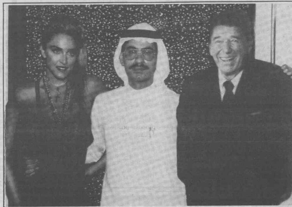
DUBAI (Emiratos Árabes Unidos) — Um cidadão árabe posando com as efígies de duas das suas celebridades favoritas, o Presidente norte-americano Ronald Reagan e a cantora rock Madona.

O Irão dissera anteriormente que o Iraque continuava a ocupar cinco localidades e 4.000 quilómetros quadrados no seu território na frente central de guerra, entre as cidades de Mehran e Qasr-E Shirin.