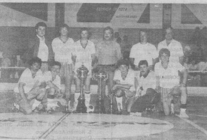
Equipa de Dias e Silva, vencedora do II Torneio do Bom Sucesso.

A equipa do Dias e Silva venceu o II Torneio de Futebol Salão do Bom-Sucesso, ao conseguir uma concludente vitória (5-0) sobre a equipa dos Talhos Rocha. Para além