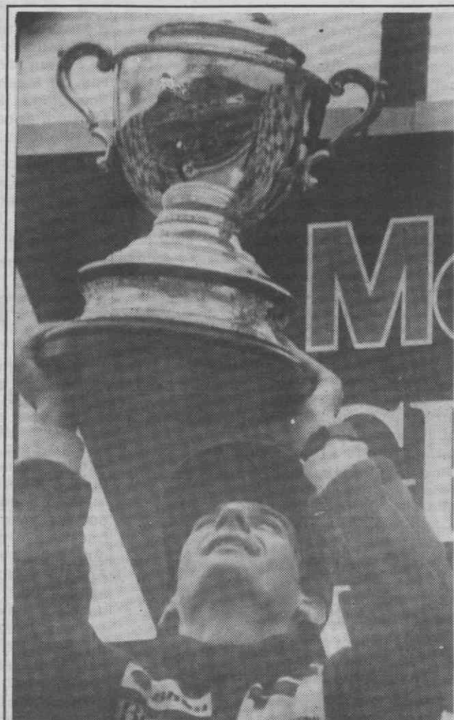
HOCKENHEIM (Alemanha Federal) — Ayrton Senna ergue o troféu depois de ter ganho o Grande Prémio da Alemanha Federal.