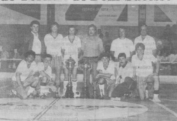
Equipa de Dias e Silva, vencedora do II Torneio do Bom Sucesso.

A equipa do Dias e Silva venceu o Torneio de Futebol Salão do Bom-Sucesso, ao conseguir uma concludente vitória (5-0) sobre a equipa dos Talhos Rocha. Para além