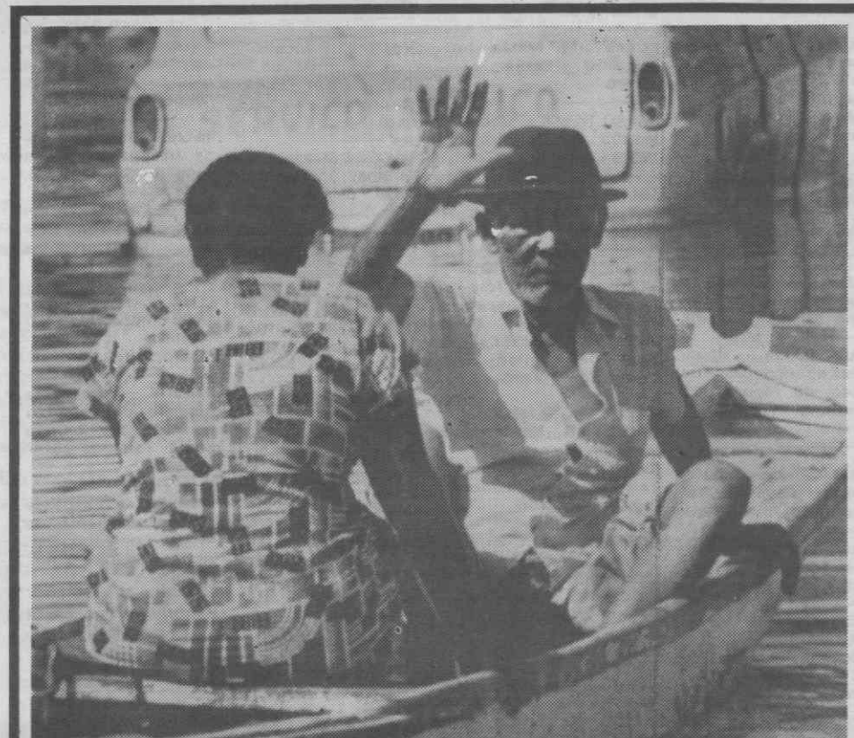
MACEIO, Brasil — Dois habitantes deslocam-se de barco devido às inundações que já causaram dezenas de mortos.

A delegação portuguesa é chefiada pelo ministro dos Negócios Estrangeiros, João de Deus Pinheiro.