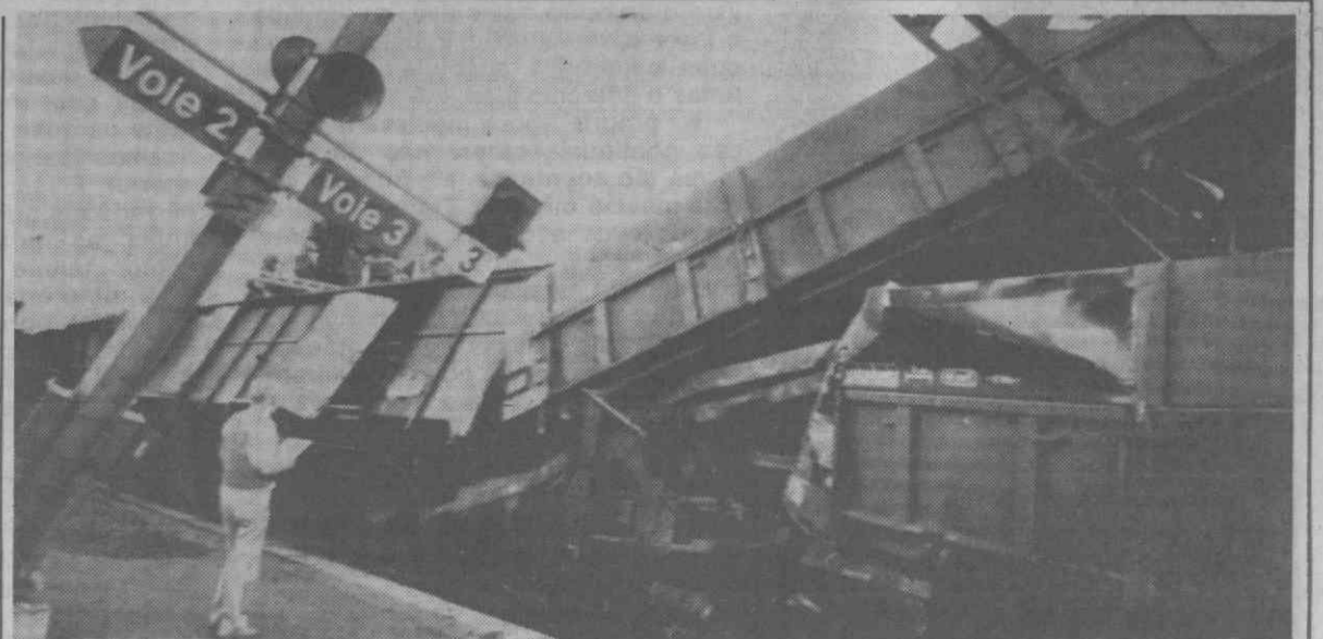
AIGLE, SUÍÇA — Destroços de dois comboios, um de passageiros e outro de transporte de alimentos, após uma colisão na estação ferroviária local, provocando cerca de 15 feridos ligeiros.