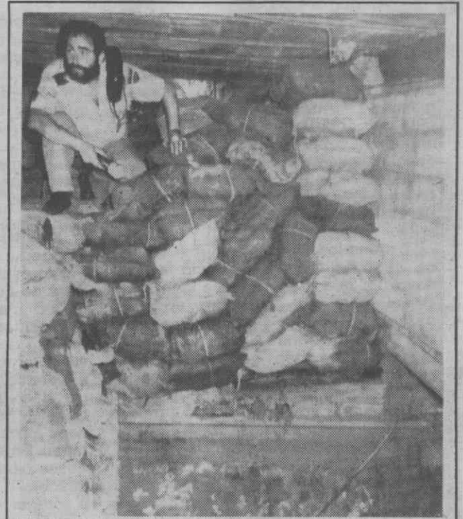
LLORET DE MAR (Espanha) — Polícias removem vários sacos de plástico contendo haxixe, após terem descoberto cerca de 17 toneladas escondidas num sistema de túneis.