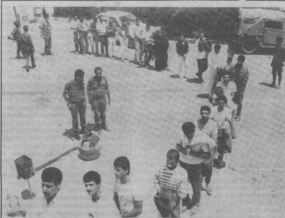
CIDADE DE GAZA — Grupo de prisioneiros palestinos aguardam em fila a libertação, num campo militar. Cerca de 150 palestinos foram ontem libertados, num gesto de boa vontade, devido à celebração de um feriado muçulmano.

A Armada Portuguesa avisou a família do mestre da traineira que toda a tripulação do «Taar» se encontrava bem.