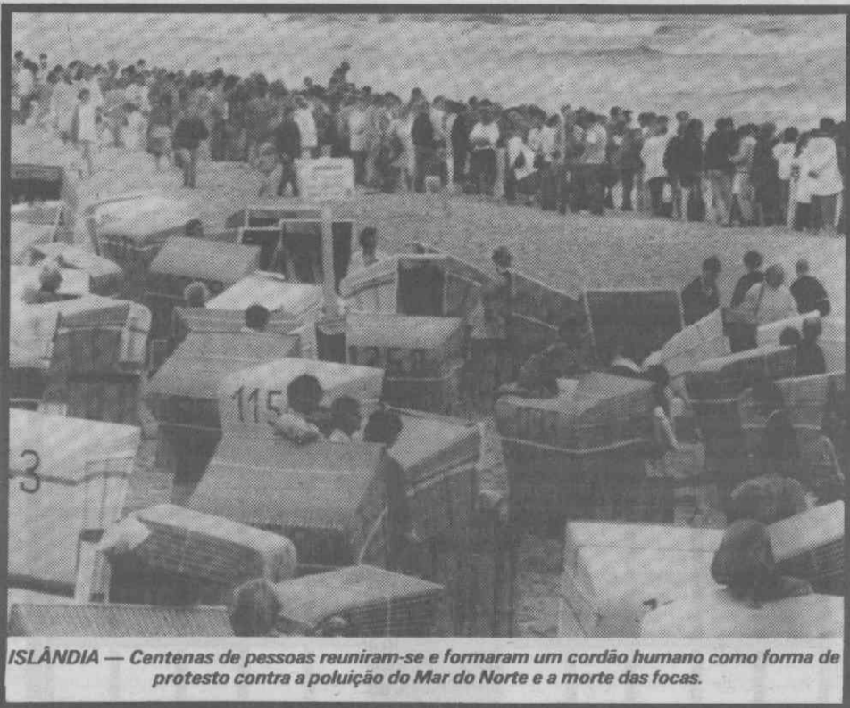
ISLÂNDIA — Centenas de pessoas reuniram-se e formaram um cordão humano como forma de protesto contra a poluição do Mar do Norte e a morte das focas.

As chuvas torrenciais causaram um total de 15 mortos. Os prejuízos materiais, de acordo com os últimos cálculos das autoridades regionais, elevam-se a 40 milhões de contos.