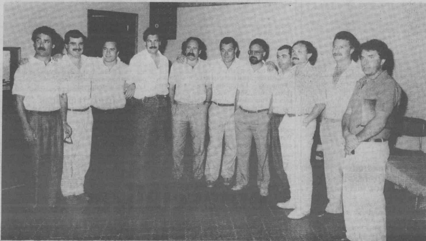
Dignificar o RDA, o objectivo da Direcção do clube.