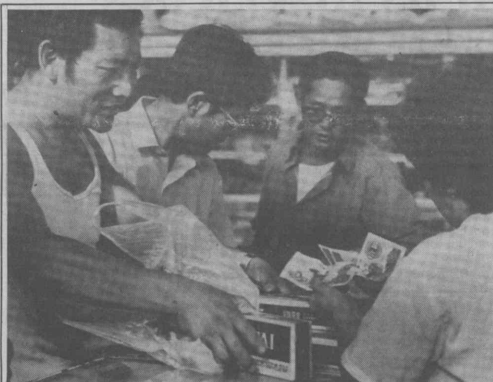
PEQUIM — Fumadores comprando volumes de cigarros um dia após o anúncio pelas autoridades chinesas de aumentar este produto.