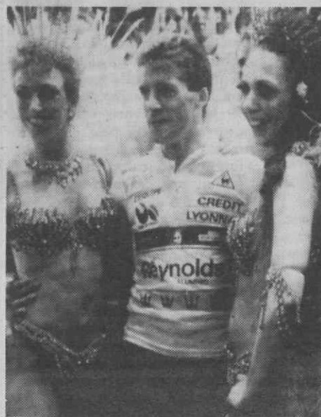
PARIS — Ciclismo — O espanhol Pedro «Perico» Delgado ladeado de duas participantes do programa de variedades do clube nocturno onde o vencedor da Volta à França foi festejar a sua vitória.