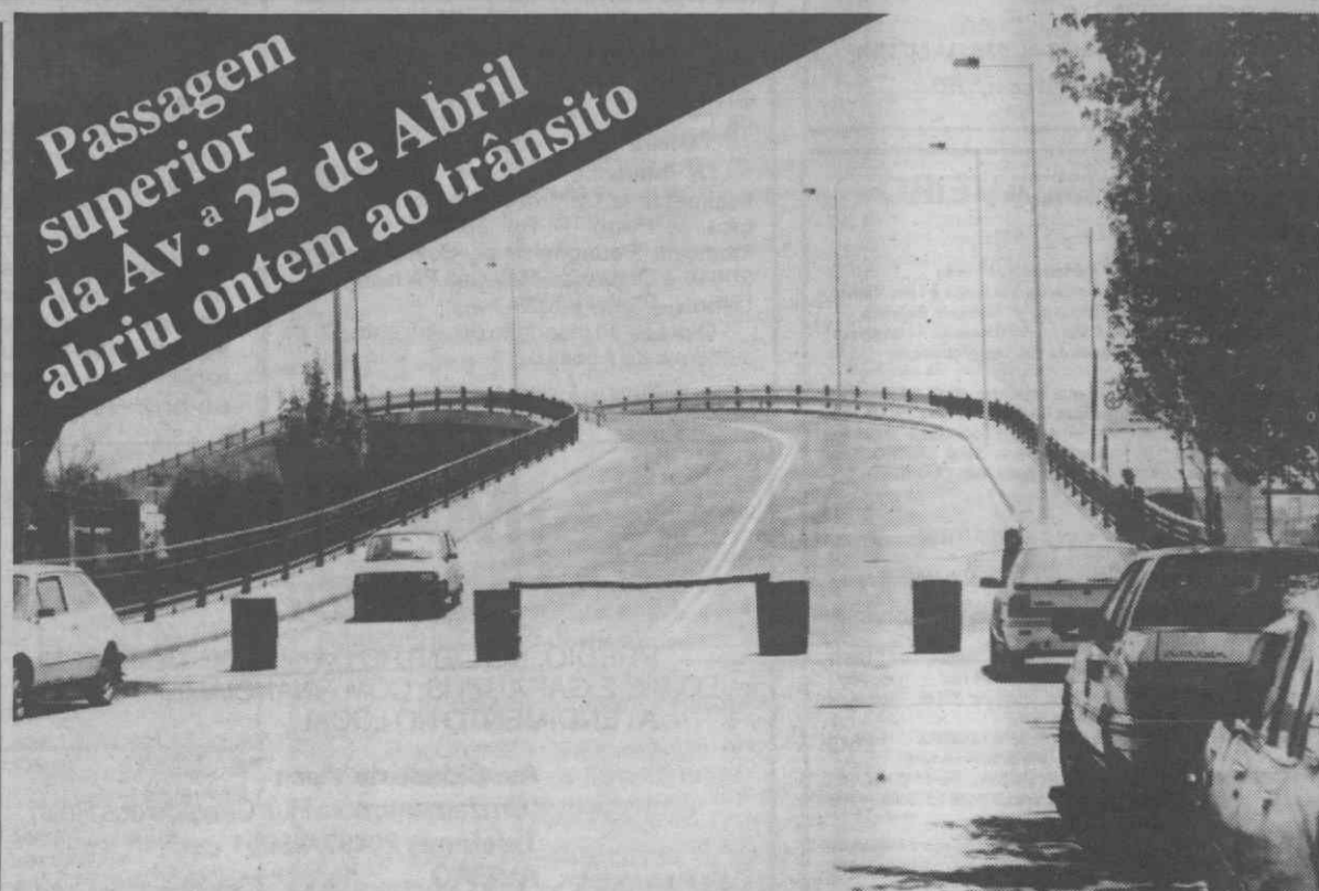
Ligação da Av. 25 de Abril à passagem superior.

No vizinho território de Macau não foram detectados até ao momento indivíduos portadores do vírus da SIDA.