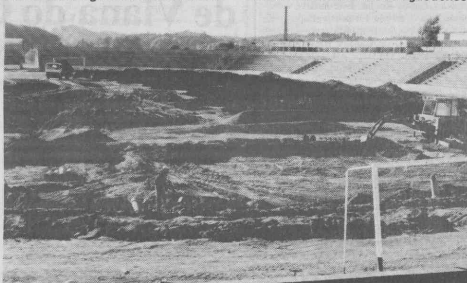
Em Outubro o relvado do Estádio Municipal poderá ser utilizado.

«Tornar Águeda e o RDA cada vez maiores!». A palavra de ordem do elenco directivo do clube aguedense.