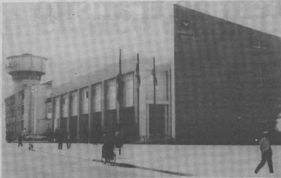
População mostra-se indiferente à pretensão dos Bombeiros Velhos de Aveiro.

Desse elevado número, só trezentas e noventa e nove cartas tiveram aceitação e resposta correspondendo