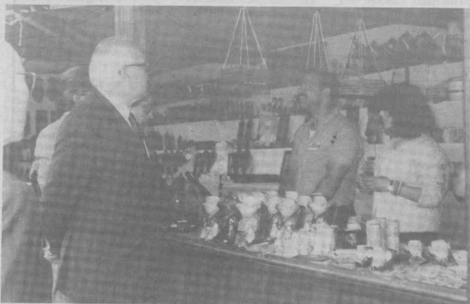
As entidades presentes à inauguração da FARAV/88.

podendo encomendar, por medida os seus tamancos, ou mesmo os bibelots de madeira para a sua casa, se assim o desejar. Mas se preferir um prato de cobre com couro, também tem por onde escolher.