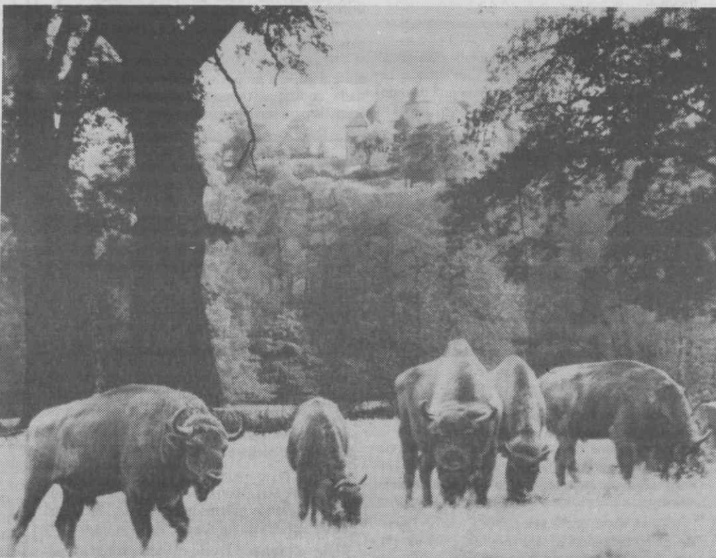
Um rebanho de bisões pastam no Jardim Zoológico de Sababurg, o chamado «Castelo da Bela Adormecida», dos contos dos irmãos Grimm. Aqui vivem também cavalos selvagens e uros (cruzamento genético moderno de reses selvagens extintas na Idade Média).

Também animais raros com galhos, como o ren e o dybovski, são criados nos bosques ao redor de Sababurg. Estes animais e o mullon estão entre as espécies ameaçadas de extinção. A criação visa também a preservação da garça europeia e da cegonha branca, que deverão ser repatriadas na Europa central.