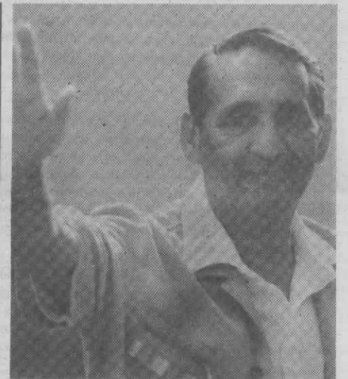
José Napoleon Duarte, Presidente de El Salvador, acena para os repórteres à sua chegada ao Centro Médico da Armada, em Washington, para mais uma sessão de quimioterapia. Napoleon Duarte tem um cancro, suspeita-se que já em fase terminal.