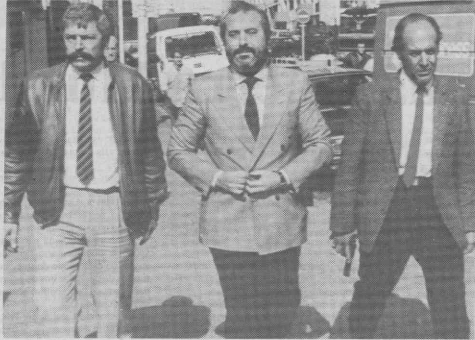
PARIS — Foto de arquivo do juiz Giovanni Falcone sendo escoltado por agentes anti-Mafia, à chegada ao tribunal.

pudesse acontecer, infelizmente aconteceu», escreveu Falcone. «As investigações sobre a Mafia foram destruídas e (a Comissão Antimafia)... está agora num impasse».