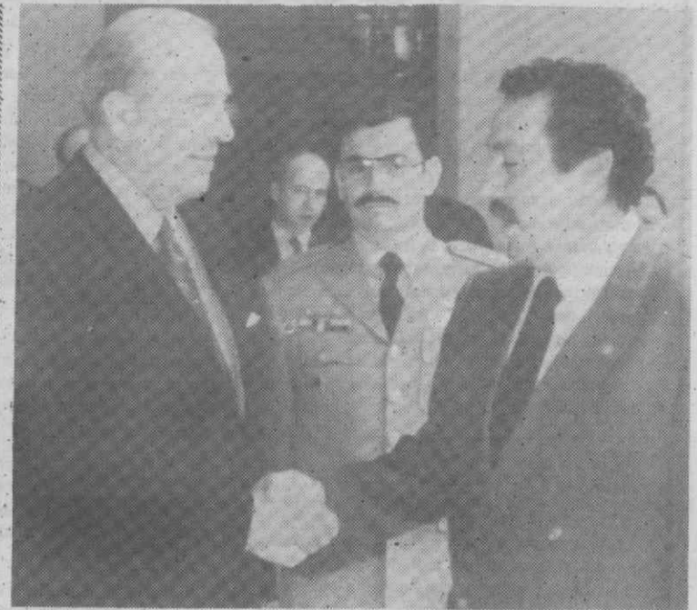
O secretário de Estado norte-americano George Shultz cumprimenta o Presidente da Guatemala, Vinicio Cerezo, após mais uma etapa da sua ronda para avaliar o processo de paz na América Central.