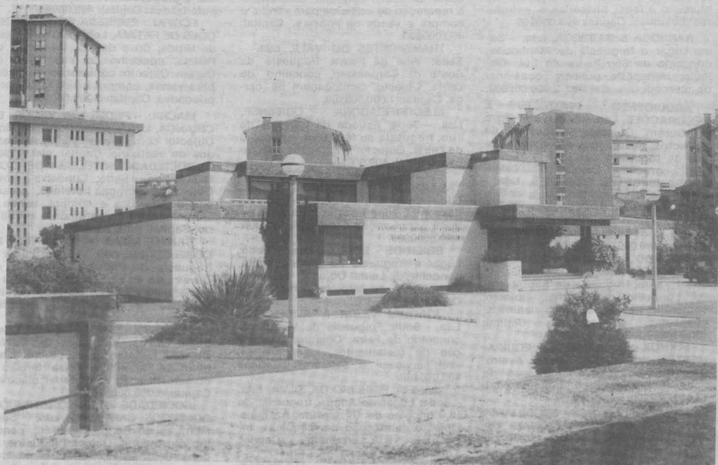
Um espaço alargado de cultura...