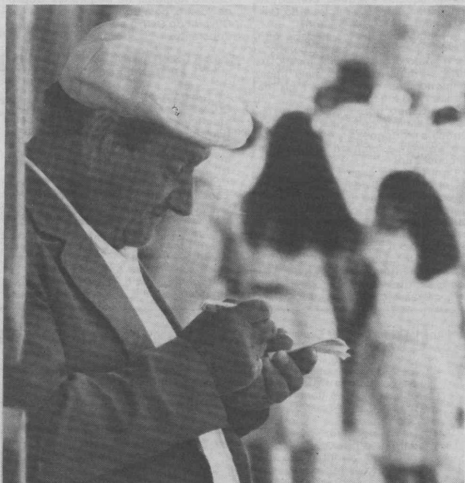
Esta vida não está nada fácil! Que o diga o «plastificador de documentos» (uma profissão ainda não incluída nas listas profissionais) que, depois de um dia de trabalho faz as suas contas à vida, indiferente aos passantes, que tratam também da sua vida.