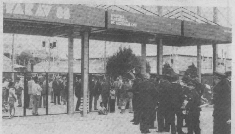
Foi em ambiente de festa, a que não faltou banda de música, que a FARAV/88 teve a sua inauguração oficial.