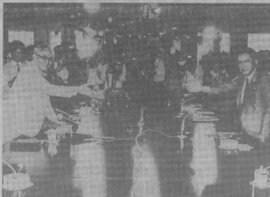
PANNUNJOM (Coreia) — Os chefes das delegações dos Parlamentos norte-coreano e sul-coreano cumprimentam-se no início do encontro entre as suas delegações.