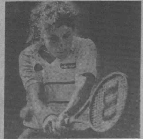
Chris Evert Lloyd

O tenista equatoriano tinha discutido várias decisões do árbitro e tinha recebido um jogo de penalização quando bateu com a raquete no microfone do árbitro e virou uma mesa colocada junto à vedação. Pouco depois, Gomez atirou com a raquete para o chão e o árbitro deu o encontro por terminado.