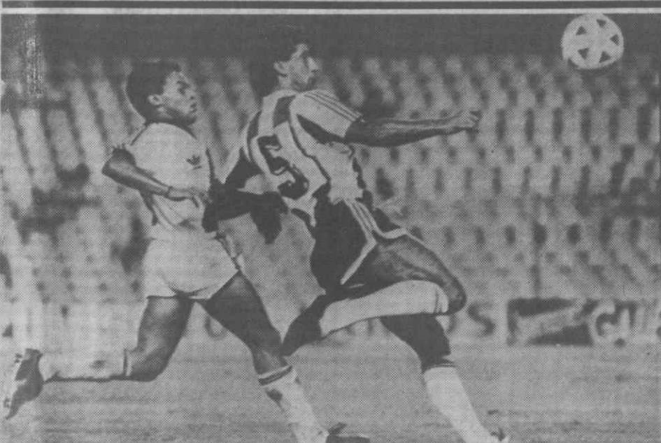
VALÊNCIA — Um belo lance de futebol, captado no jogo Porto-Vasco da Gama, em que os portistas, ao cederem um empate a zero, «deram» aos valencianos a hipótese de ganhar o troféu em disputa, no Torneio Quadrangular que se realizou naquela cidade espanhola.