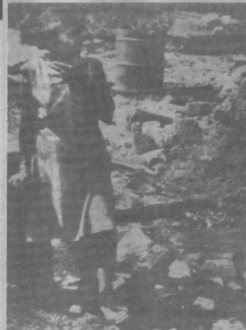
MONTERRY, Nicarágua — Uma mulher idosa olha para os destroços da sua habitação, após um ataque dos rebeldes «contras» a esta localidade.