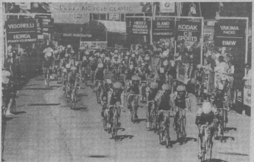
COPPER MOUNTAIN (Colorado) — Vista geral da partida das ciclistas da etapa Cooper Mountain, a contar para a prova feminina do Coors Classic.

O colombiano Pablo Wilches venceu quinta-feira a décima primeira etapa da «Coors Classic» em bicicleta, disputada na distância de 107 quilómetros, no Estado do Colorado.