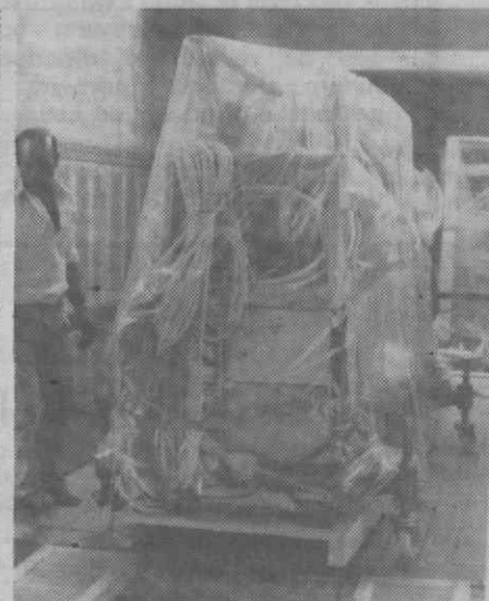
O «aparelho-coração» de todo o equipamento de radiodiagnóstico, aquando da sua descarga.

— Descarga do equipamento provocou paralisação do trânsito