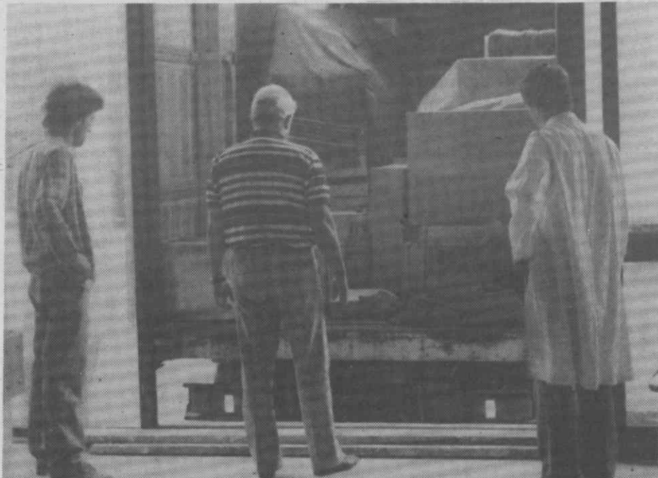
Um aspecto do equipamento antes do início das operações de descarga.

— Descarga do equipamento paralisou o trânsito