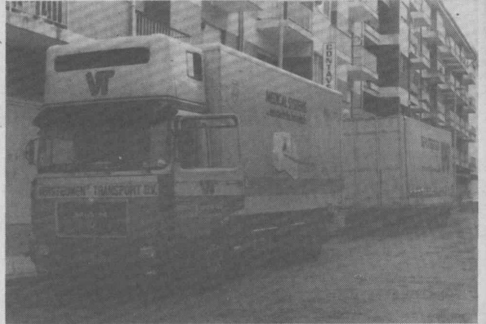
O «trailer» que efectuou o transporte da Holanda para Aveiro dos cerca de cem mil contos de equipamento.