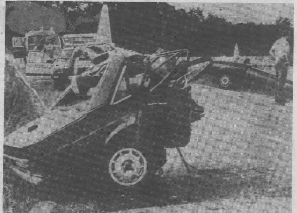
DOLLBERGEN (RFA) — Um automóvel cortado ao meio após se ter despistado e embateu contra uma árvore, quando circulava em alta velocidade numa auto-estrada na região de Hannover.