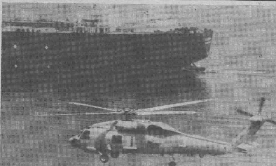
GOLFO PÉRSICO — Um helicóptero da Marinha dos EUA escolta um petroleiro norte-americano «Middletown», durante o segundo dia do cessar-fogo na guerra Irão-Iraque.

Cerca de um milhão e meio de crianças morre anualmente na Índia, antes de atingir os cinco anos, quer por más condições sanitárias, quer por beberem água não potável, informou ontem o Governo indiano. Saraj Khaparde, ministro do Estado para a Saúde e para os Assuntos Sociais, informou o Parlamento Indiano (Lok Sabha) que a desintéria é a principal causa das doenças e da morte entre as crianças mais jovens.