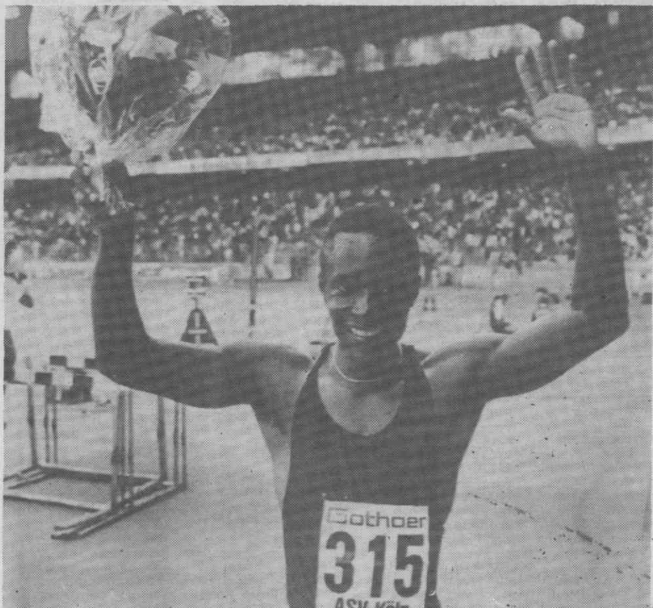
COLÓNIA (RFA) — Calvin Smith, dos EUA ergue os braços em sinal de vitória depois de ter ganho os 100 m em 10,16 segundos.

Johnson, recordista mundial desde 1987, não conseguiu melhor que um terceiro lugar na prova disputada domingo em Colónia, na Alemanha Federal, sofrendo a segunda derrota consecutiva, depois de em Zurique ter sido derrotado pelo norte-americano Carl Lewis.