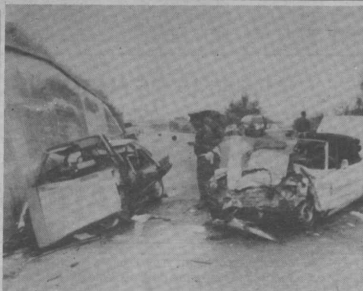
PERUGIA (Itália) — Aspecto de acidente de viação, vendo-se dois dos veículos, que provocou a morte a sete pessoas.

A situação nos povoados dos Dinkas é de tal forma horrível, devido à escassez de alimentos e às matanças frequentes, que as mulheres e as crianças abandonadas pelos homens se vêem obrigadas a deixar as suas habitações e a fugir para o norte, conclui Walsh.