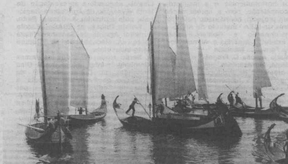
Barcos moliceiros: o ex-libris da Ria que será mostrado a um grupo de jornalistas estrangeiros de visita a esta região durante as regatas que decorrerão no próximo dia 4 de Setembro.

com uma alvorada de tiros de morteiro, actuando à tarde e à noite alguns conjuntos típicos. No dia seguinte, para além das referidas regatas,