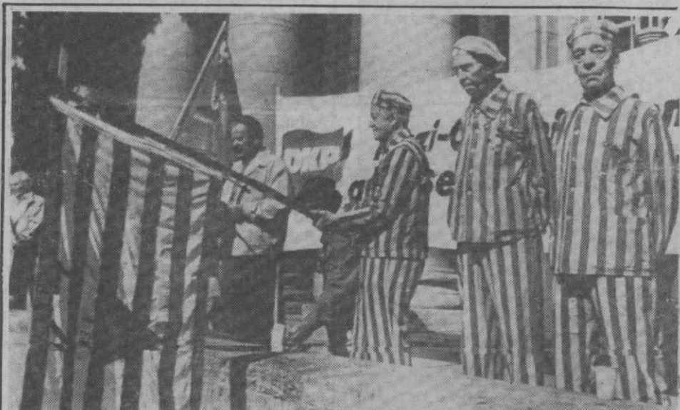
DUSSELDORF — Sobreviventes não identificados dos campos de concentração nazis, envergando indumentária usada nos campos na II Guerra Mundial, junto ao tribunal onde um ex-elemento dos SS se encontra a ser julgado.