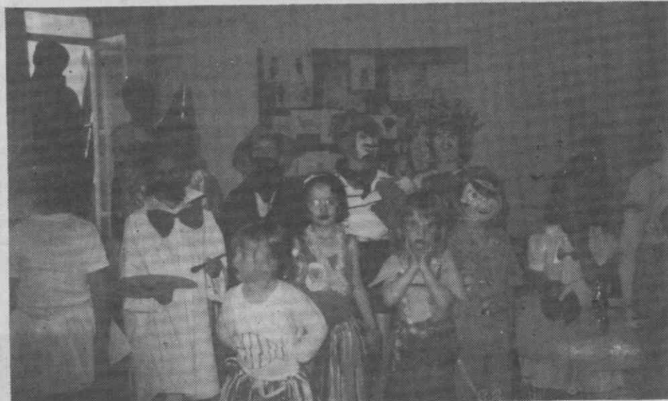
As crianças e a animação turística em Monte Gordo.