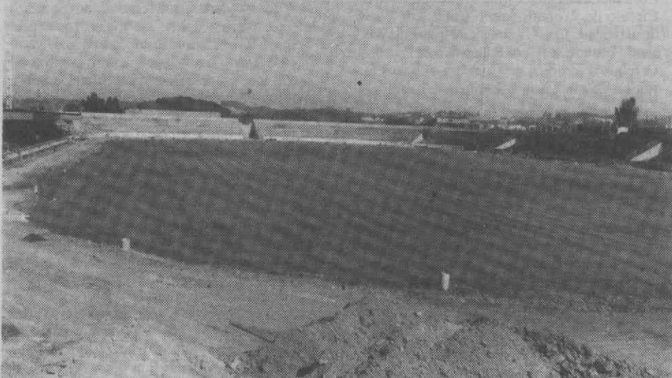
Um bonito tapete verde cobre já o Estádio Municipal de Águeda.