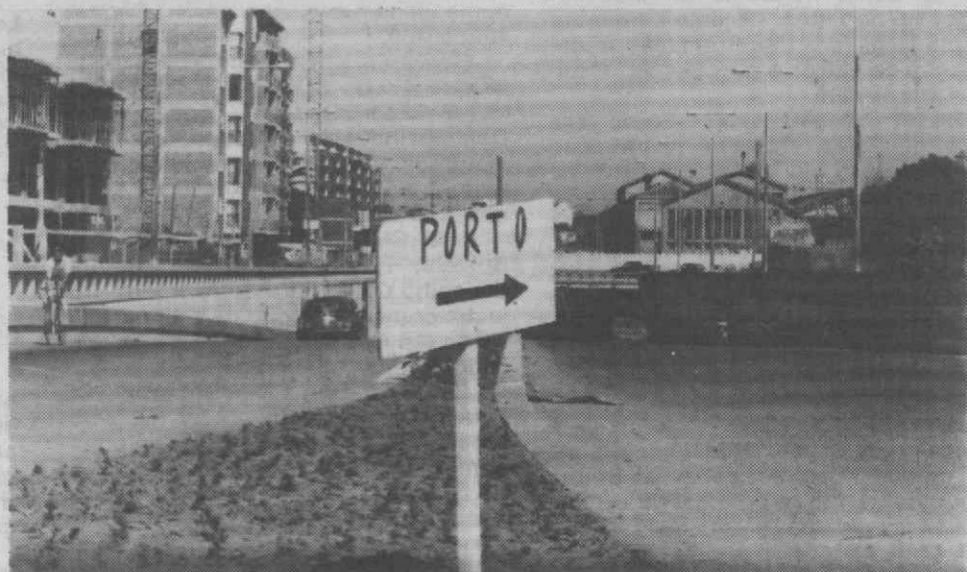
Depois da colocação de nova sinalética luminosa em alguns arruamentos de Aveiro, causou surpresa a colocação, junto ao viaduto de Esgueira, da placa que a foto mostra. Provisória, certamente. Mas que não deixa de ser pouco edificante... lá isso não deixa!