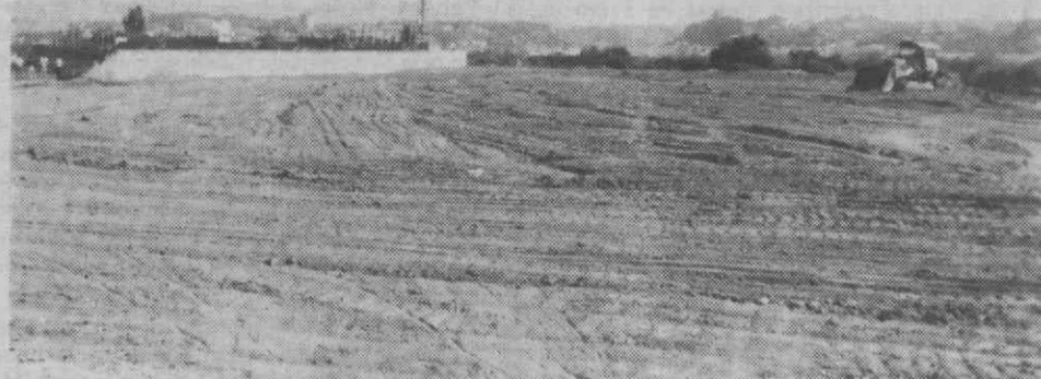
O campo de treinos estará concluído a breve trecho.

dios, alguns dos quais ainda a receber, da DGD, da FPF, da A.F.A. e ainda, da Câmara Municipal. Importa salientar que, como nos disse o presidente da Direcção durante um convívio que o clube promoveu com a Comunicação Social, «há uma grande abertura da Câmara Municipal para apoiar o Recreio em fazer face às verbas que faltam».