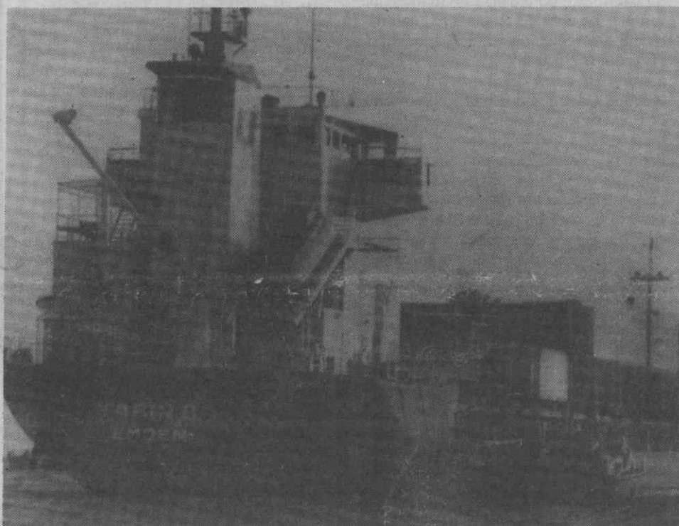
LIVORNO (Itália) — O barco alemão-federal Karin B transportando desperdícios tóxicos está rodeado por barcos da polícia.