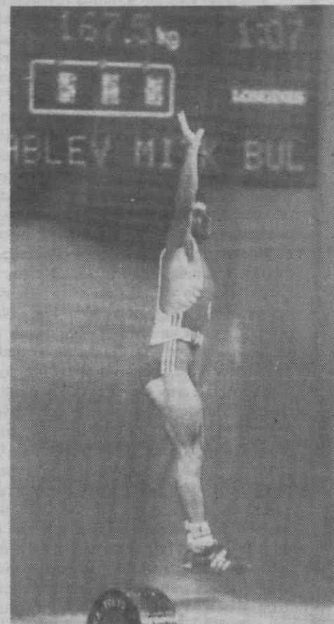
SEUL — Jogos Olímpicos — Halterofilismo — O búlgaro Mitko Grabiev rejubila depois de ter ganho a medalha na categoria de 56 kg.