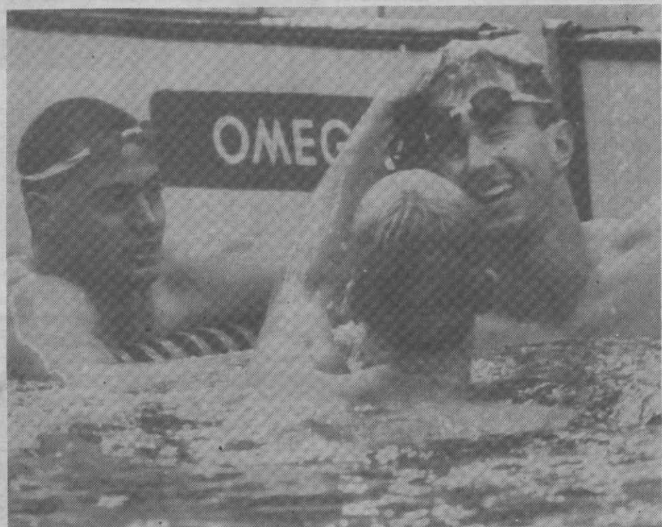
SEUL — Jogos Olímpicos — Natação — O australiano Duncan Armstrong rejubila e recebe parabéns de adversários depois de ter ganho os 200 metros livres e batido o recorde mundial.

Monteiro de Barros e Henrique Anjos têm oportunidade de apagar a má classificação da primeira regata da Classe Star (décimo sétimo lugar entre 23 concorrentes) e o pranchista Luis Calico vai certamente tentar manter-se a meio da tabela ou, se possível, subir uns degraus na Geral.