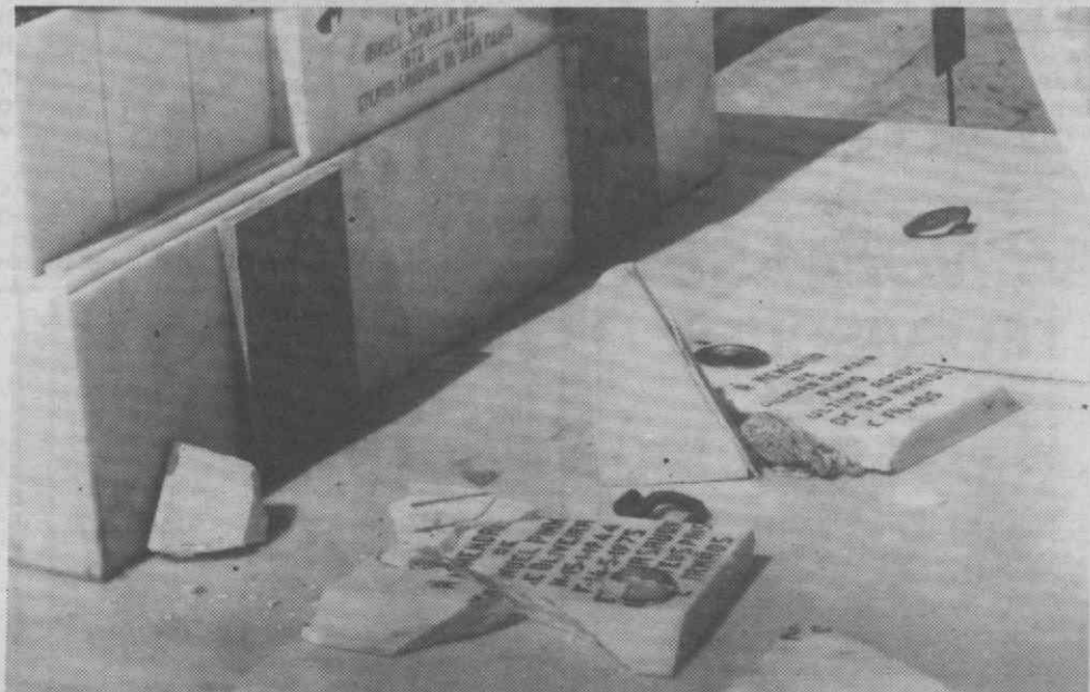
Nas fotos podem ver-se os estragos provocados em alguns dos mausoléus do Cemitério de Esgueira.