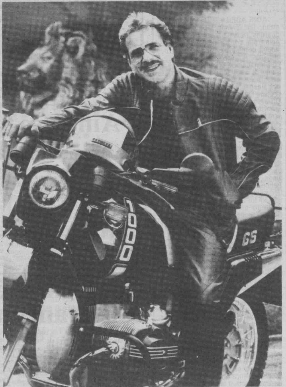
Ao lado de novos modelos de bicicletas a Exposição Internacional de Bicicletas e Motocicletas (IFMA), em Colónia, mostra a tendência técnica das motos. Elas têm de ser menos ruidosas e menos poluentes, é o que diz Götz George (foto), que na República Federal da Alemanha, como o agente da polícia «Schimanski», é um dos artistas de TV e cinema preferidos do país.

A partir de Janeiro de 1989 só será dada matrícula a veículos motorizados de duas rodas na República Federal da Alemanha, se os valores de seus gases de escape corresponderem às normas europeias ECE de Genebra. Os primeiros sucessos neste sector têm sido alcançados pelos novos sistemas de escape (técnica de conversor catalítico) que permitem diminuir o índice de poluentes em 90% sem perda de rendimento. O mesmo objectivo têm as experiências com sistemas de recombustão. Importância idêntica à da redução dos gases de escape nocivos tem a diminuição da poluição sonora pelos veículos motorizados de duas rodas. Quanto a isso a indústria alcançou no passado aperfeiçoamentos consideráveis. Assim, por exemplo, na RFA são produzidas motoretas cujo índice de ruídos é tão baixo que quase não são ouvidas ao transitarem pelas ruas.