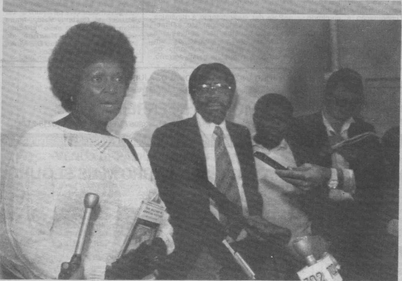
JOANESBURGO — Winnie Mandela e o bispo sul-africano Manas Buthelezi deixam o Consulado norte-americano depois de terem visitado três activistas políticas que fugiram à detenção e procuraram asilo na missão diplomática norte-americana.

de ponta, informática e siderurgia. Quanto ao reforço das relações Portugal/Brasil no contexto da cultura, Abreu Sodré referiu o estabelecimento de um acordo para produção conjunta de filmes portugueses e brasileiros, sobretudo a nível de televisão «onde se verifica uma grande aceitação». Nos primeiros cinco meses de 1988 as importações de produtos brasileiros para Portugal totalizaram 87.011,7 mil dólares enquanto as exportações para aquele mercado cifraram-se em 4.967,8 mil dólares. Para o Brasil Portugal exportou entre Janeiro e Maio de 1988, máquinas, aparelhos e instrumentos mecânicos (23,9 por cento), jornais, livros e revistas, (28 por cento) e bebidas (5,2 por cento).