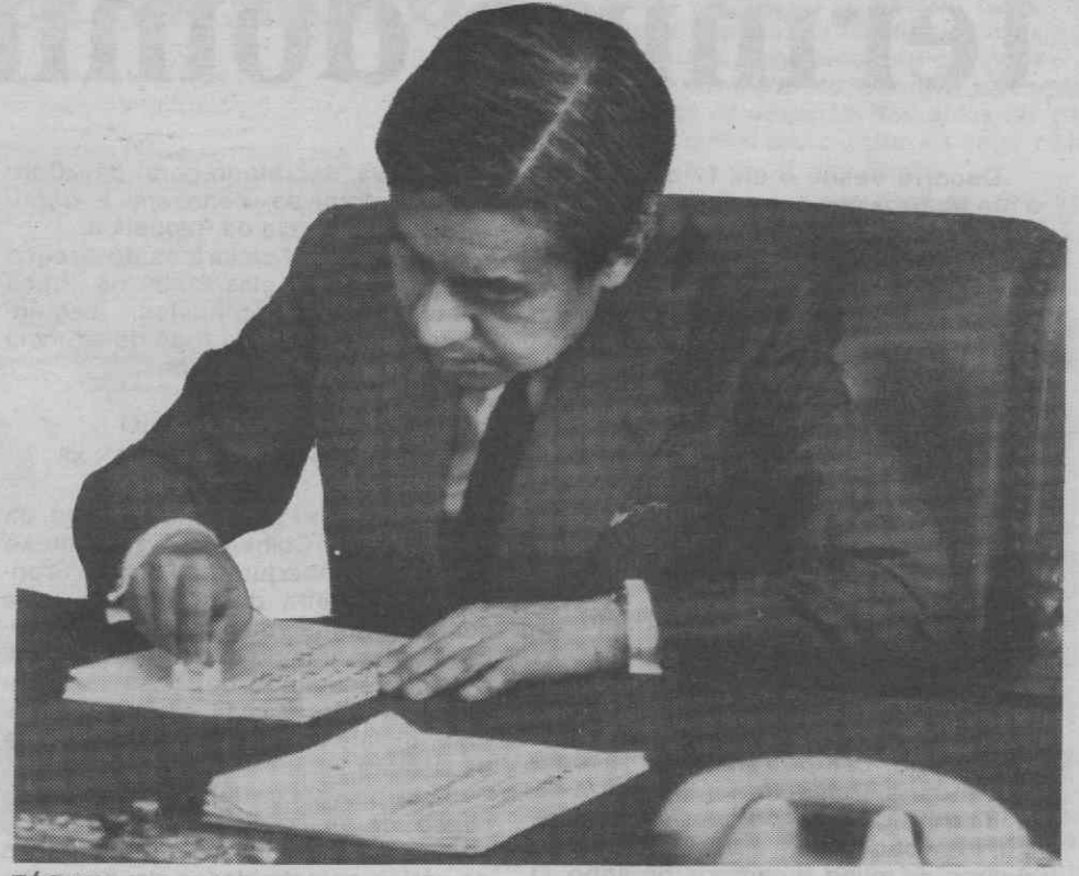
TÓQUIO — O príncipe herdeiro Akihito sela um documento oficial. O príncipe assumiu as responsabilidades constitucionais atribuídas ao Imperador Hirohito. Ler na pág. 9