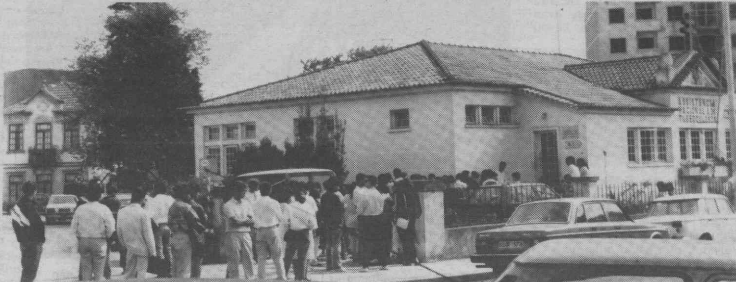
Tirar 'micro' leva tempo, como o comprovam as longas filas que se formam junto do posto, diariamente.

Razões? Muito para além da desusada solicitação a que os serviços estão sujeitos nesta altura do ano (a que se pode acrescentar um avolumar de procura provocado pela avaria do aparelho de S. João da Madeira - o que acontece há meses e que obriga os residentes daquela área a recorrerem os Serviços de Aveiro) estarão a existência de um quadro de pessoal