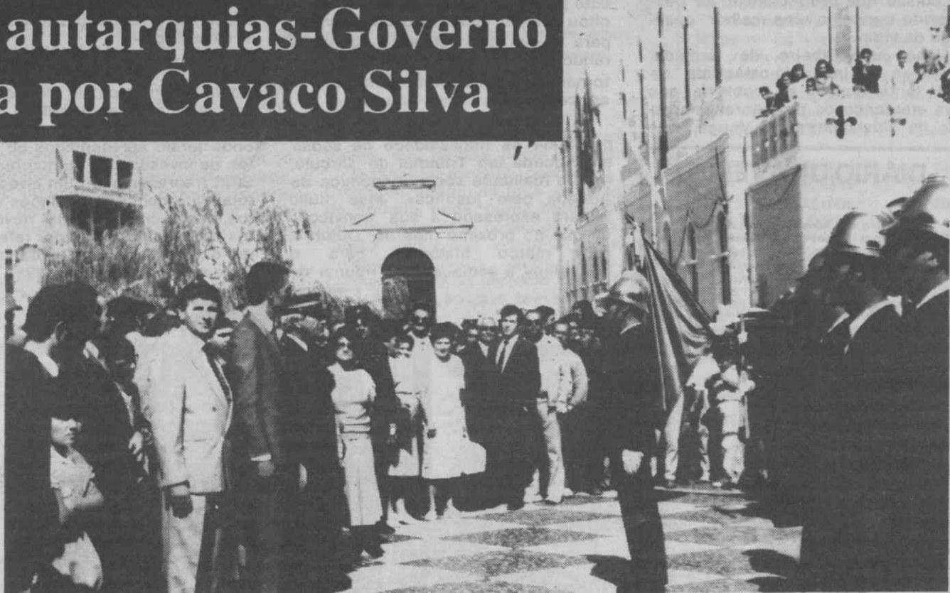
O Primeiro-Ministro e o presidente da Câmara de Vagos recebem as saudações dos BV de Vagos.