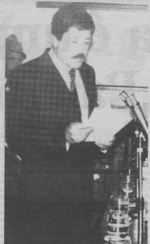
Manuel Rocha galante presidente da Edilidade ilhavense, quando usou da palavra.

«O país está de facto a mexer. O Governo está a procurar condições para potenciar todas estas energias mas ainda há muito trabalho a fazer para manter a expansão económica, a modernização e para ter a coragem de lutar pela preservação do nosso ambiente. Temos que continuar a lutar contra os compadrios os favoritismos contra a corrupção contra as ilegalidades ... e cada caso que aparece enumerado nos jornais, é sinal de que os serviços estão a actuar. E refiro aqui isto porque dissemos de uma forma muito nitida que não existem intocáveis em Portugal, estejam onde estiverem, mesmo nas corporações, mesmo a Guarda Fiscal ou qualquer outra instituição policial» - referiu Cavaco Silva.