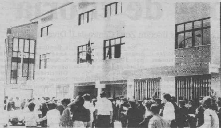
A nova Repartição de Finanças de Vagos, inaugurada no passado sábado pelo Primeiro-Ministro.

Cavaco Silva iniciou a sua visita a alguns concelhos do Distrito de Aveiro em Vagos, onde foi recebido na Câmara Municipal.