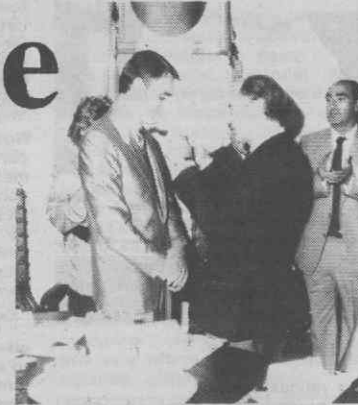
O momento em que o presidente da Câmara de Águeda entregou ao Primeiro-Ministro a Medalha de Ouro da cidade.

Depois de anunciar o arranque, em breve, da «Operação 1992», um programa que visa, segundo o Primeiro-Ministro, «esclarecer os portugueses para o que implica de responsabilidade o desafio que é 1992», Cavaco Silva referiu que, nos próximos 4 ou 5 anos, «Portugal continuará num caminho de progresso e desenvolvimento», caminho no qual «os autarcas desempenharão um papel importante». «Sem olhar a cores políticas, os autarcas deverão manter neste concelho a capacidade de iniciativa, a vontade de empreender e de modernizar», afirmou o Primeiro-Ministro que, após uma referência aos empreendimentos que, a breve trecho, se iniciarão em Águeda, diria: «Águeda vai ter todas as condições para continuar a oferecer cada vez mais condições de progresso e de bem estar às suas gentes». «Que o Portugal de 1992 seja um Portugal diferente e para melhor, sem perder a sua identidade», desejou o Primeiro-Ministro, para finalizar, dei-