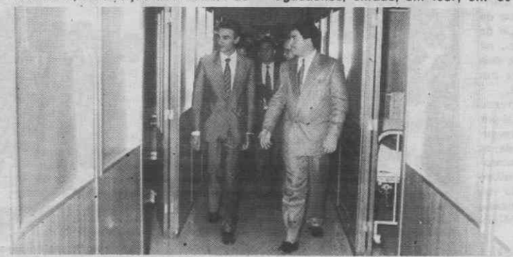
Cavaco Silva numa das enfermarias do Hospital de Águeda.