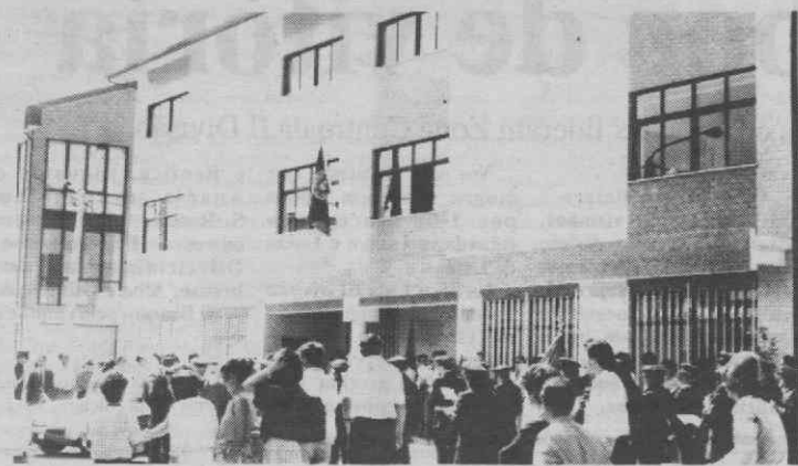
A nova Repartição de Finanças de Vagos, inaugurada no passado sábado pelo Primeiro-Ministro.