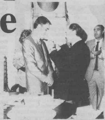
O momento em que o presidente da Câmara de Águeda entregou ao Primeiro-Ministro a Medalha de Ouro da cidade.

«Que o Portugal de 1992 seja um Portugal diferente e para melhor, sem perder a sua identidade», desejou o Primeiro-Ministro, para finalizar, dei-