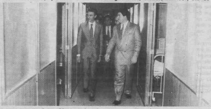
Cavaco Silva numa das enfermarias do Hospital de Águeda.