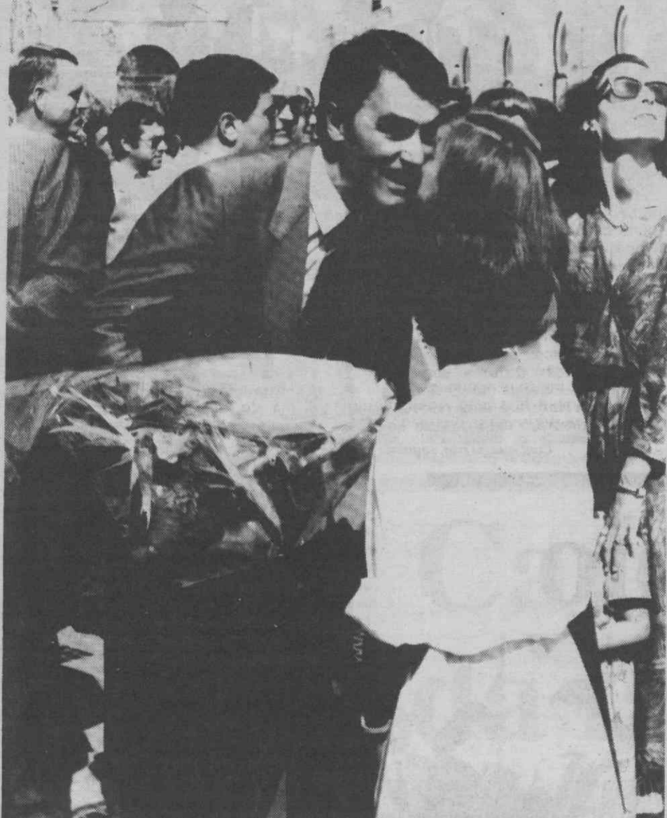
Cavaco Silva foi alvo de manifestações de simpatia como a foto documenta.