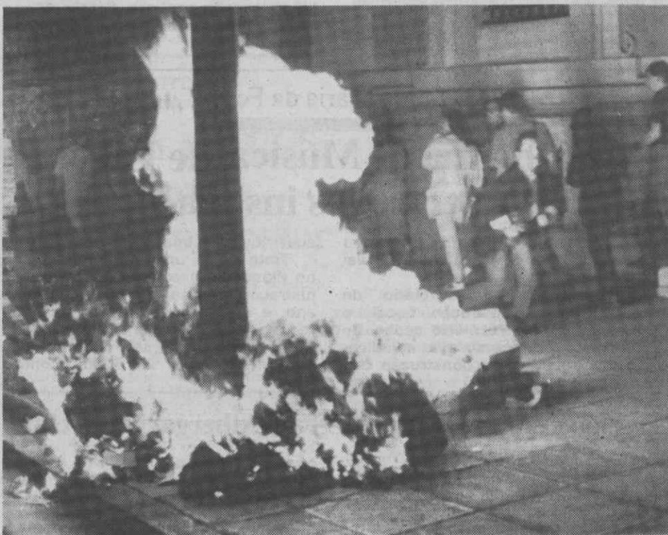
ATENAS — Transeuntes passam junto de um monte de resíduos incendiados por uma bomba incendiária lançada por manifestantes anarquistas durante confrontos com a polícia no centro da capital grega.

A Espanha exportou nos primeiros 8 meses do ano 7.000 toneladas de carne fresca e 2.000 animais vivos.