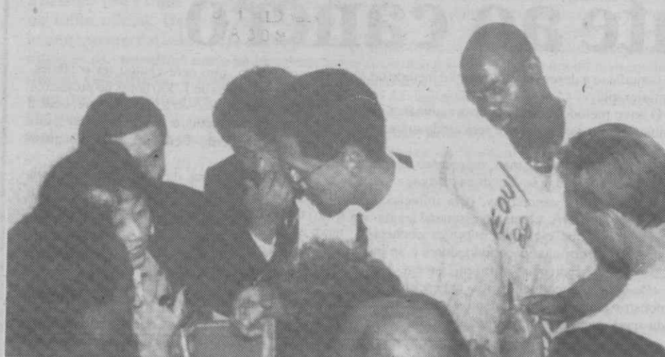
SEUL — Ben Johnson na altura em que aguardava pelo controlo antidoping após ter corrido os 100 metros planos vendo-se rodeado por vários responsáveis olímpicos e pelo responsável da equipa canadiana.

No dia em que Johnson perdeu a medalha, outros campeões subiram ao podium: o campeoníssimo Greg Louganis nos saltos para a água (alto voo), Olaf Ludwig no ciclismo, Suzanne