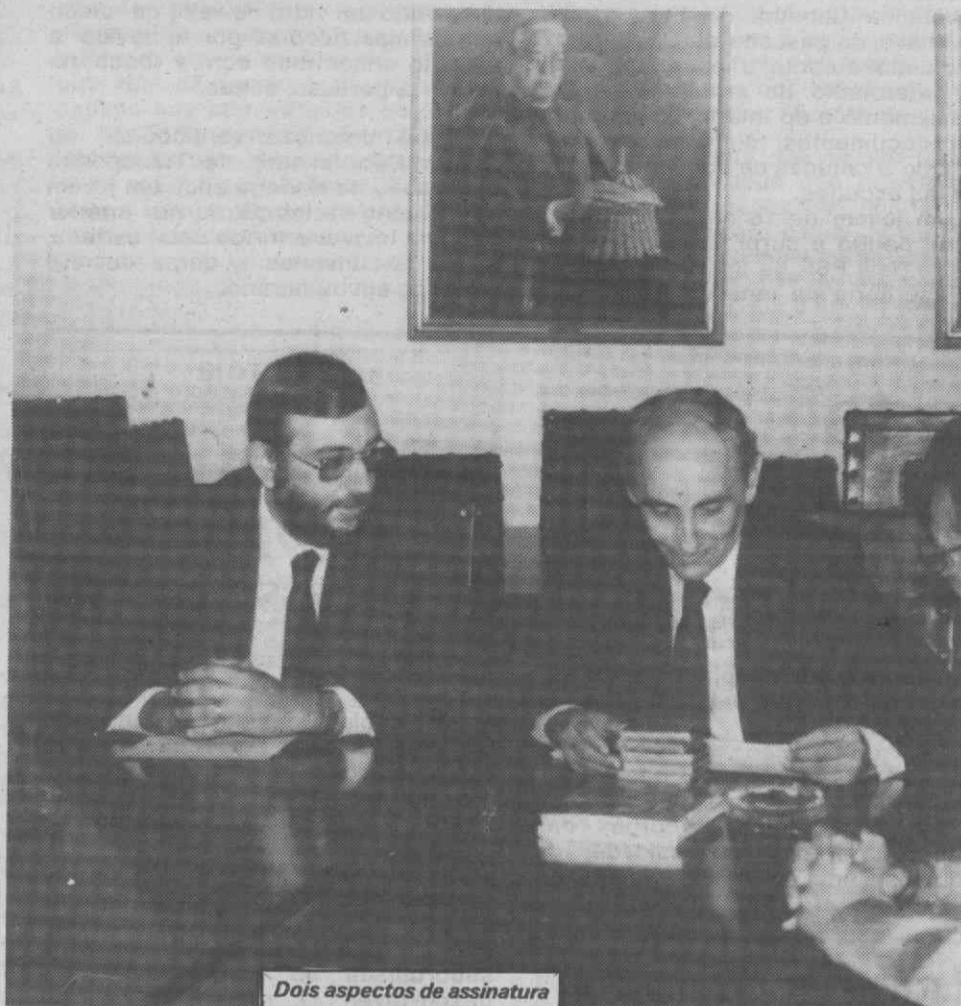
Dois aspectos de assinatura do Protocolo de Cooperação entre a UA e o MIE.

A assinatura do Protocolo estiveram presentes o director do Departamento de Ambiente, e responsáveis pela Delegação Regional de Coimbra do MIE.