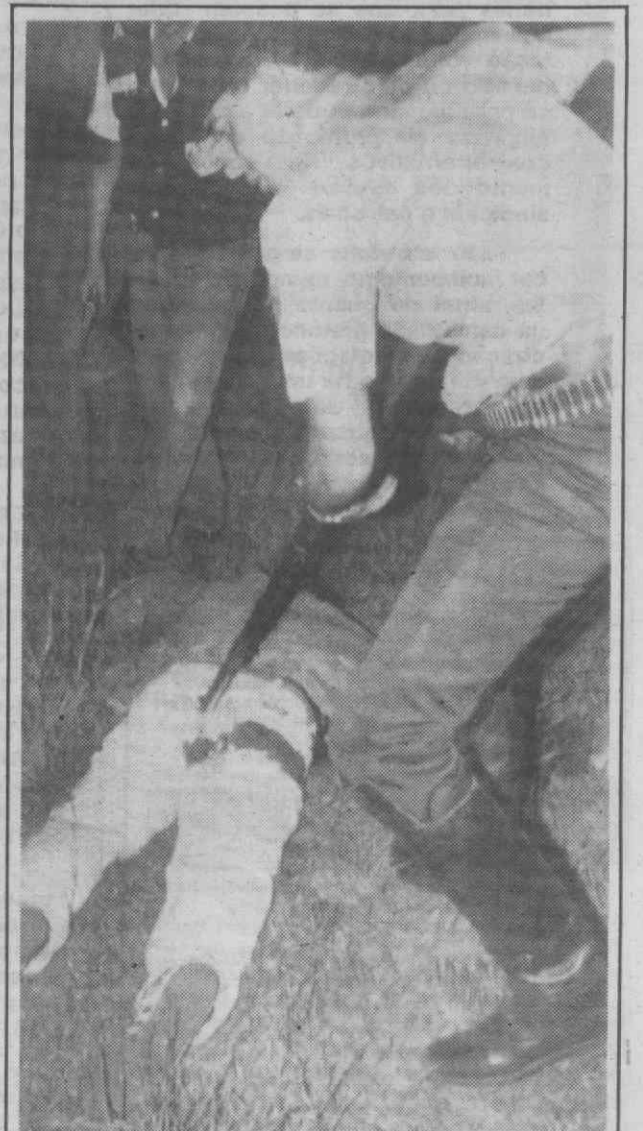
GOIANIA (Brasil) — Um polícia aponta a sua espingarda ao sequestrador de um avião das linhas aéreas estatais, que jaz no solo ferido.