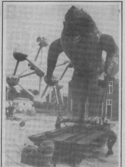
BRUXELAS — Um «King Kong» gigante junto ao Atomium onde irá abrir o maior complexo cinematográfico.