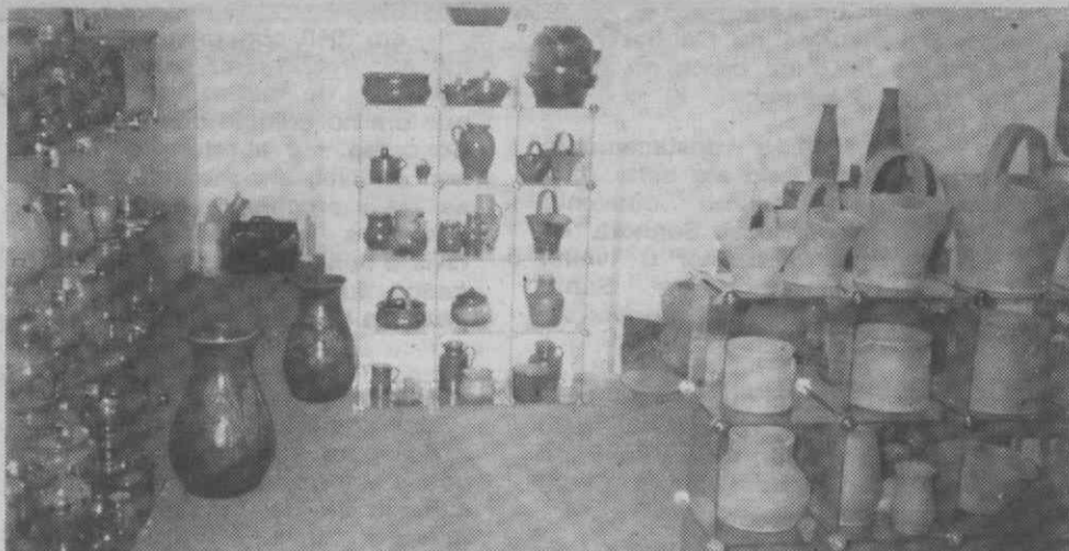
Um aspecto do stand das empresas aguedenses.