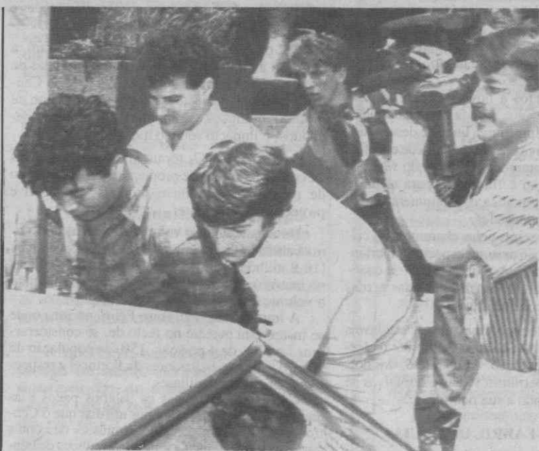
SYDNEY — Prisão de elementos de uma rede internacional de droga quando tentavam introduzir 43 kg de heroína na Austrália.