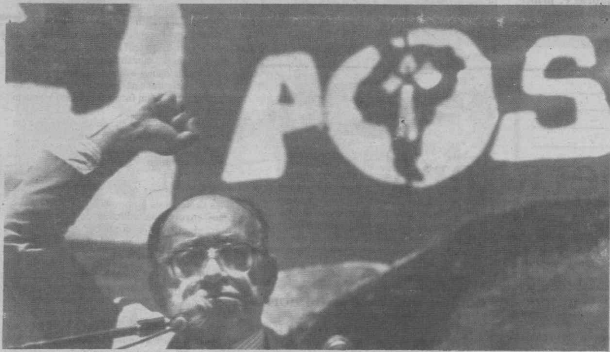
SANTIAGO DO CHILE — O líder da coligação Esquerda Unida, Clodomiro Almeyda, saúda os manifestantes durante comício.