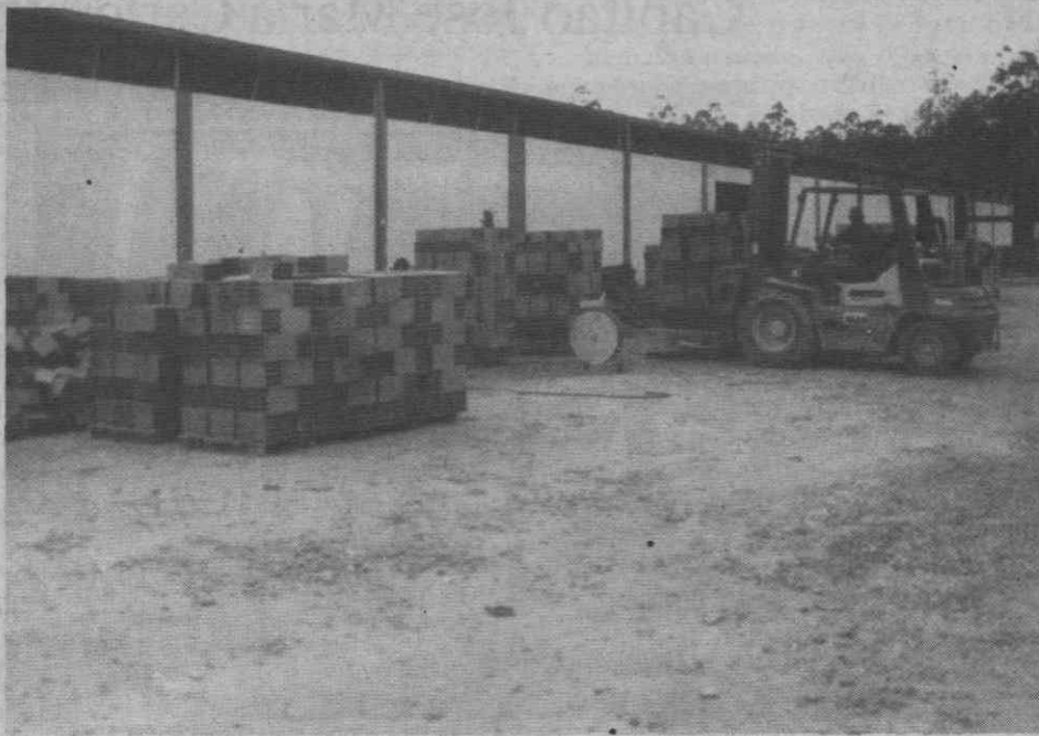
300 toneladas/mês: a meta da produção da IBV.

Esta nova empresa sucede à cerâmica Barrol, constituindo o resultado, segundo o Conselho de Administração, «de uma notável obra de recuperação e reconversão, exclusivamente efectuada por conhecidos técnicos e industriais portugueses», sendo de salientar o apoio da Direcção Regional do Centro do Banco Pinto & Sotto Mayor, que possibilitou, «com grande compreensão e capacidade de decisão», a recuperação de uma fábrica quase totalmente destruída, recuperação que, ainda segundo o Conselho de Administração, que «poderá considerar-se pouco vulgar e quase exemplar».