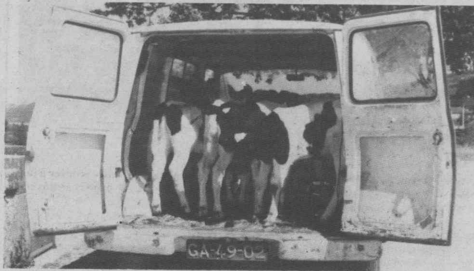
Algum do gado apreendido pela Guarda Fiscal.

Entretanto, o Chefe do Estado Maior da Guarda Fiscal divulgou um Comunicado em que são divulgados os resultados de diversas operações levadas a cabo por aquela Corporação durante a primeira quinzena do