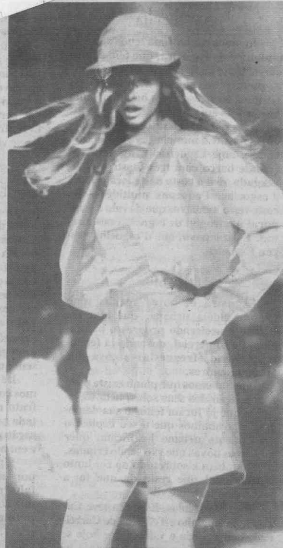
PARIS — Moda Primavera/Verão — Modelo de pronto a vestir do costureiro italiano Enrico Coveri.

DIÁRIO DE AVEIRO - AE Biblioteca Municipal Praça da República 3800 AVEIRO