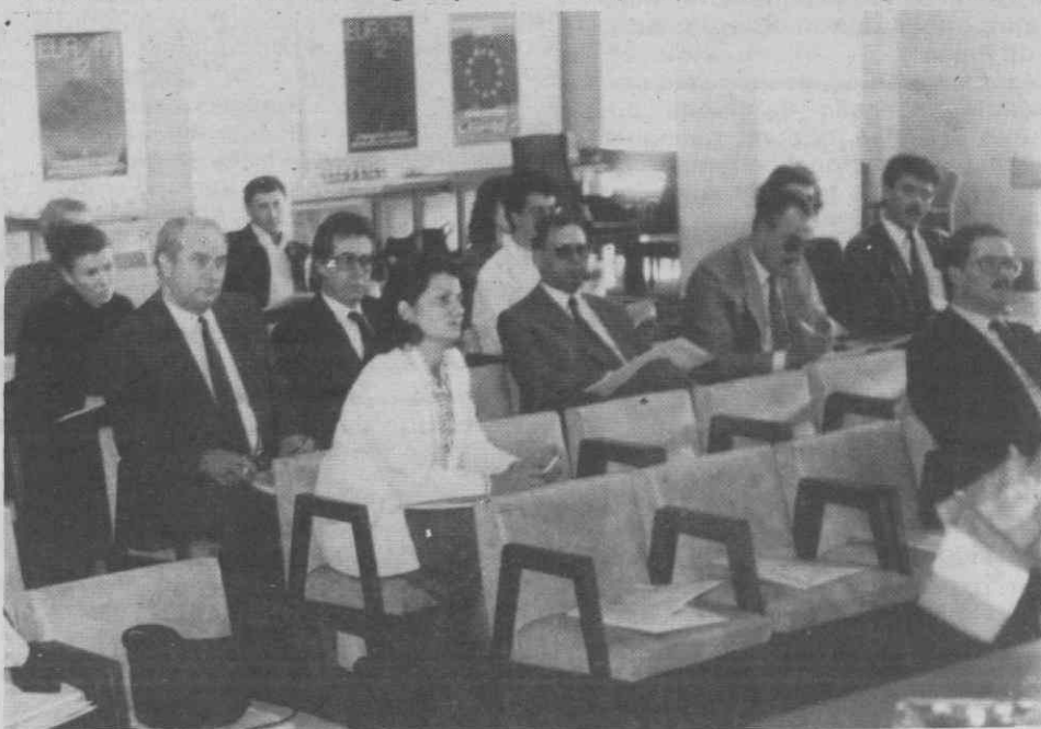
Algumas dezenas de empresários assistiram ao colóquio sobre «Actividades empresariais no quadro de 1992», realizado em Aveiro, no âmbito do programa «A Europa Nosso Futuro».

Refira-se, por último, que o colóquio, realizado no Salão Cultural do Município, foi organizado pela Associação Industrial do Distrito de Aveiro, em colaboração com o Gabinete de Imprensa e Informação para Portugal da Comissão das Comunidades Europeias, enquadrando-se no âmbito do programa «A Europa Nosso Futuro» que trouxe a Aveiro, para além de uma exposição alusiva à temática, acções de sensibilização desenvolvidas em diversos estabelecimentos de ensino locais.