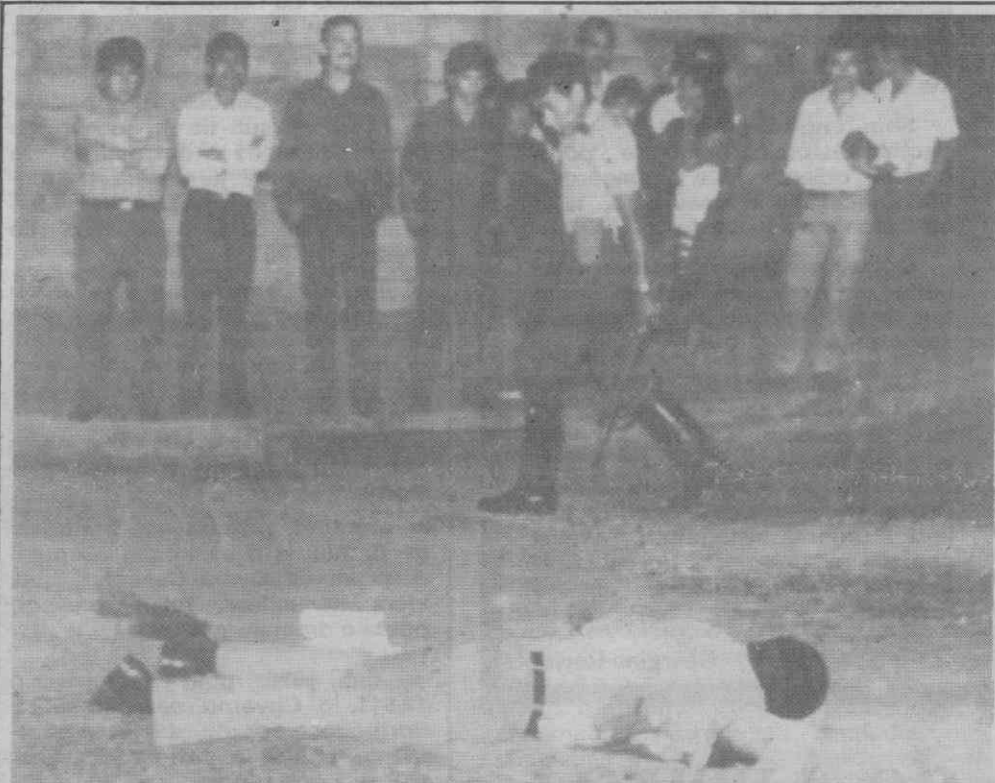
SAN SALVADOR — Residentes olham para o corpo de um membro da guerrilha urbana caído no solo após ter sido atingido mortalmente durante um ataque a um autocarro de passageiros.