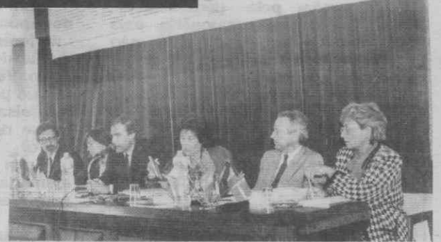
Um aspecto da mesa, onde se destacam os representantes do Instituto Português da Qualidade, do Instituto da Qualidade Alimentar, do Instituto do Comércio Externo Português, da AIDA e do Gabinete de Imprensa e Informação para Portugal da Comissão das Comunidades Europeias.

— afirmado em Aveiro, num colóquio sobre normalização e certificação de produtos