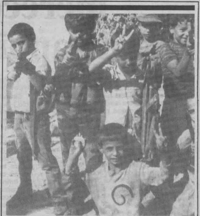
EAST SIDON — Sul do Líbano — Crianças palestinas com armas de brincar fazem o sinal da vitória.

A defesa do ambiente, do património natural e construído, e a conservação da natureza e promoção da qualidade de vida continuarão a ser objectivos dos Escuteiros Católicos portugueses, que no limiar dos 50.000 associados têm na natureza uma das suas maiores áreas de actividade.