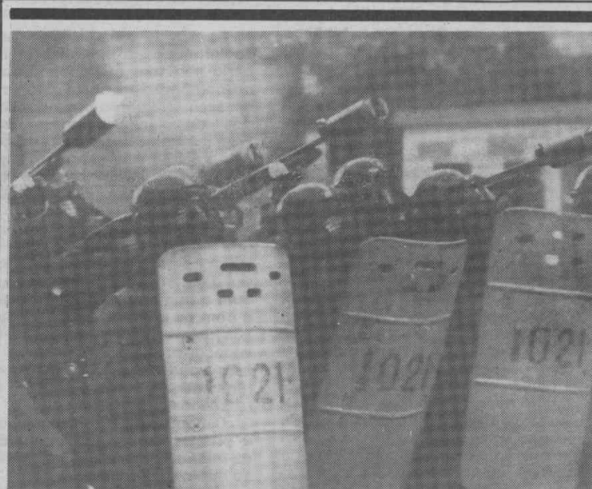
SEUL — Polícia de choque lança granadas de gases lacrimogéneos contra manifestação de estudantes.