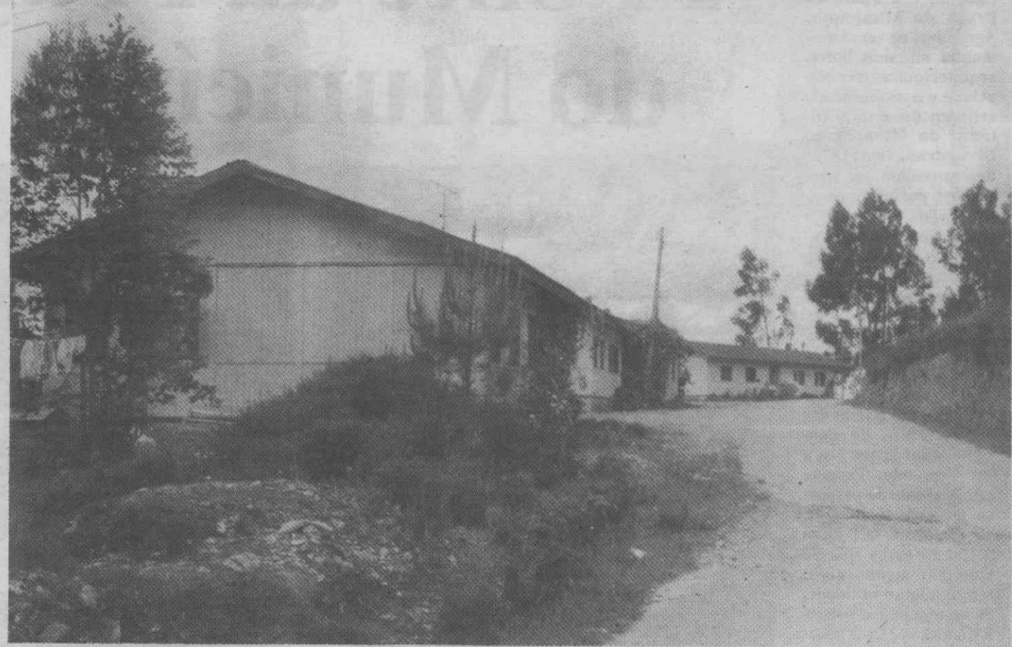
A falta de água em Á-dos-Ferreiros é constante.

Depois de se referir que os moradores «não aceitam mais esta insupportável situação», pode ler-se no abaixo-assinado que «enquanto decidem reclamar pela resolução urgente de tão grande problemas», os moradores «decidem simultaneamente não mais pagar as importâncias que, a partir da presente data, os SMAS irão pôr à cobrança dos utentes, enquanto não estiver garantido, em termos