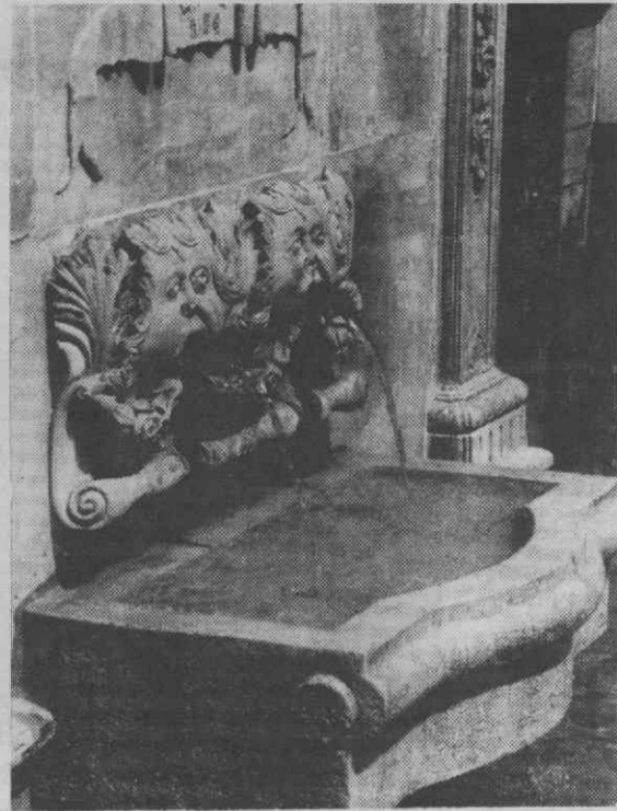
A fonte de 1870 com a nova bacia da água.

artista fotográfico e investigador imagético da cidade de Adolfo Portela, e, ainda, como resultado das suas intervenções nos jornais e