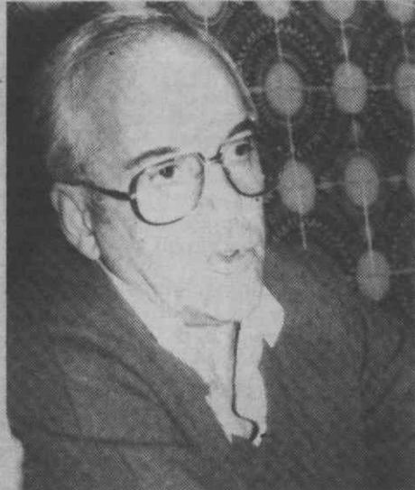
Dr. Sodrê Borges, presidente da Sociedade Portuguesa de Pediatria: o centro de saúde tem de ser o alicerce e a base de todo o sistema.

Relativamente aos problemas sentidos pelos médicos e utentes Sodrê Borges realçou ao «DA», no final dos trabalhos das IX Jornadas de Pediatria que antontem encerraram em Aveiro, que a assistência e prevenção da criança deveria pertencer aos centros de saúde. No seu entender «a nossa perspectiva é a de que os problemas deverão ser resolvidos para que, a curto prazo, possamos atingir metas perfeitamente europeias. É preciso tomar conjuntos de medidas para minorar as dificuldades sentidas no sistema de saúde onde a «assistência na doença e os programas de