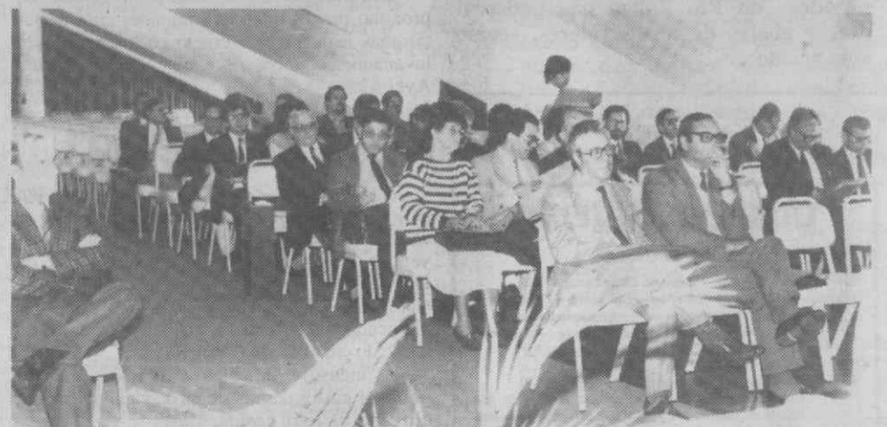
Um aspecto dos participantes no colóquio sobre a importância da Imprensa Regional na Construção Europeia.

— defendido, em Aveiro, num colóquio sobre a importância da Imprensa Regional