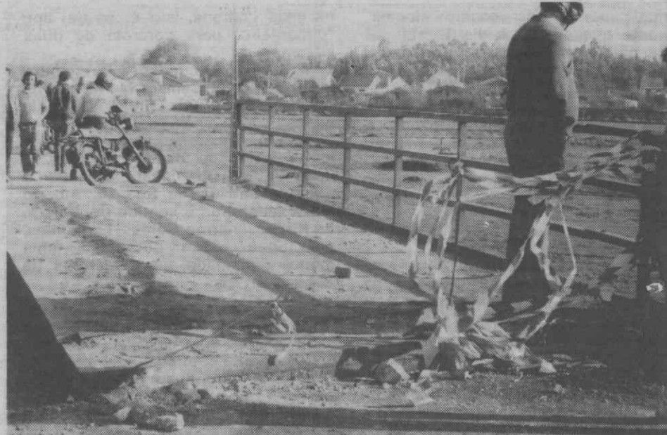
As bermas da ponte (com nível superior ao do piso da estrada) são uma autêntica «ratoeira». Sem medidas para solucionar o caso e a necessária sinalização, a morte poderá vir a ser uma constante na EN 109.

De facto, a ponte sobre a linha do Vouga, constitui uma autêntica «ratoeira» para qualquer automobilista que poderá, à falta de uma sinalização consciente para solucionar o problema, mais tarde ou mais cedo, encontrar ali a morte.