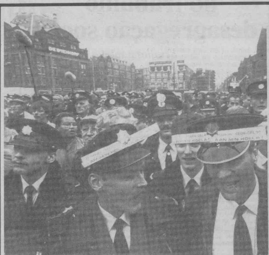
AMSTERDÃO (Holanda) — Um significativo aspecto da manifestação de polícias desta capital, reclamando por melhores salários. Durante a manifestação os polícias não passaram multas...