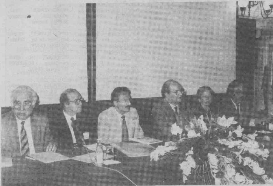
Mesa Redonda, levada a efeito no final das I Jornadas de Investigação Cardiovascular, que decorreram em Lisboa de 7 a 9 de Novembro.

Especialistas latinos, reunidos em Lisboa, advertiram para o papel das gorduras animais como factor de risco da aterosclerose, e realçaram o interesse indiscutível do azeite e do peixe para evitar a doença.