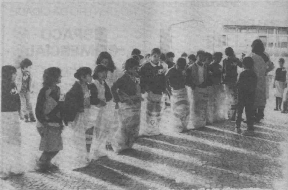
Os alunos da Escola Primária n.º 5 de Esgueira tiveram ontem um dia diferente do que é habitual com a realização de um convívio preenchido com diversas actividades às quais não faltou o tradicional magusto nesta altura. A projecção de um filme infantil e a pintura livre deixaram bem patentes o interesse dos 340 alunos na sua ligação com a escola. Acompanhados pelos 21 professores, repartiram-se ainda por outras actividades, nomeadamente corridas de sacos e a execução de um crachá. A Escola Primária n.º 5 de Esgueira é a única no distrito de Aveiro que desenvolve o projecto «Escola-Cultura».