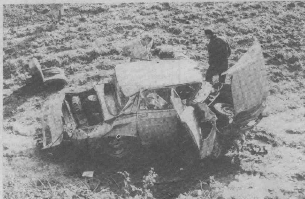
O estado em que ficou o veículo de Carlos Correia depois de cair numa ravina de 40 metros.