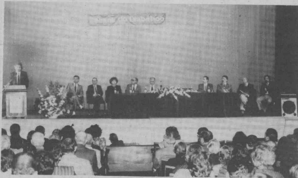
O número de diabéticos no distrito de Aveiro é alarmante.

No entanto, as expectativas criadas vieram exigir mais e quatorze diabéticos subscreveram a constituição da Associação de Diabéticos do distrito de Aveiro que, em colaboração com o núcleo regional, procurará reduzir os problemas existentes. O distrito de Aveiro terá - segundo o dr.