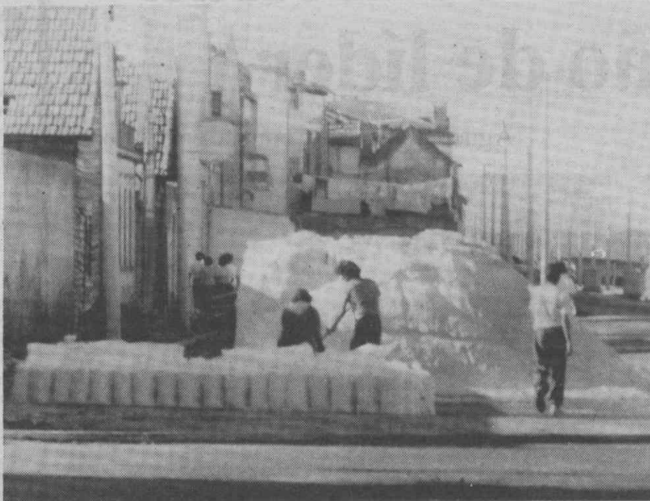
Sal da Tunísia num armazém no canal de S. Roque

Os marnotos da região de Aveiro acusam a Cooperativa de «inoperância» e mesmo «conivente» com tal estado de coisas, criticando o facto de também ela própria possuir sal da Tunísia nos seus armazéns.