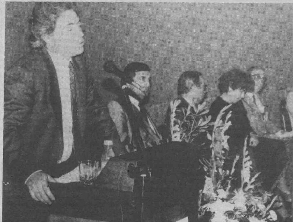
Aspecto da mesa de encerramento da II Semana de Diabetologia de Aveiro.

Perante os números alarmantes de uma doença que tem conhecido aumentos significativos em Portugal verifica-se que o Poder Central tem de despende anualmente uma verba alargada. Os diabéticos custam ao País quinze milhões de contos que são repartidos pelas estruturas médicas cabendo aos hospitais distritais e centrais dois milhões e quinhentos mil contos — referem dados fornecidos pelo director da recentemente constituída Sociedade Portuguesa de Diabetologia na última acção da II Semana do Diabético que terminou este fim-de-semana em Aveiro destinada a sensibilizar a população para os problemas da diabetes.