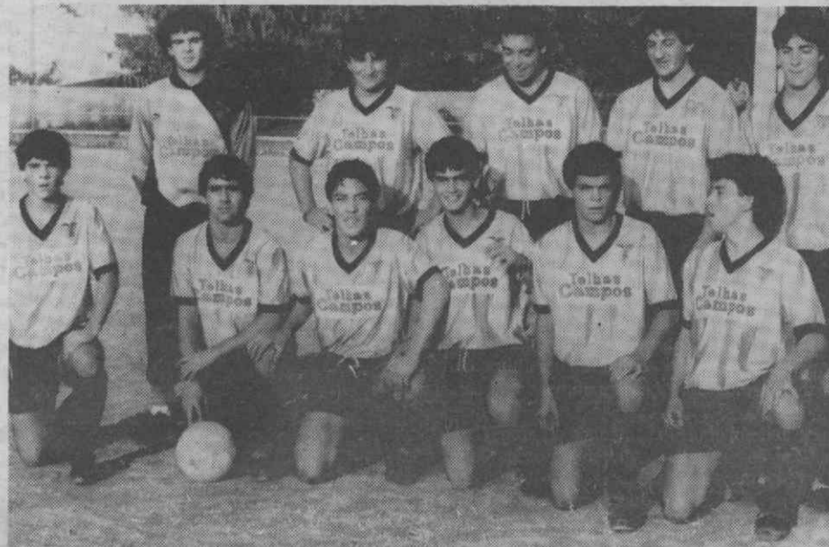
A equipa júnior do Beira-Mar que venceu o Sporting da Covilhã.

A equipa da Gândara apenas com uma vitória em nove jogos, tem cinco