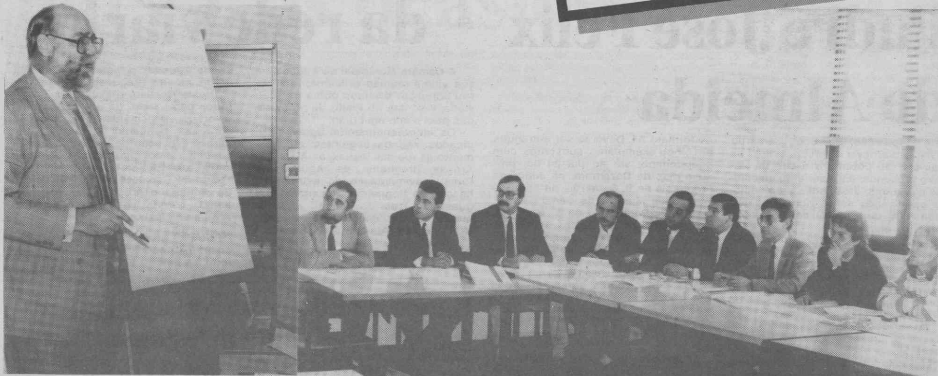
A formação é essencial para a gestão nas pequenas e médias empresas industriais. À esquerda um professor da Glasgow Business Scholl quando intervém no seminário.

— Mestrados em Engenharia arrancam em Janeiro próximo