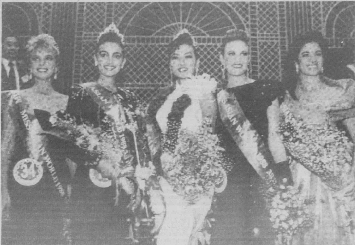
TAIPÉ — As misses eleitas, em traje de noite, no final do concurso que decorreu em Taipé.

Quanto às gravações, as respostas serão depois enviadas pelo correio.