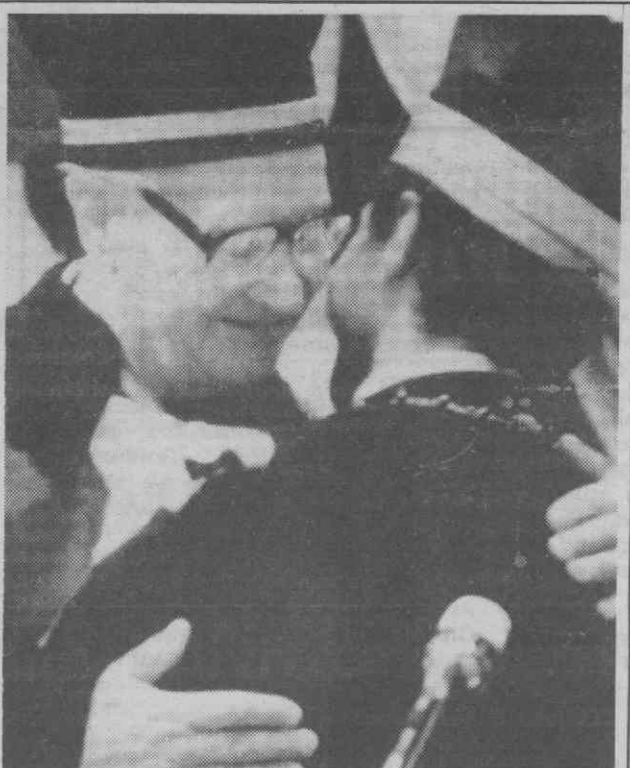
BOLONHA (Itália) — Cerimónia de investidura Honoris Causa, do ex-líder checoslovaco, Alexander Dubcek. Ler na última página)

Assinalando 25 anos de serviço em São Bernardo