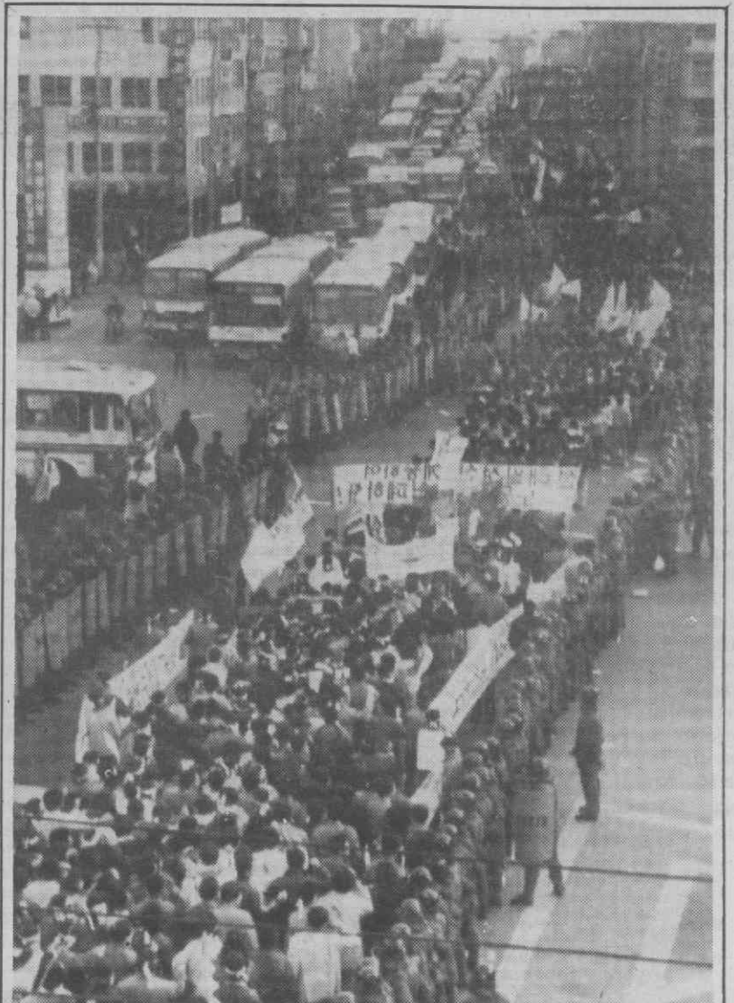
SEUL — Manifestantes marcham por entre um corredor de polícias antimotins.