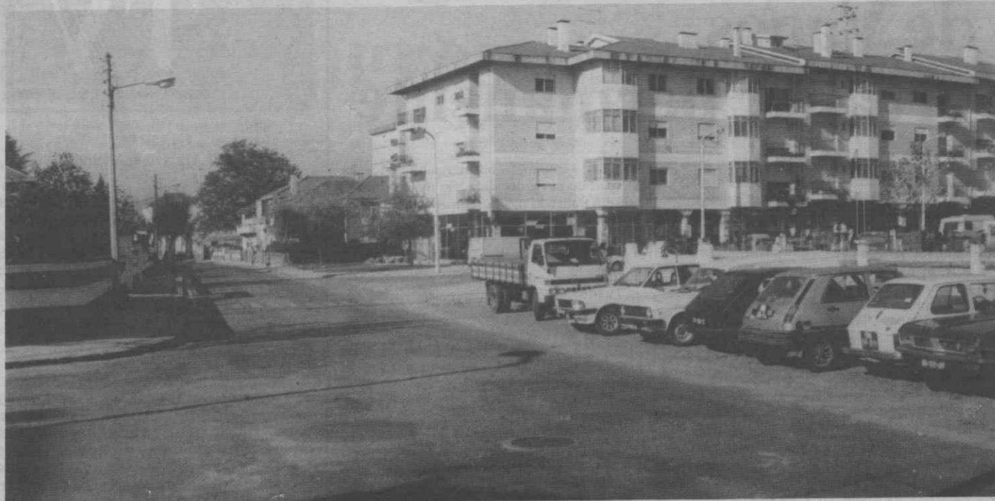
A Rua Manuel Alegre representa perigo para as muitas crianças que frequentam a Escola P3.