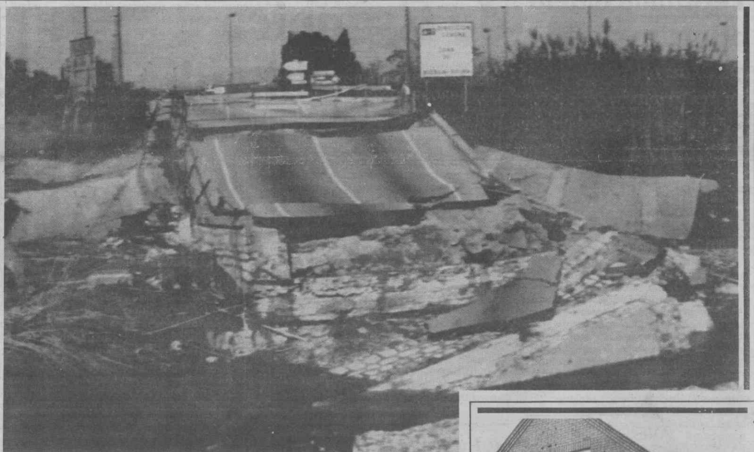
SAINT VICENT DEL HORTS (Espanha) — Ponte destruída devido às fortes chuvas torrenciais que caíram nesta região da Catalunha.