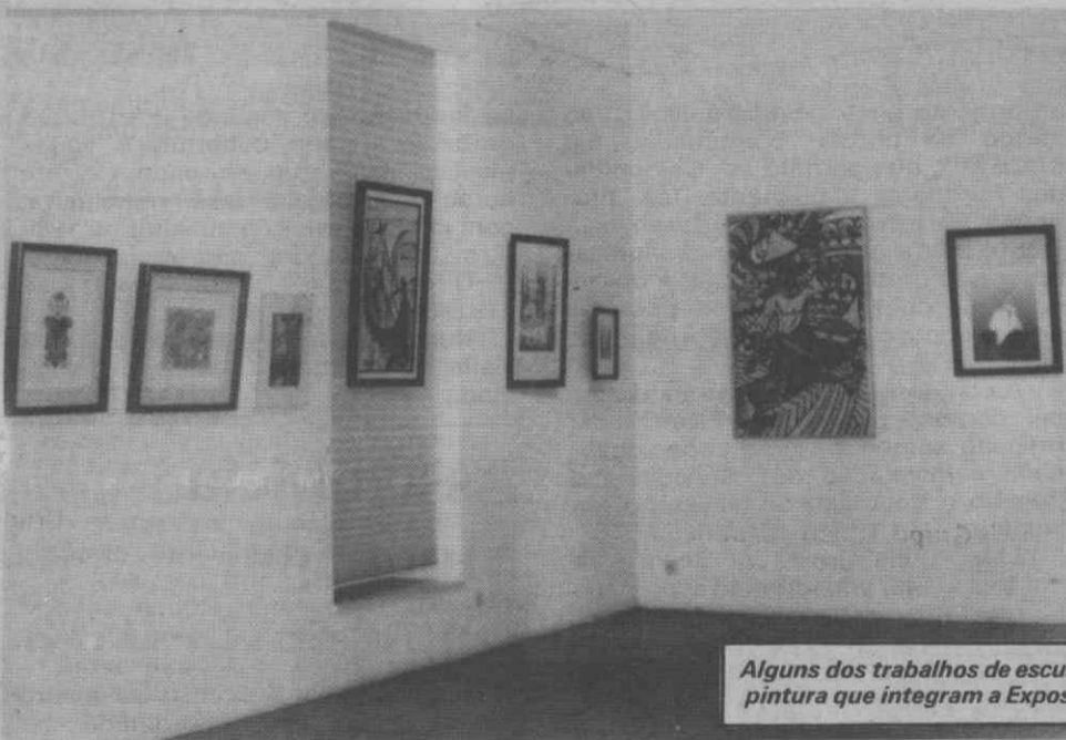
Alguns dos trabalhos de escultura, tapeçaria e pintura que integram a Exposição de Outono.

Uma exposição de trabalhos de vários artistas plásticos, designada «Exposição de Outono» está patente na Galeria Municipal de Aveiro.