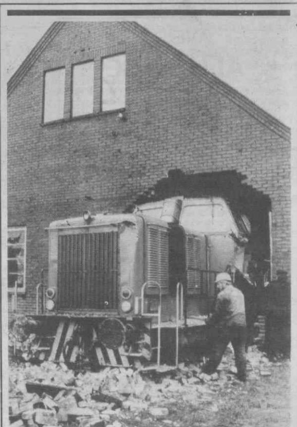
PINNEBERG (Alemanha Federal) — Uma locomotiva ferroviária entrou no meio do celeiro depois do condutor ter acelerado em vez de travar. Os estragos estão avaliados em cinquenta mil marcos.

Começa, assim, a desenhar-se uma «guerra fria», com muito calor de per-meio.