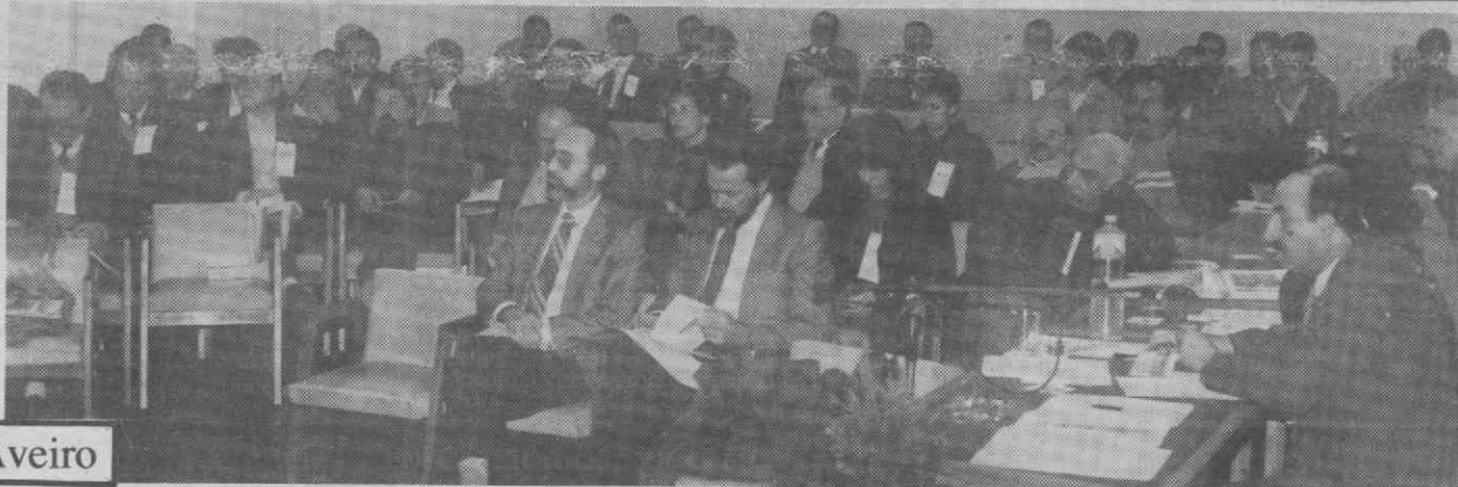
Um aspecto dos congressistas.