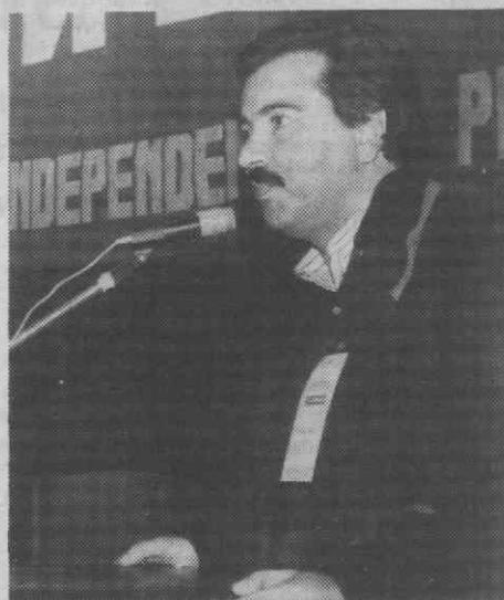
Torres Couto: uma greve geral poderá estar iminente.

to do Secretariado, disse que «no campo da legislação laboral ficou assente continuar a lutar por uma legislação moderna que vise a perspectiva global das melhorias das condições de vida dos trabalhadores».