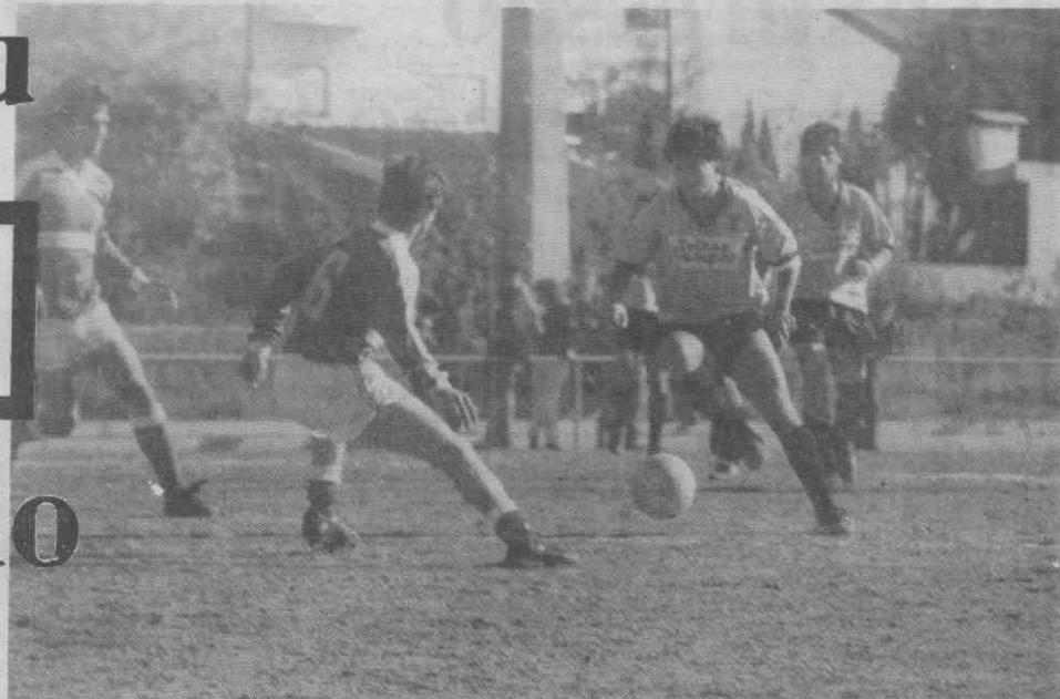
Este fim-de-semana em Aveiro jogaram os juvenis do Beira-Mar com o Académico de Viseu. A foto mostra um avançado aveirense perante a oposição de dois contrários.

Os destaques do fim-de-semana desportivo