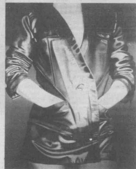
«Blazer» óleo sobre tela (130x160).