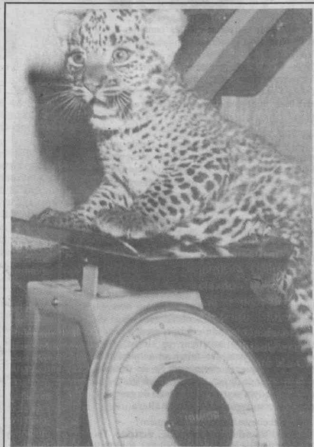
AMSTERDÃO (Holanda) — Uma pantera do Sri Lanka com seis semanas durante o seu primeiro exame médico.