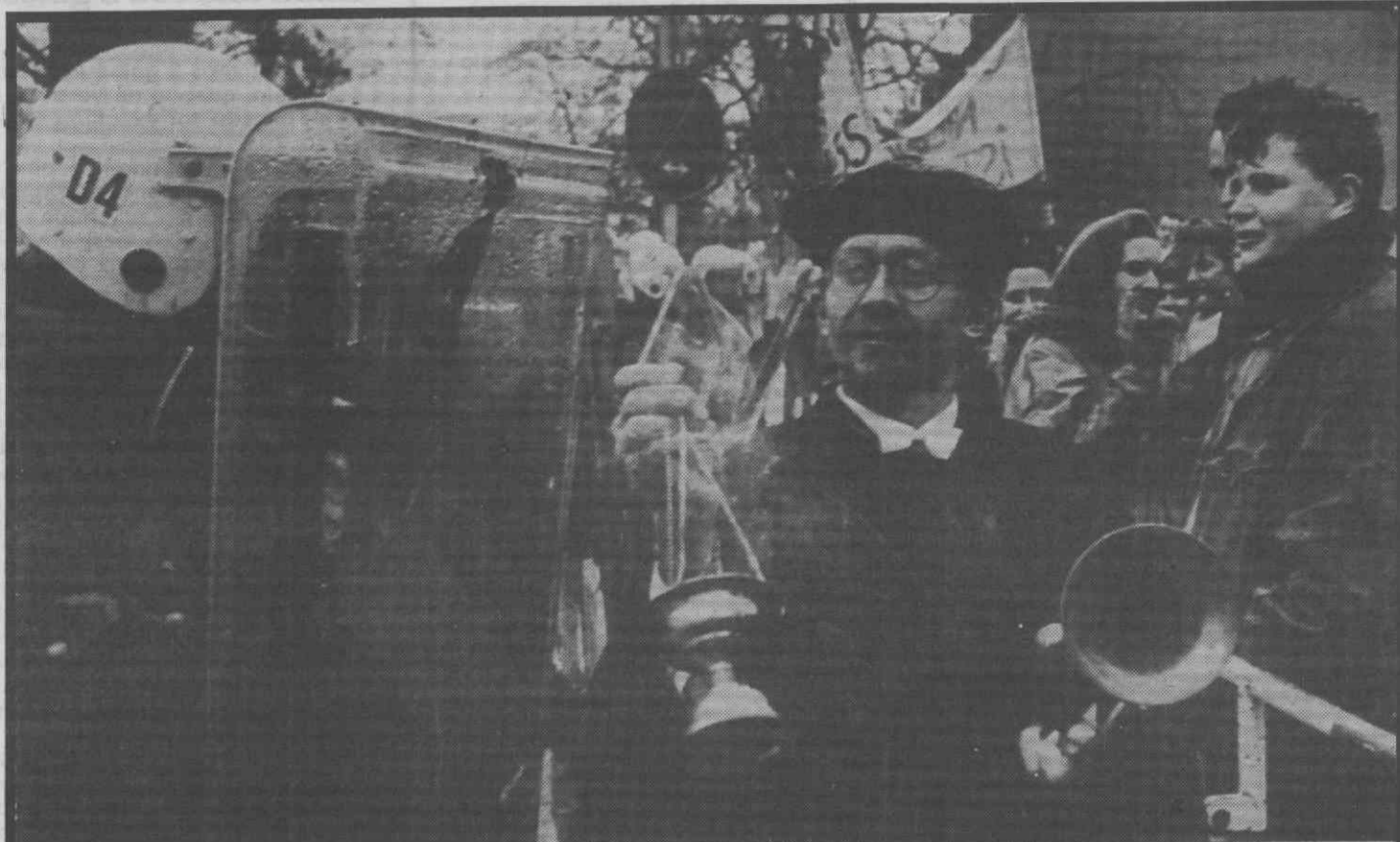
BERLIM OCIDENTAL — Estudantes universitários manifestam-se a favor de reformas no ensino.

MADRID — A Espanha e a Argélia analisaram segunda-feira, pela primeira vez em termos técnicos, o projecto de construção de um gasoduto, que transportará gás natural daquele país árabe para a Europa, foi ontem anunciado em Madrid. O gasoduto, que será ligado à rede francesa, passará por Marrocos e pela Espanha, e poderá ter ligação com Portugal através do Sul da Península Ibérica.