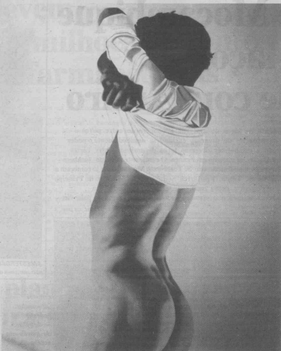
«Modelo» óleo sobre tela (130x160).

— Quanto ao «demasiado formalista» considero isso um elogio se tomarmos a expressão como um exagero no tratamento da forma. Quanto à «falta de garra», se eu te dissesse o contrário, acabaríamos na discussão fútil e subjectivista. Eu continuava a contrariar e não havia dicionário ou código que dessemptasse o pensamento de cada um.