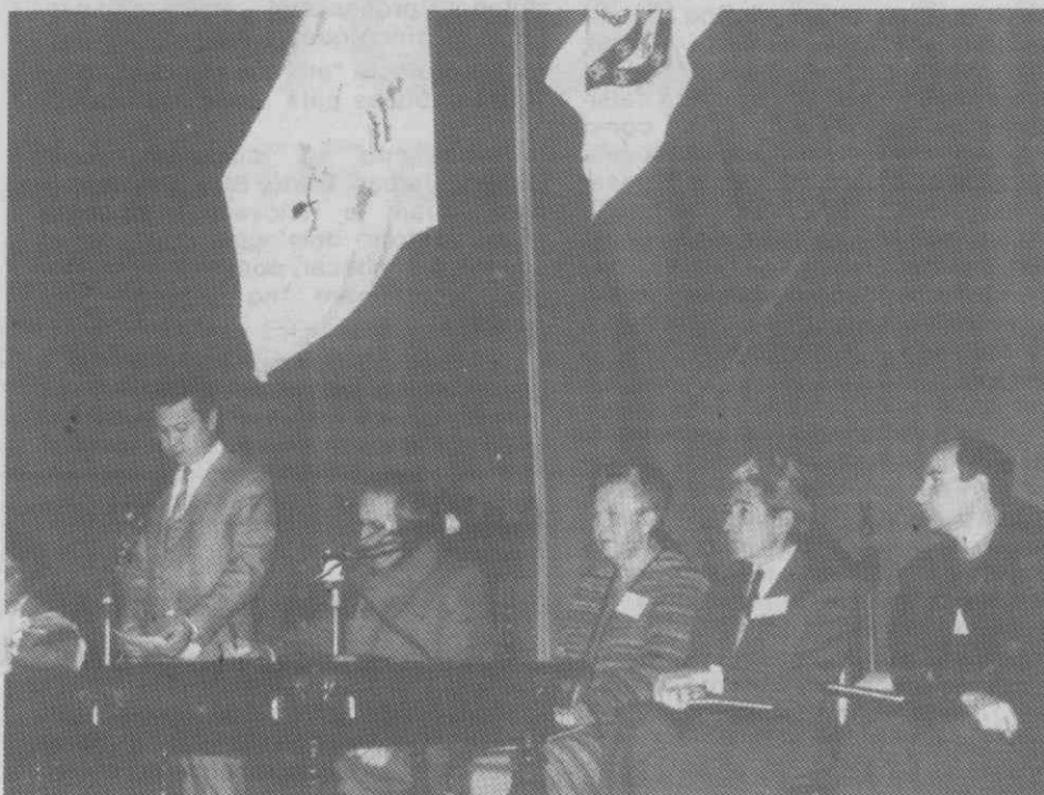
O ministro da Educação quando intervém no Congresso dos Leigos, em Aveiro.

«A mudança é um sinal dos tempos e os sinais dos tempos são um modo de Deus nos falar, de nos chamar a atenção para realidades novas ou esquecidas. Os tempos mudam e a Igreja passou a ser escuta atenta de Deus e dos homens, aprendizagem permanente de uma linguagem nova, declaração e manifestação paciente do novo modo de estar e de se relacionar com os homens e com o mundo».