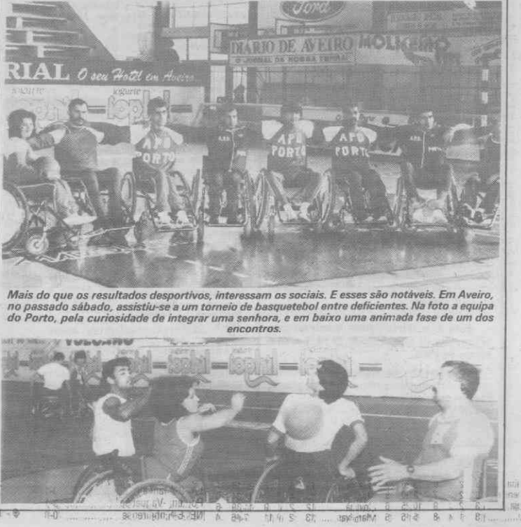
More text from the caption describing the basketball tournament for disabled people.