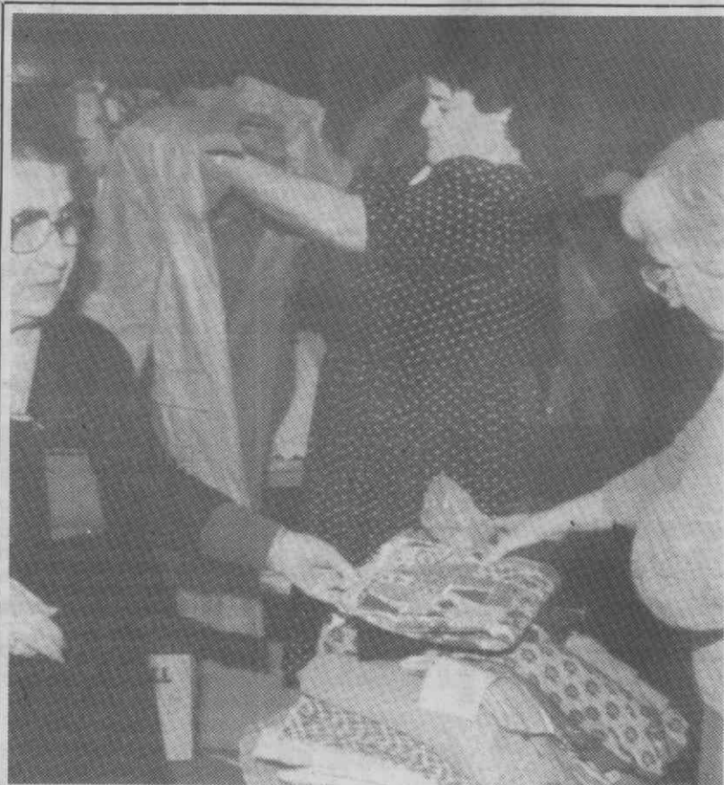
SAN FRANCISCO — Voluntárias arménias escolhem e dobram roupas doadas para serem enviadas para as áreas devastadas pelo recente terramoto que assolou a Arménia. Entretanto, mais de 50.000 dólares em cheque e dinheiro foram também doados para as vítimas da tragédia.