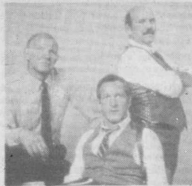
22.10 — Concorde ou Talvez Não 23.45 — Basquetebol