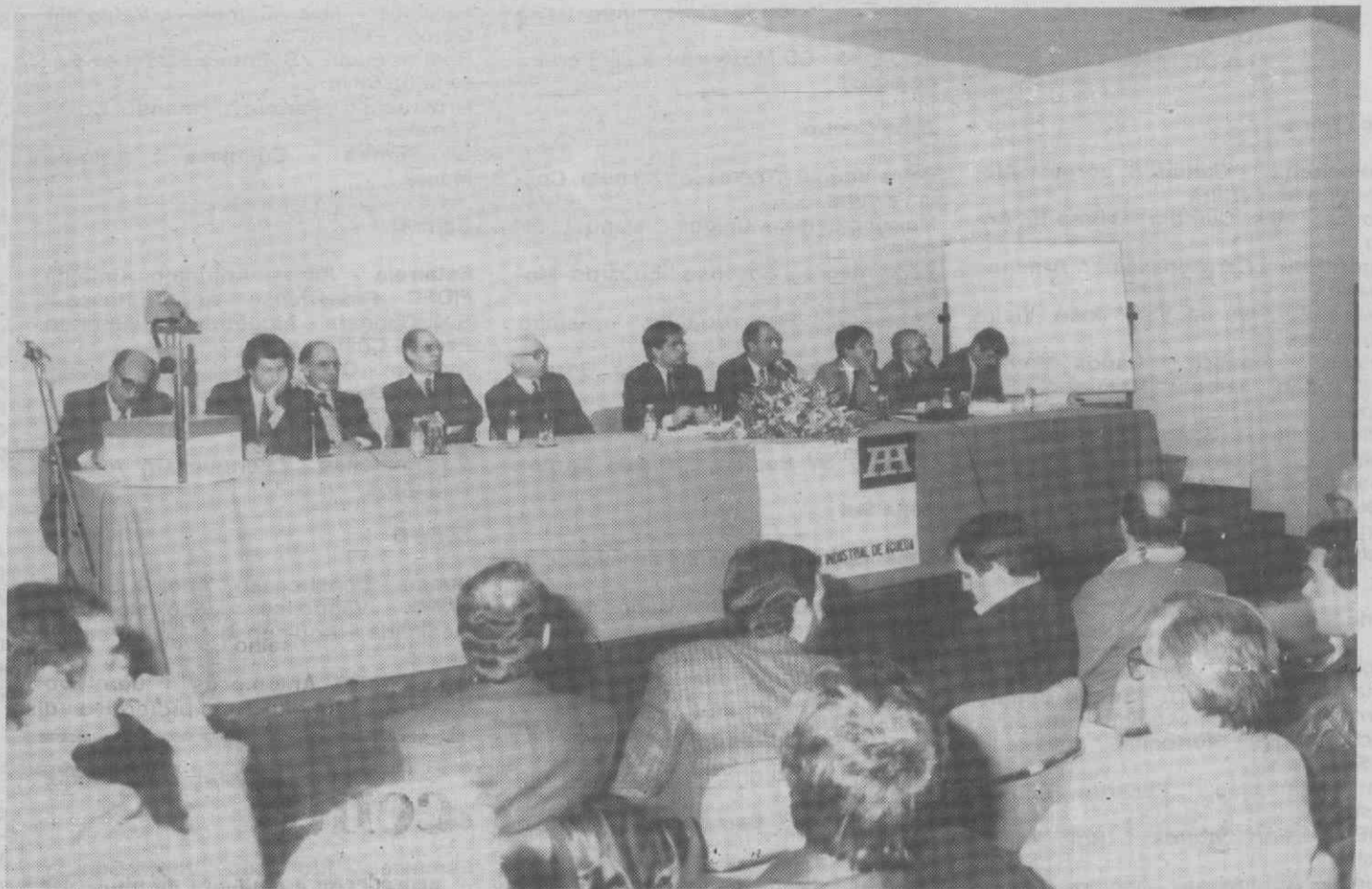
Um aspecto do encontro em que foram analisados os problemas do abastecimento de energia a Águeda.

violentas, fortes ventanias, postos de transformação parcialmente destruídos, etc., foram factores que, segundo o eng. Basílio, estiveram na origem dos cortes diários de energia verificados em Outubro na região de Águeda.