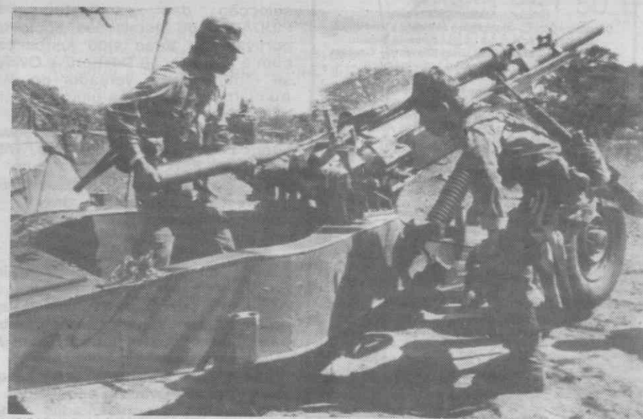
AGUILARES (EL SALVADOR) — Dois soldados salvadorenses disparam uma arma de artilharia sobre as posições ocupadas pela guerrilha no vulcão Guazapa.