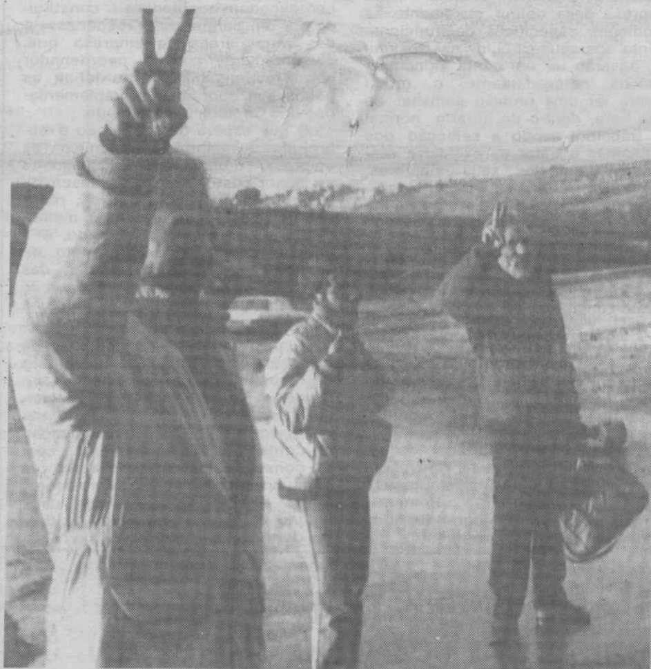
EZ ZHOUR (LÍBANO) — Três palestinianos deportados pelos israelitas, fazem o sinal do «V» à sua chegada à aldeia de Marj Ez Zhou.