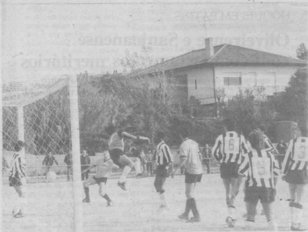
O ataque aveirense, na primeira parte, não soube aproveitar as oportunidades criadas.