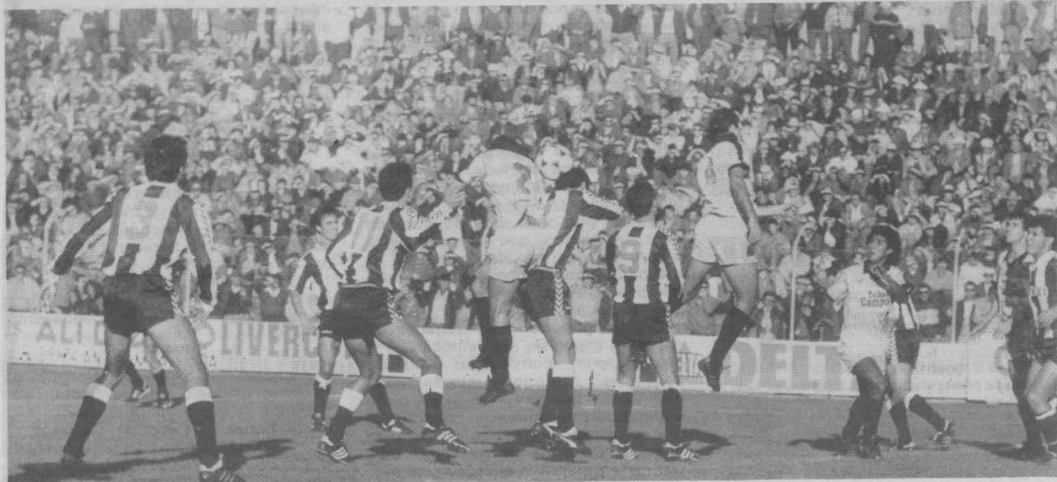
O aglomerado junto às redes do Nacional da Madeira não deu frutos aos «auri-negros».