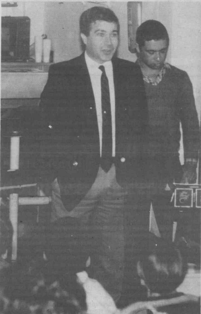
O inspector da Polícia Judiciária de Aveiro na abertura da Festa de Natal daquela Polícia.

No fim do espectáculo foram distribuídas as prendas de Natal às três dezenas de crianças presentes, que no meio da algazarra que lhes é característica os abriram em grande alegria. O convívio terminou com os também tradicionais «comes e bebes», desta época festiva.