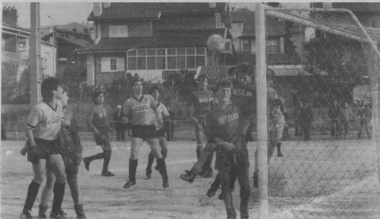
No encontro que opôs os juniores do Beira Mar e do Recreio de Águeda, os auri-negros exerceram claro ascendente, reflectido nesta imagem junto às redes aguedenses.

Na III Divisão — Série C — o Guarda isolou-se no primeiro lugar ao vencer em Vale de Cambra e beneficiando do empate da Oliveirense