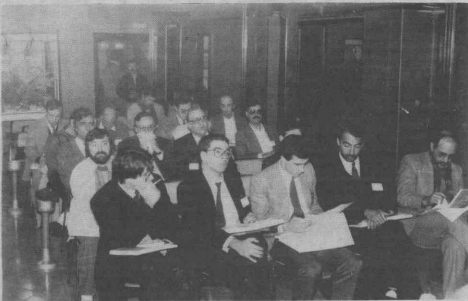
Um aspecto dos participantes às Primeiras Jornadas Médicas Desportivas.