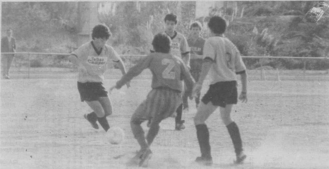
Mais uma jogada dos avançados aveirenses.

Jogo no Estádio Mário Duarte (campo de treinos).