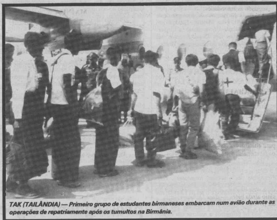
TAK (TAILÂNDIA) — Primeiro grupo de estudantes birmaneses embarcam num avião durante as operações de repatriamento após os tumultos na Birmânia.

Os rebeldes afegãos têm vindo a lançar sucessivos ataques com morteiros contra posições do Exército governamental, sobretudo depois que os soviéticos iniciaram o processo de retirada do país de cerca de 100.000 militares, o qual deverá estar concluído até 15 de Fevereiro.