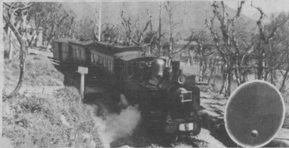
O Conselho de Gerência da CP, pautado pela bitola europeia, tornou-se liquidatário ao ditar a condenação da via estreita.

Deixemo-nos de xenofobias e de xenomanias! Parem de estrangular o nosso caminho de ferro e criem uma mentalidade mais culta e até mais humana! Não destuam mais o patri-