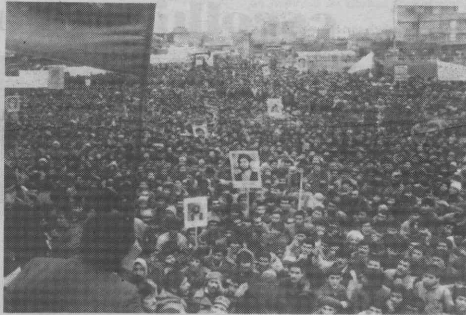
TEERÃO — Manifestação de refugiados afegãos para assinalar o nono aniversário da invasão do seu país por tropas soviéticas.

De acordo com o informador do Serviço de Apostas Mútuas «o valor dos prémios do Totobola deverá passar a ser superior a 20 mil contos».