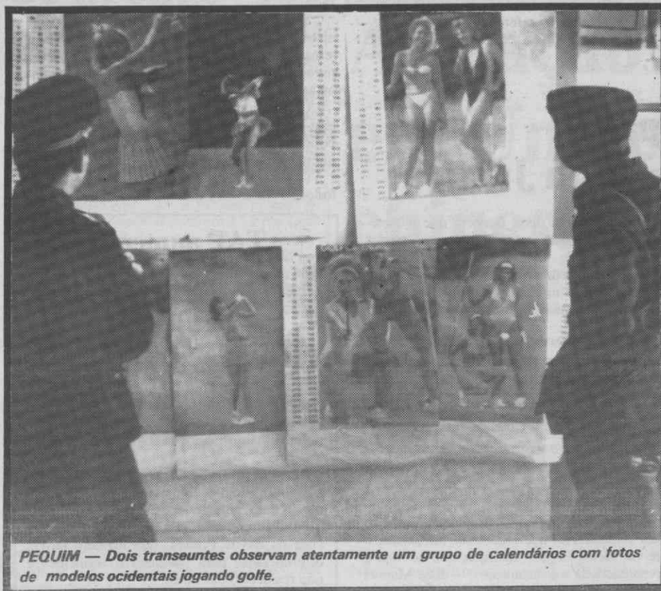
PEQUIM — Dois transeuntes observam atentamente um grupo de calendários com fotos de modelos ocidentais jogando golfe.