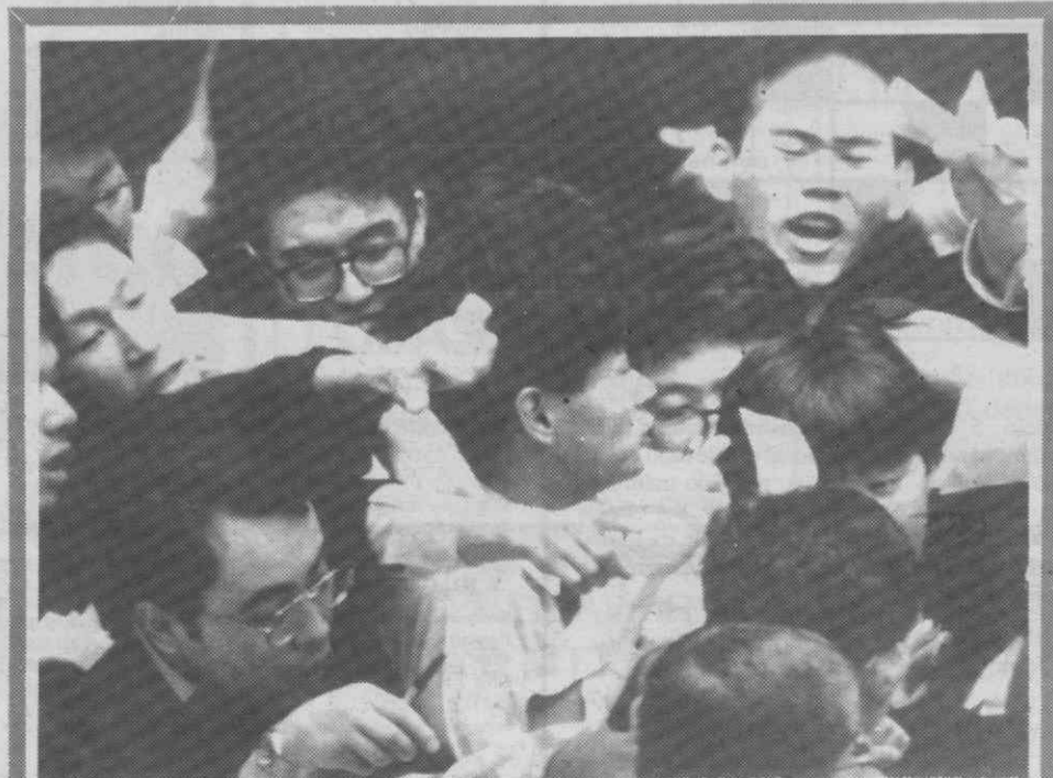
TOQUIO — Aspecto parcial dos corretores da Bolsa de Tóquio durante a sessão de ontem de manhã.