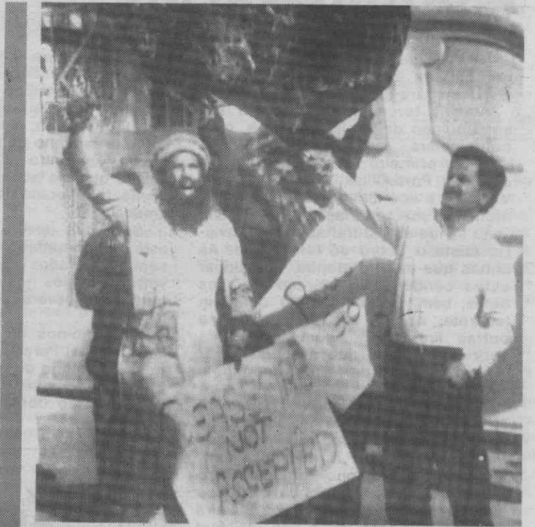
CARACHI — Estudantes afegãos queimam a bandeira soviética.

Famílias ainda à espera de casa de renda social