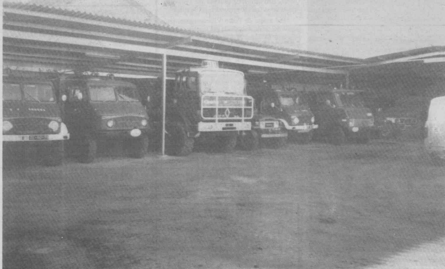
Das viaturas dos B.V. de Águeda, sendo a da direita distribuída ao comandante operacional da Zona Centro, o comandante dos bombeiros de Águeda.