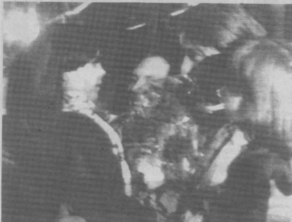
TRIPOLI — As duas irmãs francesas após terem sido libertadas na Líbia.

Trata a Agência Funerária Capela (Esgueira).