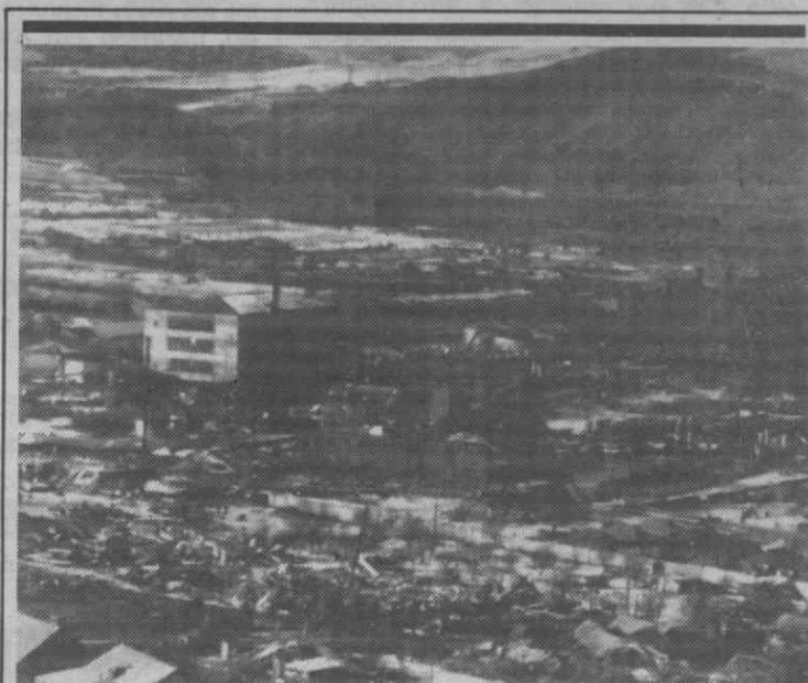
SPITAK — Vista aérea de Spitak completamente destruída pelo tremor de terra que atingiu a Arménia.

Aproveitamos a oportunidade para desejar a todos os nossos assinantes, leitores, colaboradores, anunciantes e amigos as maiores venturas no ano que amanhã começa, com os votos de que 1989 seja o portador das possibilidades de concretização dos anseios de cada um. Bom ano.