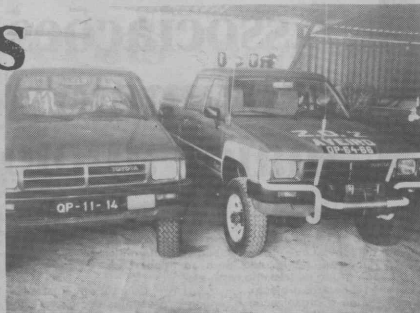
Um aspecto parcial do parque de viaturas dos B.V. de Águeda.

A Associação Humanitária dos Bombeiros Voluntários de Águeda pode, assim, orgulhar-se de ter a corporação mais bem apetrechada do