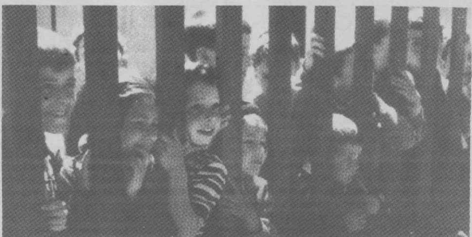
Indiscrição — Cenas da vida quotidiana.