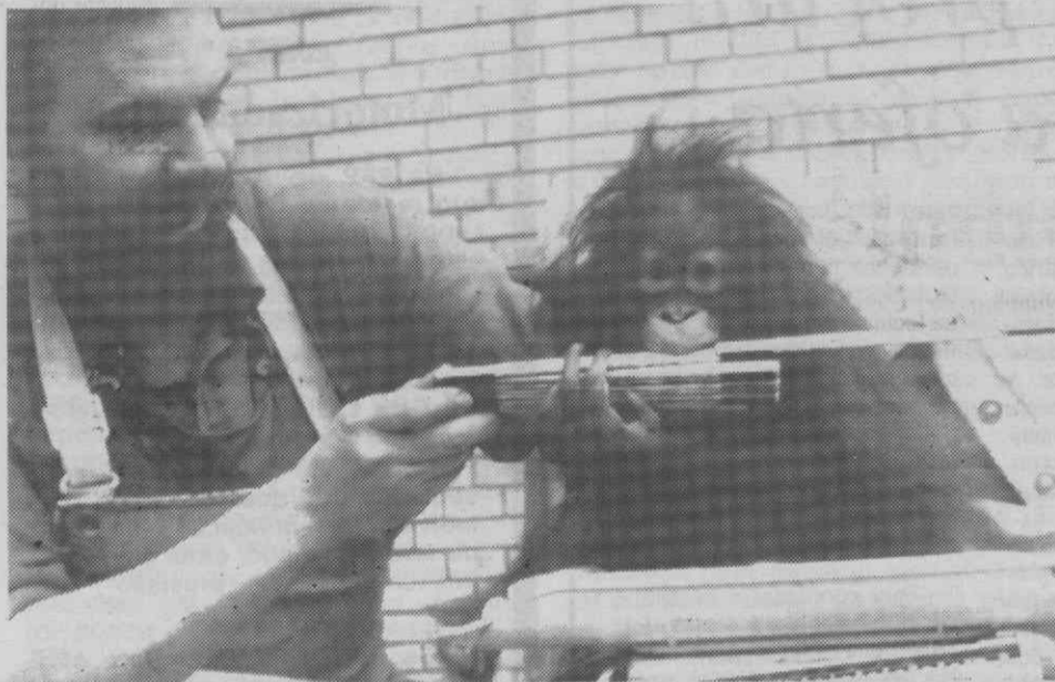
DUISBURGO (Alemanha Federal) — Um orangotango bebé divertido enquanto um empregado do Zoo o mede.

O maior accionista de empresa é, actualmente, o empresário Baptista Lopes, com 37,5 por cento, seguindo-se a TAP, com 30 por cento e diversos outros accionistas com 2,5 por cento cada, onde se incluem a ANA (Aerportos e Navegação Aérea), a Rodoviária Nacional, os CTT/TLP e as Câmaras Municipais.