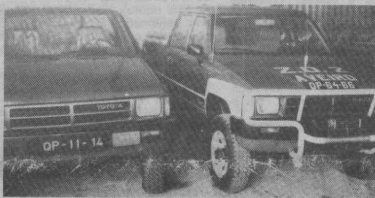
Duas viaturas dos B.V. de Águeda, sendo a da direita distribuída ao comandante operacional da Zona Centro, o comandante dos bombeiros de Águeda.

Corporação carece do auxílio económico das empresas da região