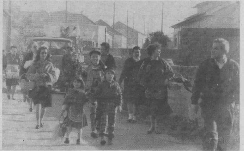
Um aspecto do cortejo de oferendas em Mataduchos.

Refira-se ainda que no próximo domingo, a comissão responsável pela capela vai organizar um lanche, dirigido à terceira idade e aos deficientes de Mataduchos, que terá lugar junto à capela.