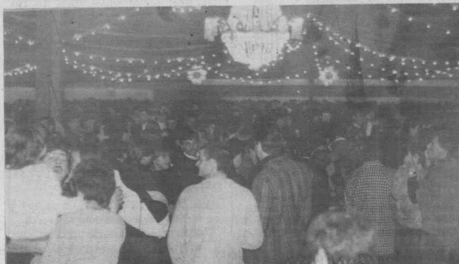
A animação foi grande e o espaço acabou por ser «apertado».

A festa «rija» como seria de esperar, durou até cerca das 03.30 da madrugada de domingo e as receitas, cujo montante ainda não está apurado, servirão para custear algumas das despesas dos bombeiros, referentes sobretudo a encargos de manutenção.