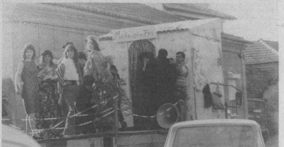
No cortejo de oferendas, em Mataduchos, a moda esteve presente.