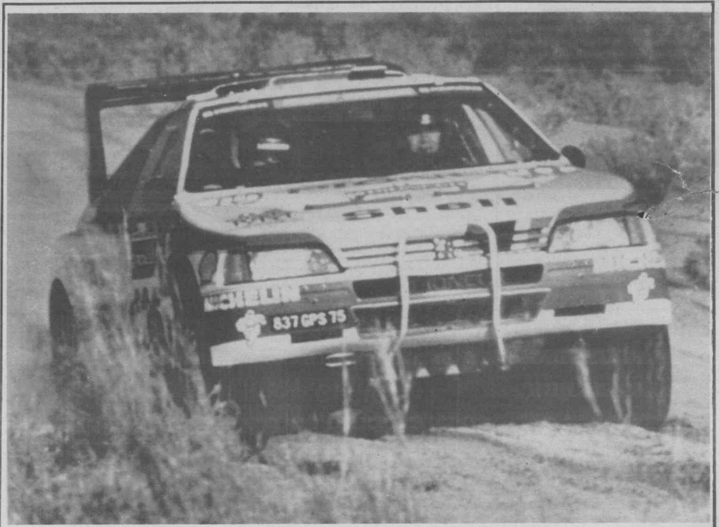
PARIS (Rali Paris Dakar) — O campionissimo belga Jacky Ickx, num trecho daquela prova internacional, guiando o seu Peugeot 405 T16 em pleno deserto tunisino. Ickx, que terminou em 2.º lugar, no dia anterior, na Nicarágua, mas perdeu, contudo, o comando da classificação.

A anteceder a final, Portugal discutirá o terceiro lugar com a Hungria, segunda classificada no Grupo 1.