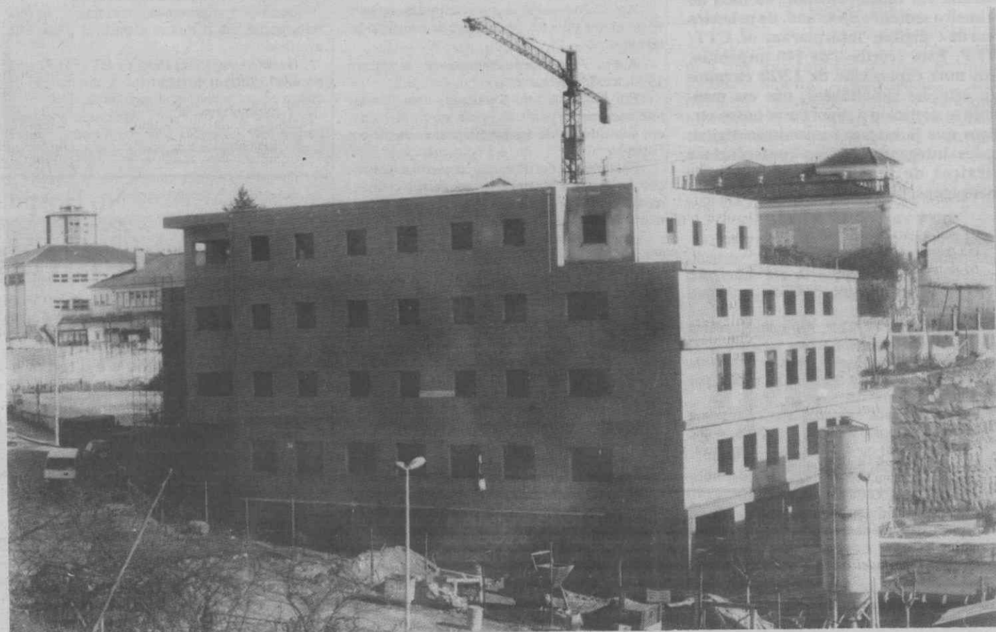
Logo que as obras do edifício «Marques de Castilho» chegarem ao seu termo, os CTT estão prontos para instalar a nova estação dos correios.

A AIA considera «vergonhosas» as condições de atendimento na actual estação. De facto, os três «guichets» existentes são manifestamente insuficientes em relação ao movimento que se regista nos Correios. «Exiguas e ultrapassadas», como refere a AIA, as instalações não satisfazem minimamente as necessidades da indústria da região, constituindo, ainda segundo aquela Associação, «um