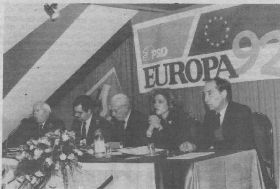
A mesa que presidiu aos trabalhos, encontrando-se o presidente da Assembleia Distrital de Aveiro rodeado do ministro Silva Peneda e da secretária de Estado, Isabel Mota.