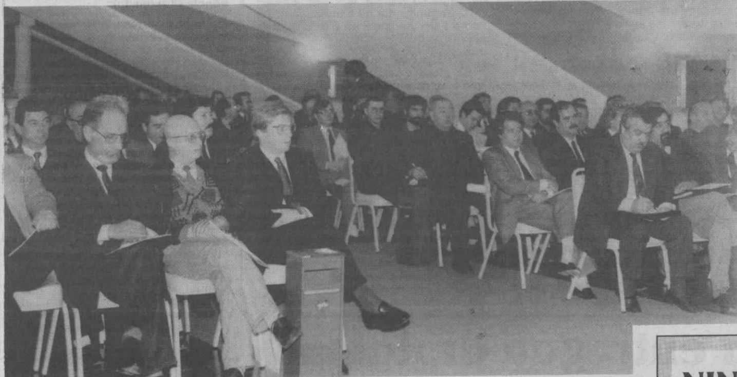
Um aspecto da assistência ao colóquio.

Por último, o Plano de Actividades e Orçamento da Junta de Freguesia para 1989 mereceu a concordância de todos os representantes que, durante a sua discussão destacaram a injustiça de que a Junta de Silvalde, de maioria PS, está a ser vítima por parte da Câmara de Espinho.