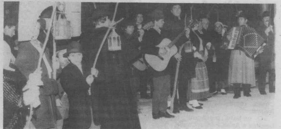
Um aspecto da actuação do grupo. Nossa Senhora dos Altos-Céus