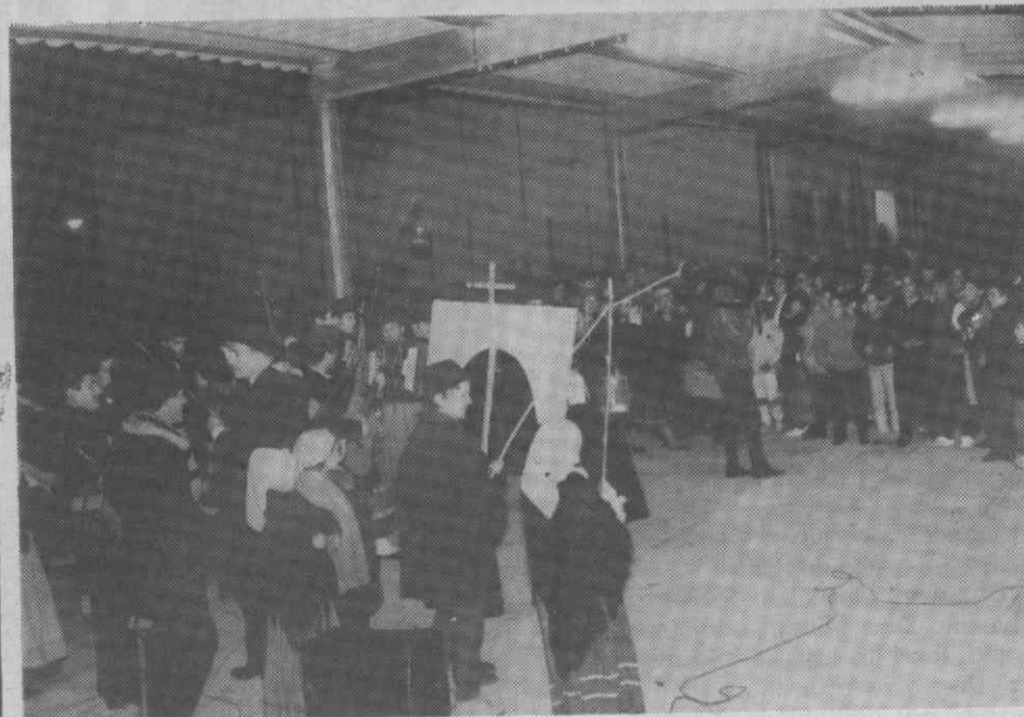
Não faltaram pessoas a acolher o cantar das Janeiras.