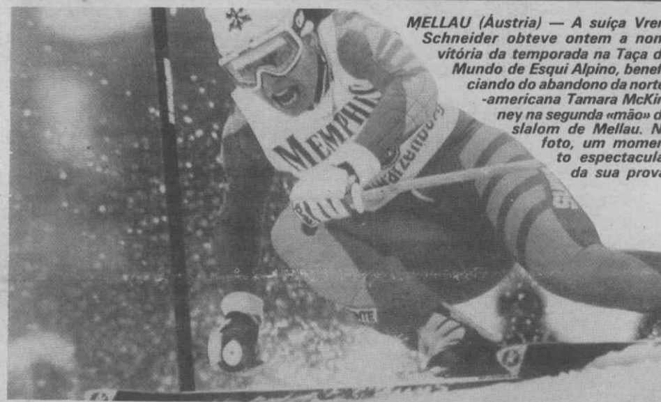
MELLAU (Áustria) — A suíça Vreni Schneider obteve ontem a nona vitória da temporada na Taça do Mundo de Esqui Alpino, beneficiando do abandono da norte-americana Tamara McKinney na segunda «mão» do slalom de Mellau. Na foto, um momento espectacular da sua prova.

Ler mais informação desportiva no interior desta edição.