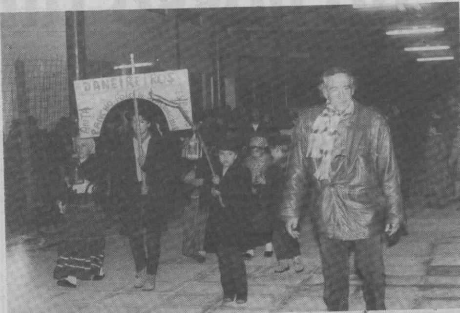
A chegada do Grupo Nossa Senhora dos Altos-Céus à Escola Preparatória de Esgueira.

O Grupo reconstituiu, entre outros, segadas, malhadas, cantares de Janeiras e escapeladas de festas e é membro efectivo da Federação do Folclore Português.